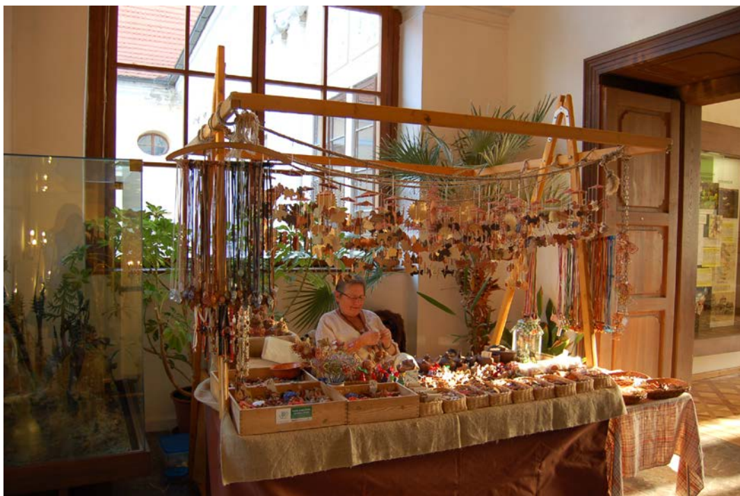
Obr. 13 Program v rámci vlašimské Zámecké muzejní noci