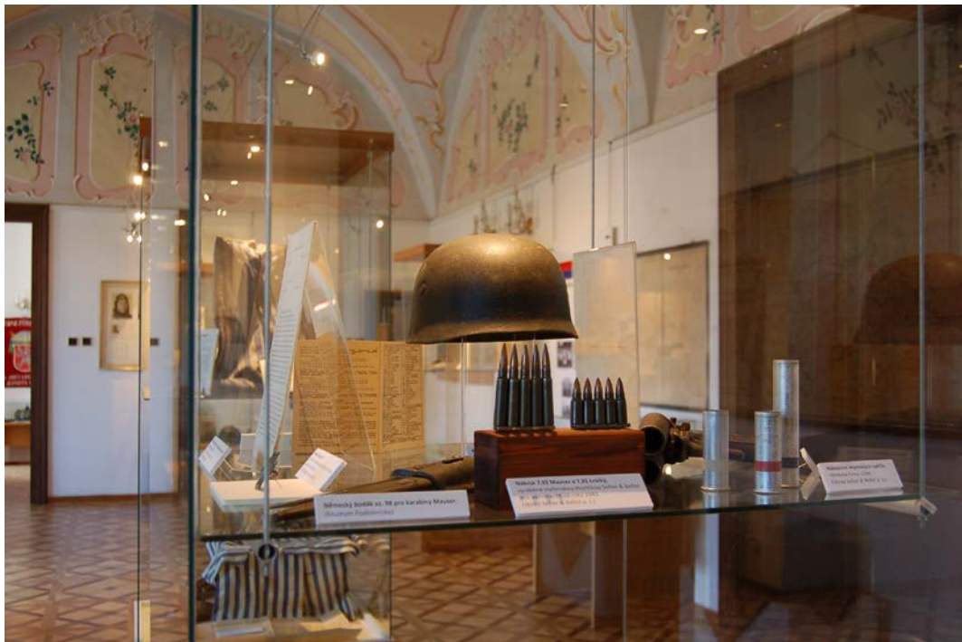
Obr. 9 Ukázka z instalace výstavy II. světová válka a Podblanicko ve vlašimském zámku