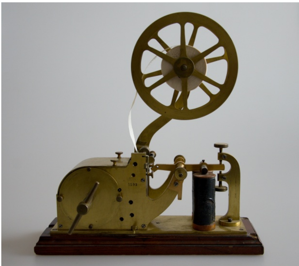
Obr. 1 Mezi sbírkovými předměty získanými darem byl například telegrafní přístroj z přelomu 19. a 20. století

Rozšíření sbírkového fondu muzea proběhlo především prostřednictvím nákupů, zápisu nálezů získaných v rámci záchranné archeologické činnosti a prostřednictvím darů do muzejních sbírek. Z celkového počtu nově získaných přírůstků připadlo 154 položek na dary, které věnovalo muzeu celkem 10 dárců.