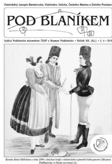
Obr. 17- 18 Obálky publikace Vlašimský velkostatek ve fotografii před 100 lety a dnes a 4. čísla 19. ročníku časopisu Pod Bláníkem