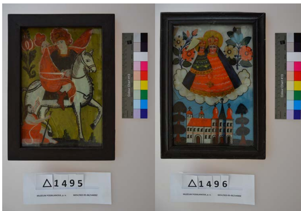
Obr. 5-6 Podmalby na skle sv. Martin a Panna Maria Zellská (inv. 1495 a 1496) ze sbírek muzea zrestaurované v roce 2015