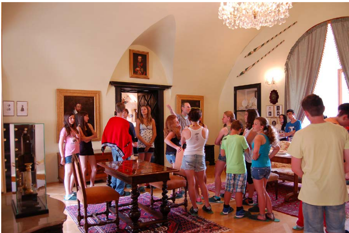
Obr. 12 Komentovaná prohlídka pro školy v expozici Auerspergové

Dobrou spolupráci má muzeum se školami v regionu. Kromě běžné nabídky prohlídek expozic, výstav a odborných exkurzí pro školní mládež se konaly i další akce se