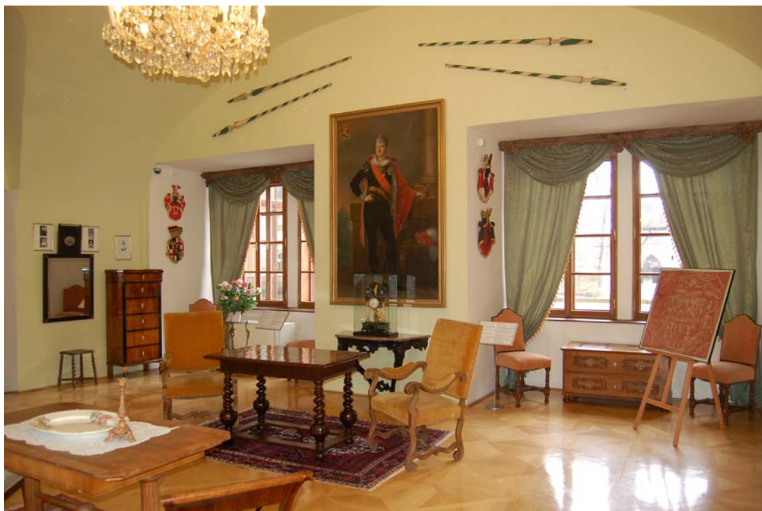
Obr. 8 Expozice Auerspergové ve vlašimském zámku