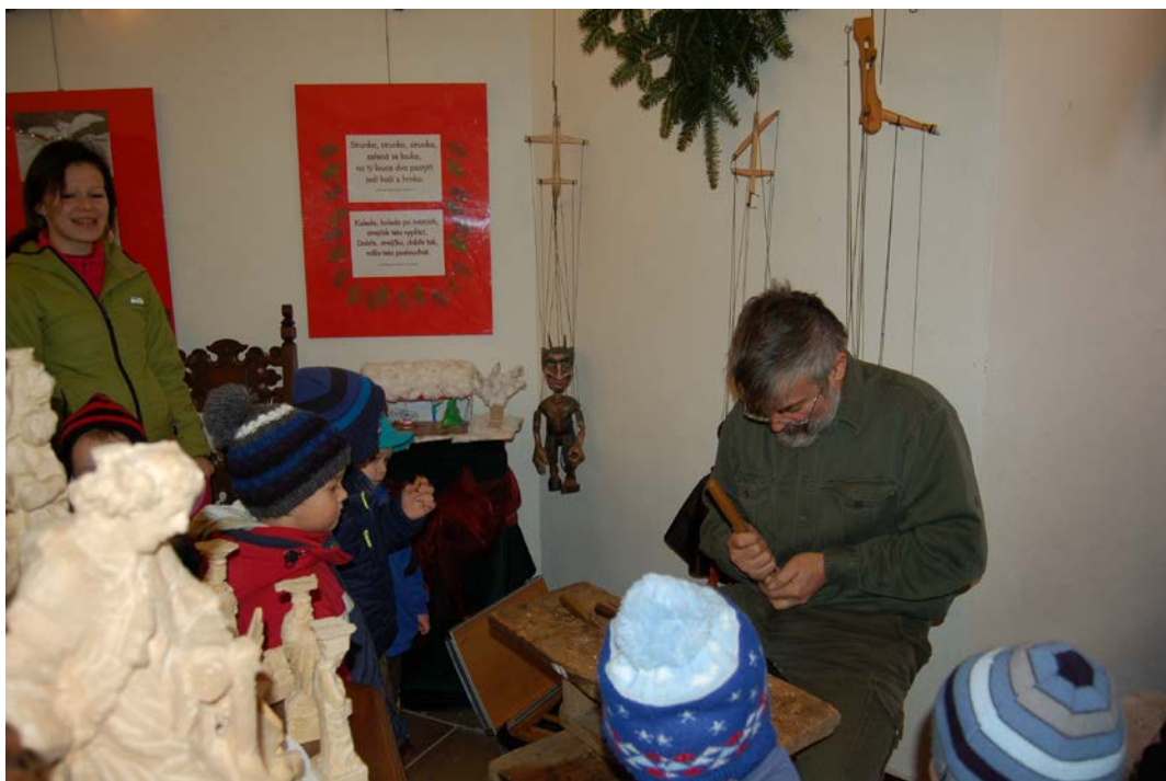
Obr. 14 Ukázka řezbářského řemesla v rámci výstavy Tvořivý advent ve vlašimském zámku