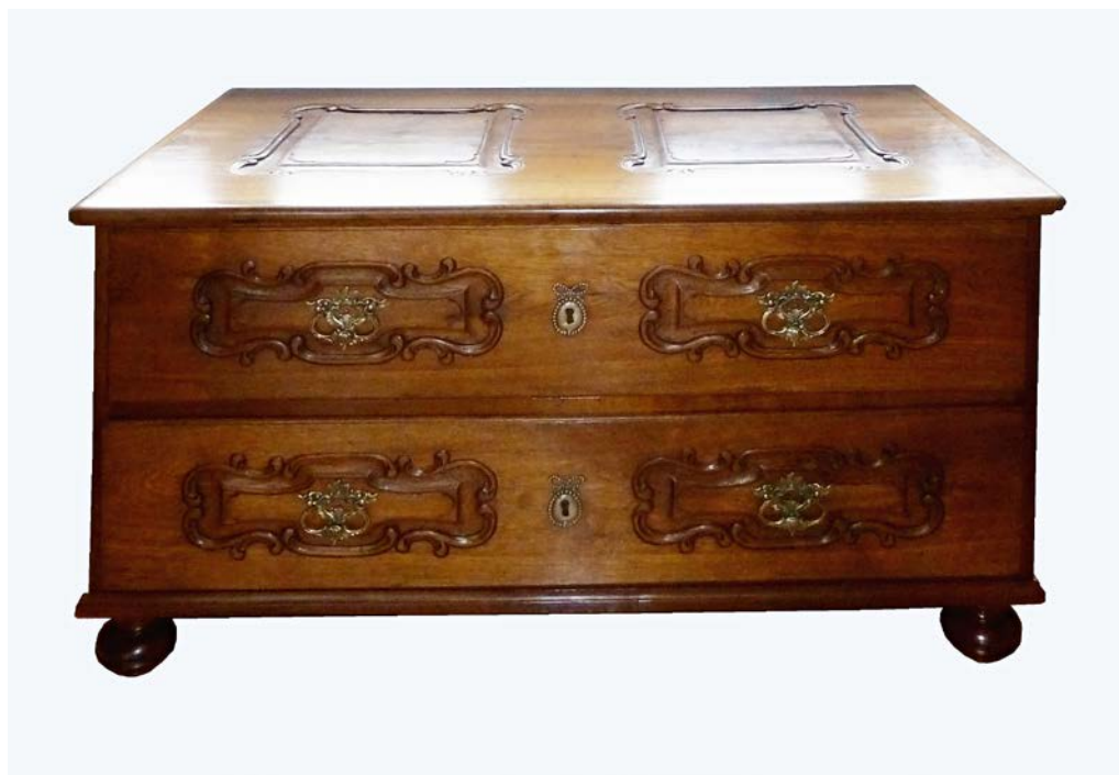
Obr. 4 Dřevěná komoda v historizujícím stylu (inv. 38940) ze sbírek muzea zrestaurovaná v roce 2015