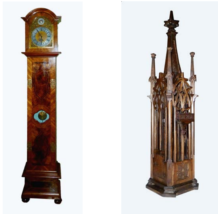
Obr. 2-3 Dřevěné intarzované sloupové hodiny (invc. 22610) a dřevěná ptačí klec v historizujícím stylu (invc. 2697) ze sbírek muzea zrestaurované v roce 2015

Knihovna a fotoarchiv muzea ve sledovaném roce vykázaly 133 badatelských návštěv.