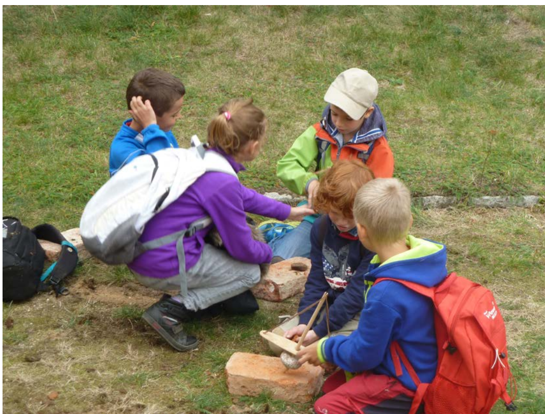
Obr. 16 Edukační program „Dotkněte se pravěku“ v Růžkových Lhoticích

Návštěvnost Muzea Podblanicka, p. o., v roce 2015 činila celkem 20708 návštěvníků, přičemž expozice a výstavy muzea navštívilo 15000 návštěvníků, akcí muzea pořádaných v rámci kulturně výchovné činnosti se zúčastnilo celkem 5708 návštěvníků.