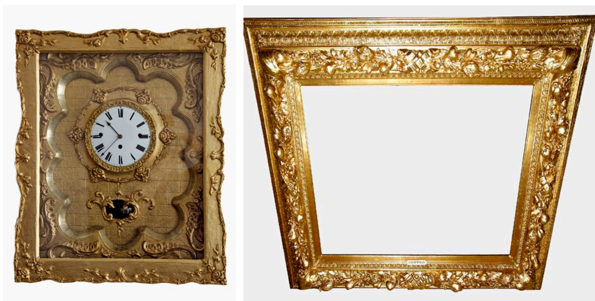
Obr. 3-4 Dřevěné nástěnné skříňové hodiny zdobené plastickým dekorem (invc. 116) a dřevěný zlacený rám obrazu zdobený plastickým rostlinným dekorem (invc. 22830) patří mezi předměty ze sbírek muzea zrestaurované v roce 2016

Knihovna, fotoarchiv muzea a jednotliví odborní muzejní pracovníci ve sledovaném roce vykazali celkem 105 badatelských návštěv.