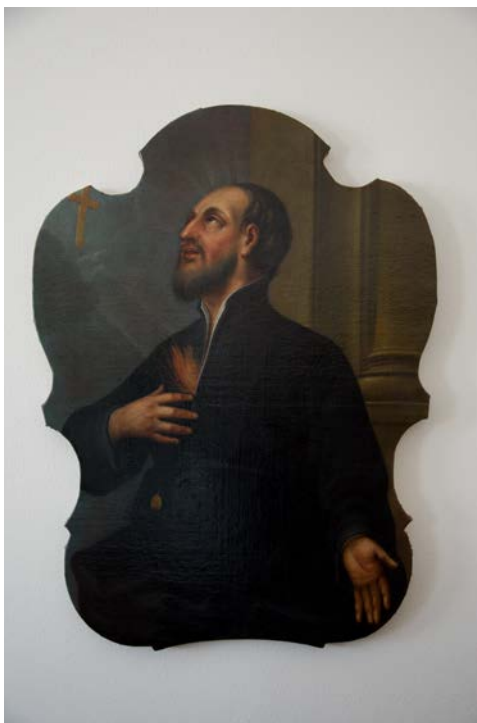
Obr. 5 Barokní obraz sv. Františka Xaverského (inv. 3516) ze sbírek muzea zrestaurovaný v roce 2016