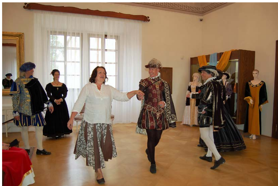
Obr. 14 V rámci Dnů evropského kulturního dědictví si mohli návštěvníci vyzkoušet, jak se ve vlašském zámku tančilo v renesanci