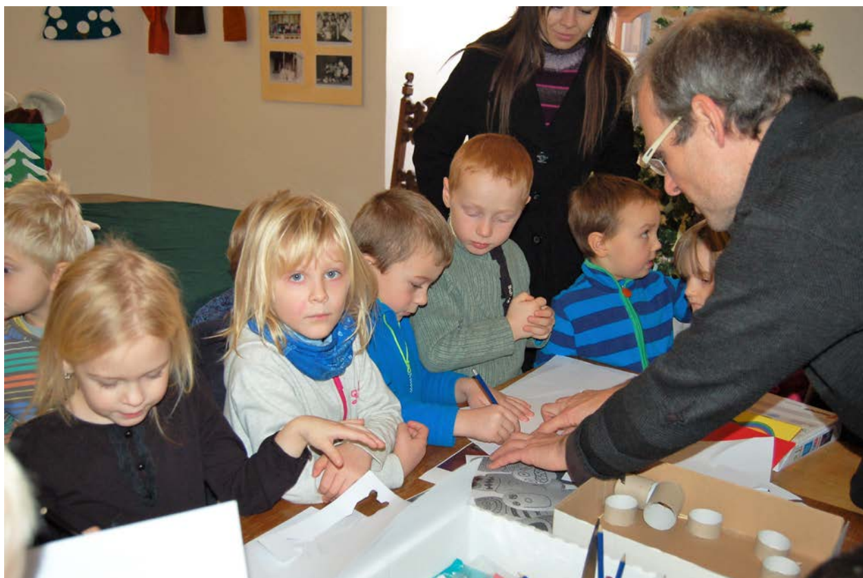
Obr. 18 Edukační program v rámci výstavy V chalupách pod Blaníkem ve vlašimském zámku