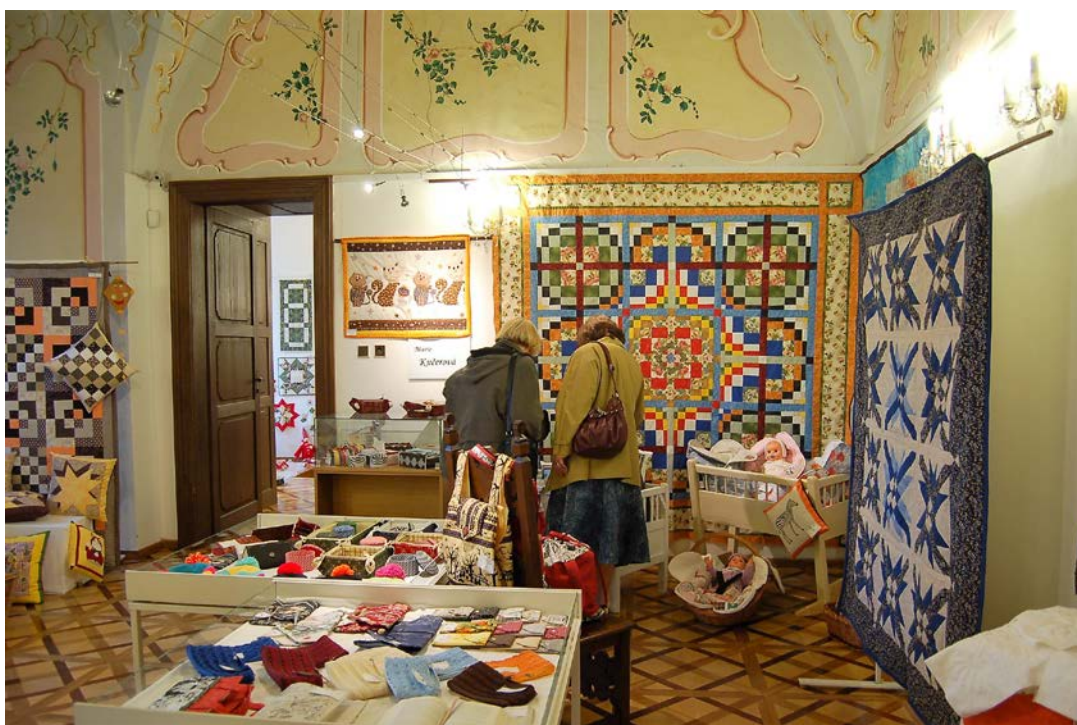
Obr. 10 Instalace výstavy Podblanický patchwork ve vlašimském zámku