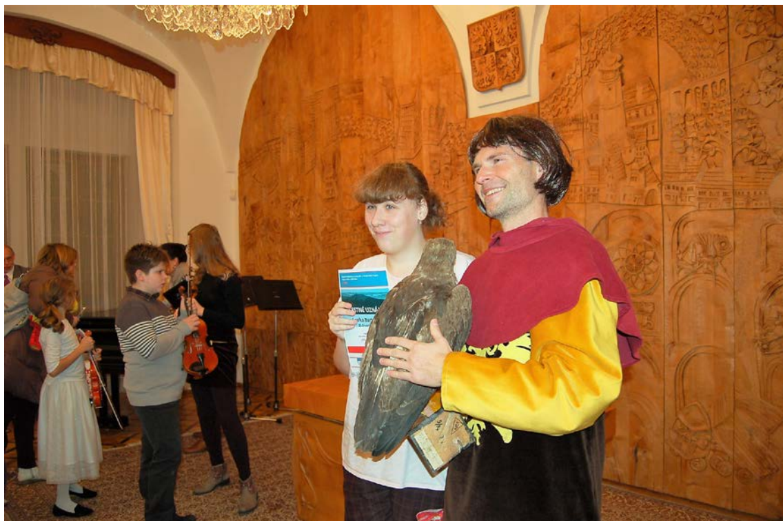
Obr. 16 Slavnostní vyhodnocení výtvarné soutěže Malujeme s muzeem