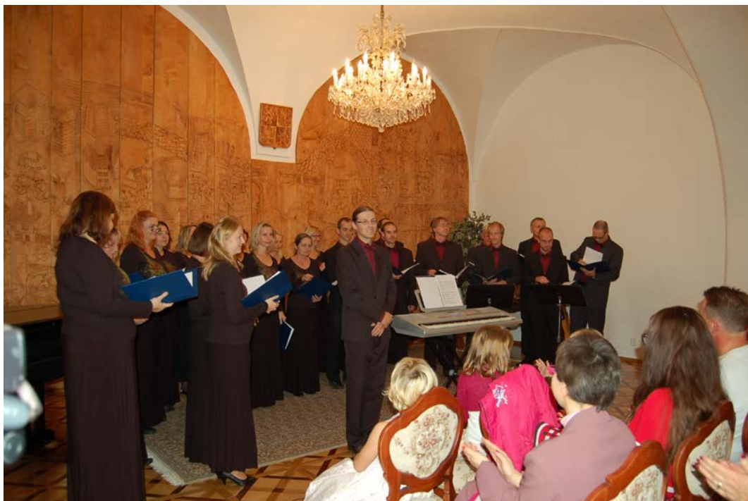
Obr. 13 Hudební vystoupení jsou neodmyslitelnou součástí většiny vernisáží výstav. Nejinak tomu bylo i v případě vernisáže výstavy Podblanický patchwork, kde vystoupil smíšený pěvecký sbor DECH