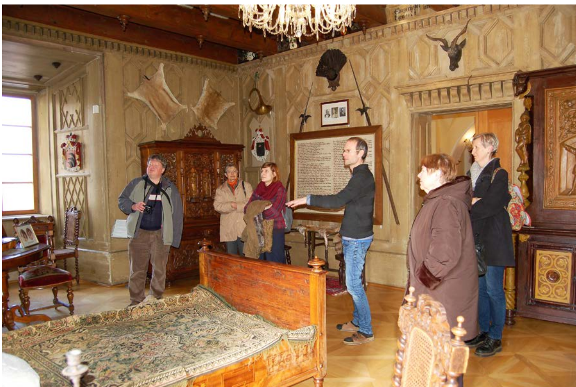
Obr. 8 S expozicí Auerspergové ve vlašimském zámku se muzeum zúčastnilo soutěže Gloria musaelis, fotografie zachycuje návštěvu hodnotitelské komise

V roce 2016 zpřístupňovalo Muzeum Podblanicka, p. o., návštěvníkům celkem devět stálých expozic – expozice Zámecké parky a historie zámku Vlašim, Příroda Podblanicka, S přesnou muškou. Tradice lovectví a zbrojařství, Auerspergové, Město pod věží aneb Vlašim na dlani a Tajemství zámeckého sklepení ve Vlašimi, expozice Historie města Benešov a Náš pluk v Benešově a expozici Kraj tónů v Růžkových Lhoticích. V zámku Vlašim byla dále návštěvníkům zpřístupněna dlouhodobá výstava Zrcadlo minulosti .