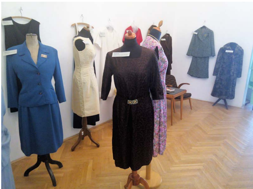
Obr. 11 Instalace výstavy Od secese k dnešku II. 1950 – 1980 v Benešově