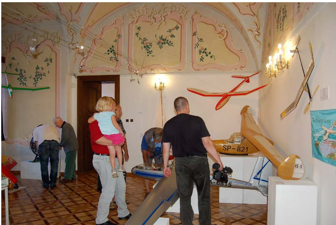
Obr. 9 Vernisáž výstavy 50 let Leteckého modelářského klubu ve Vlašimi ve vlašimském zámku