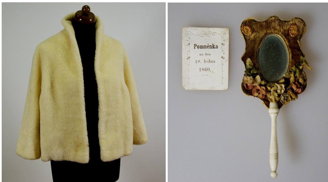
Obr. 1-2 Dámské palety ze slavného meziválečného pražského módního salonu Hanna Podolská a taneční pořádek z roku 1860 patří mezi předměty získané darem do sbírkového fondu muzea v roce 2016

Rozšíření sbírkového fondu muzea proběhlo především prostřednictvím nákupů, zápisu nálezů získaných v rámci záchranné archeologické činnosti a prostřednictvím darů do muzejních sbírek. Z celkového počtu nově získaných přírůstků připadlo 130 položek na dary, které věnovalo muzeu celkem 13 dárců.