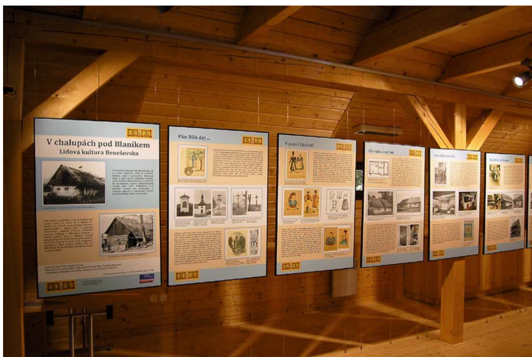
Obr. 12 Instalace výstavy V chalupách pod Bláníkem v Domě přírody Bláníku