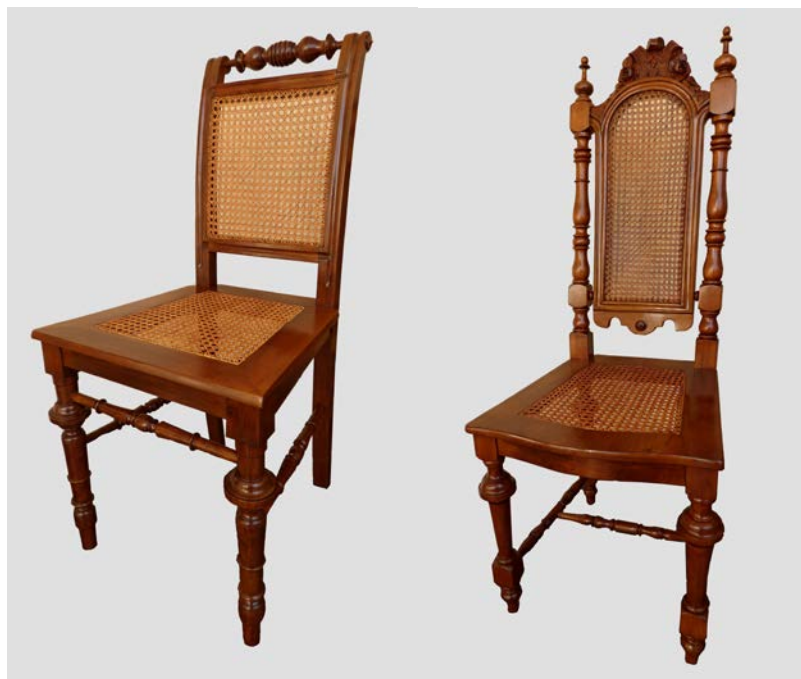
Obr. 6-7 Dvě ze čtyř dřevěných vyplétaných židlí v historizujícím stylu (inv. 24167 a 39160) ze sbírek muzea, zrestaurované v roce 2016