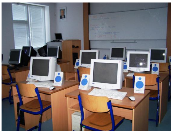
učebna výpočetní techniky

V učebně výpočetní techniky je 13 počítačů, takže vzhledem k nižšímu počtu žáků ve třídě má každý možnost pracovat samostatně, včetně využití internetu.