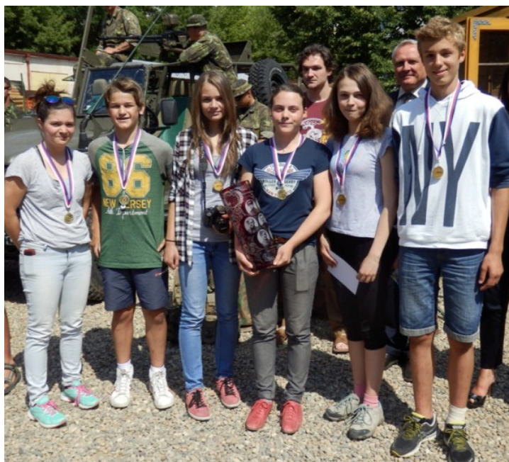
Army Birds s vítěznou trofejí