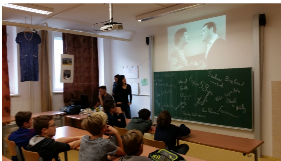
Oktáva (3. místo)