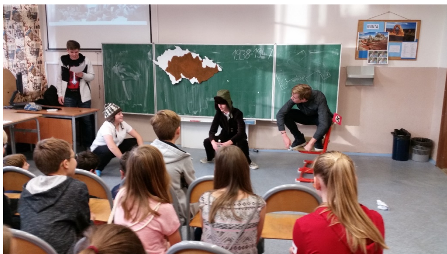
Kvinta (ve školním hlasování o nejlepší prezentaci 1. místo)

Pojem „projektový den“ u nás nebývá běžně skloňován, a tak jsme všichni napjatě očekávali, jak to v pátek 26. října vlastně dopadne. Každá z našich deseti tříd (dvě další byly v té době na exkurzi) dostala přidělené jedno desetiletí, které měla představit ostatním třídám.