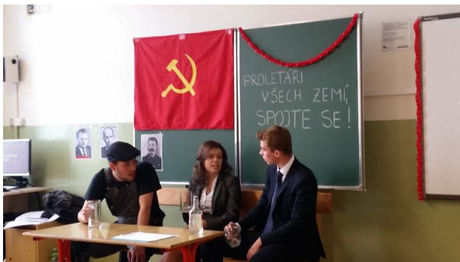
Septima (2. místo)