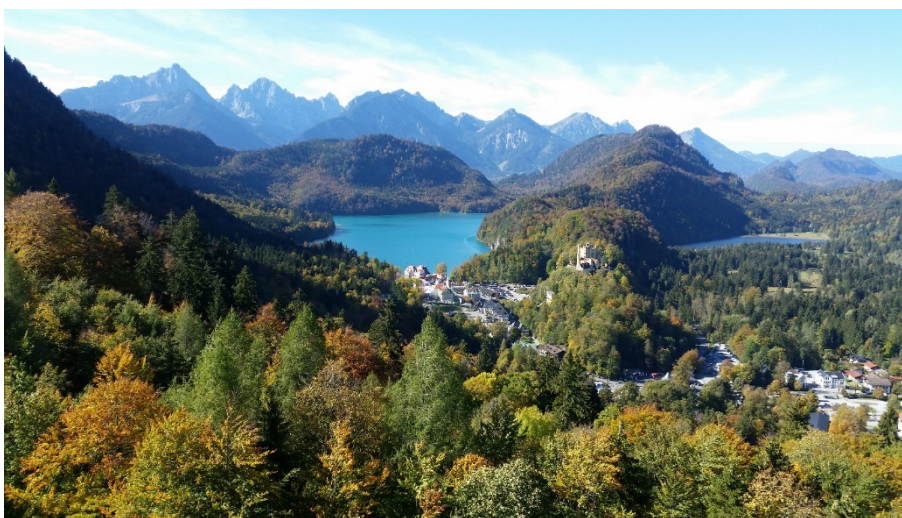
Pohled z Neuschwansteinu