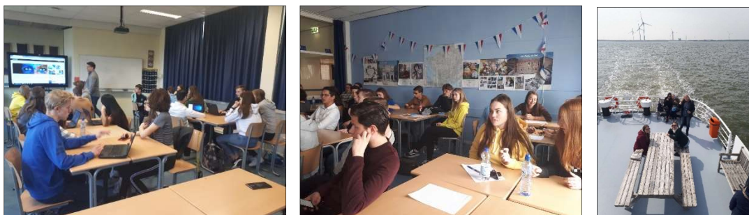
Výměnný program s Holandskem

Proběhly dva studentské výměnné programy s partnerskou školou z holandského Dongenu v Holandsku i v Česku.