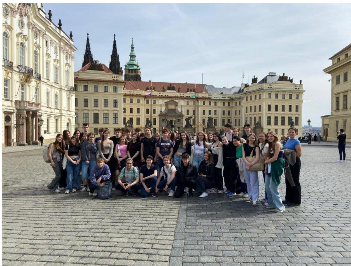
Obr. č. 5: Výlet do Prahy