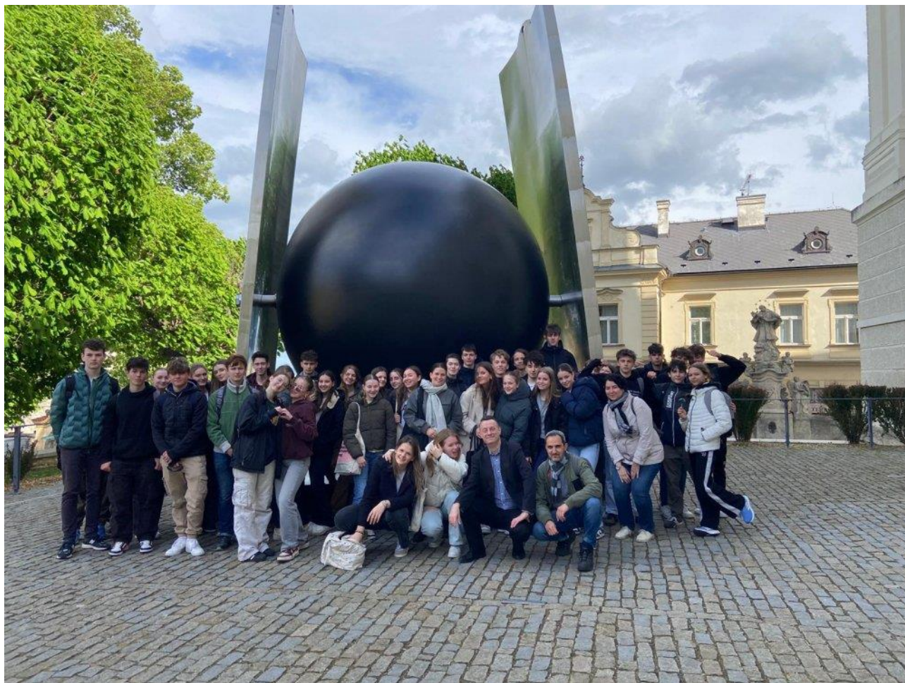
Obr. č. 3: Gymnázium Kolín a Cambreur College z Dongenu