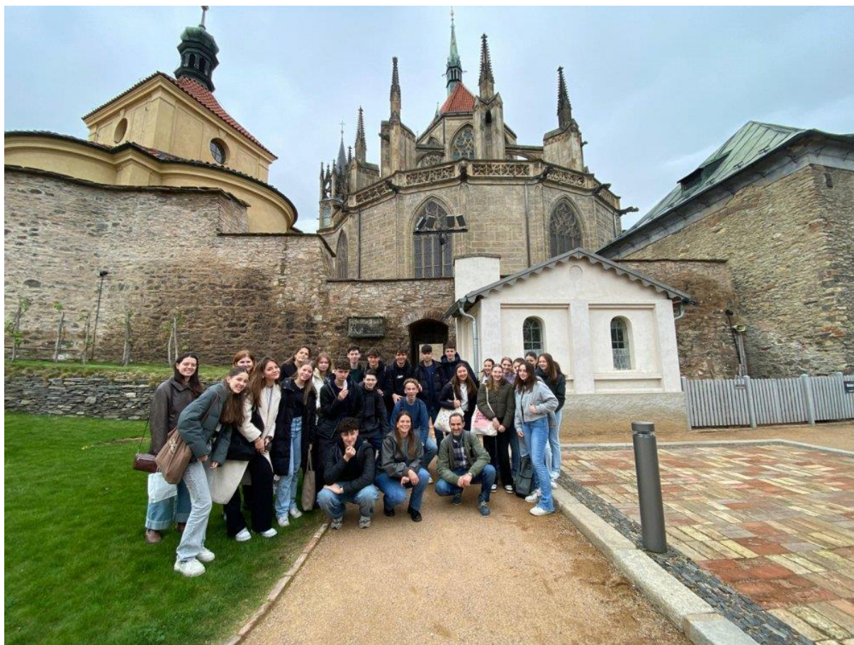
Obr. č. 4: Procházka po Kolíně