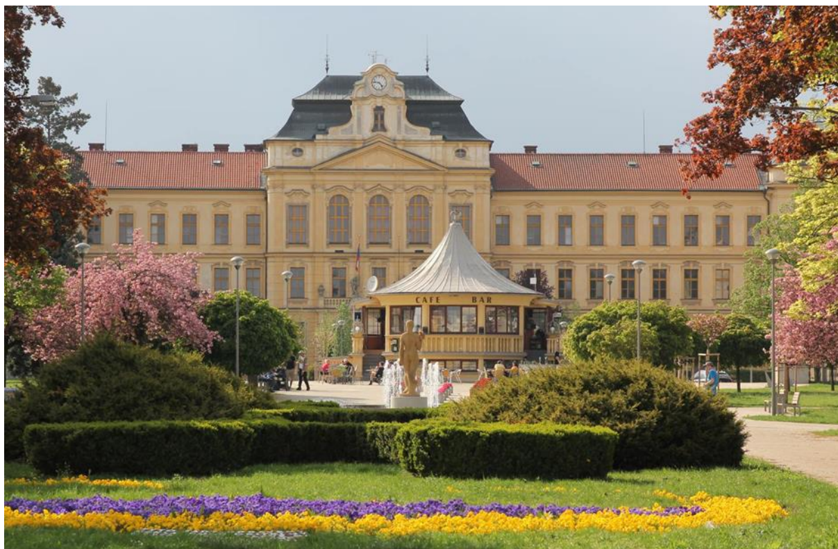
Gymnázium Dr. Josefa Pekaře, Mladá Boleslav, Palackého 211