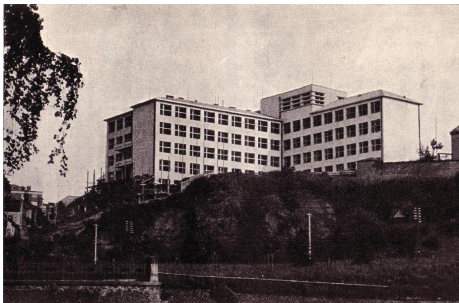
Pohled na budovu školy z lesoparku Štěpánka

Od školního roku 1990/1991 se škola vrátila k názvu Obchodní akademie. V devadesátých letech samozřejmě nedošlo jen k obměně názvu, ale uskutečnila se řada výrazných změn v obsahu i formách výuky, s cílem přizpůsobit profil absolventa školy změněným požadavkům praxe. Byla např. rozšířena výuka cizích jazyků (zkvalitňovaná mj. i působením zahraničních lektorů, výměnnými pobytovými zájezdy studentů a účastí školy v mezinárodních programech).