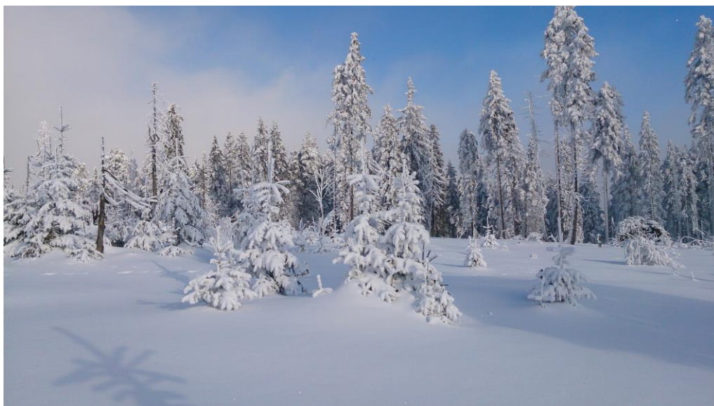
Lyžařský výcvik – Rokytnice nad Jizerou