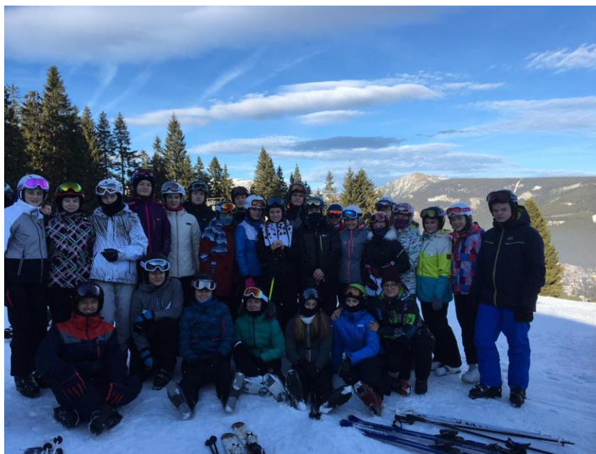
Lyžařský výcvik – třídy 1.B a 1.D, Pec pod Sněžkou

Lyžařský výcvik tříd 1.B a 1.D se konal 14.- 17. ledna 2020 v Peci pod Sněžkou. Kurzu se zúčastnilo 42 žáků, 5 instruktorů a třídní učitelka. Chata Svornost v Peci pod Sněžkou Na Zahrádkách poskytla žákům kvalitní zázemí pro absolvování kurzu, stravování s pitným režimem a ubytováním. V úterý 14. ledna jsme se dopravili na chatu, ubytovali, seznámili s okolím a provedli rozlyžování a začali s výcvikem v celém areálu. Ve středu, čtvrtek a pátek pokračoval sjezdový výcvik na svazích Hnědého vrchu, Javoru, Smrku a svahu U Lesa. Středu jsme využili ke konfrontaci při bězích na rovině a do kopce. Podmínky na lyžování byly vyhovující. Do večerního kulturního programu se zapojily obě třídy společně. První večer proběhla přednáška o bezpečnosti na horách - FIS 10.