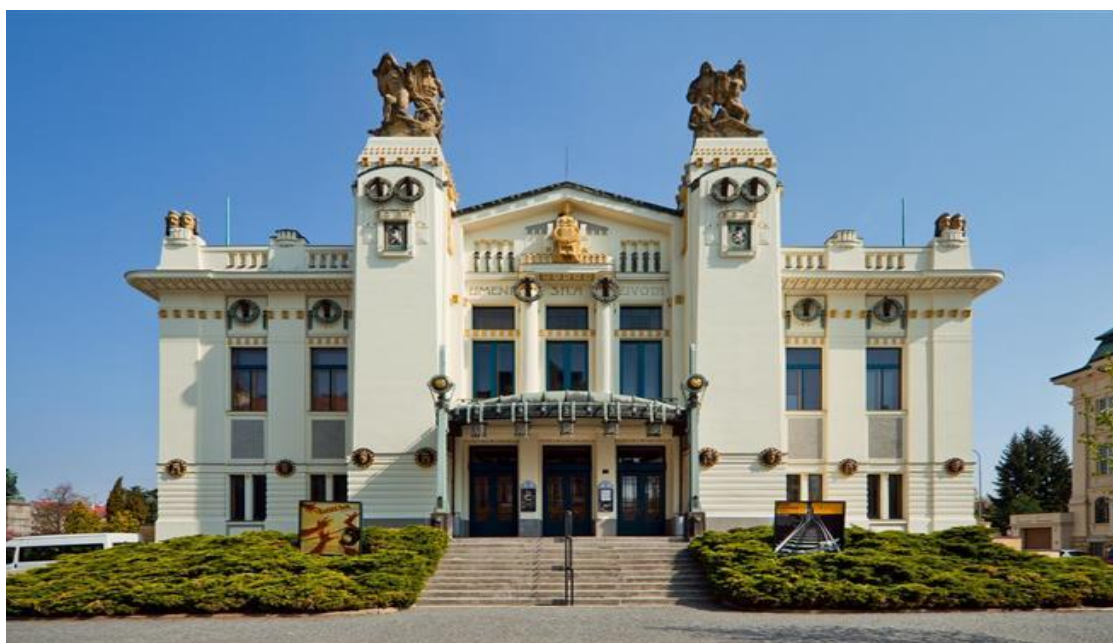
Městské divadlo Mladá Boleslav