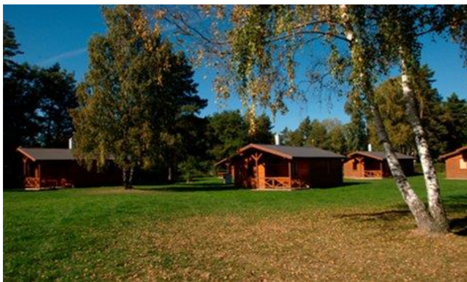
Sportovní kurz – Drhleny

Večerní program na konci STK vyplnil táborák, zpěv a opékání buřtů.