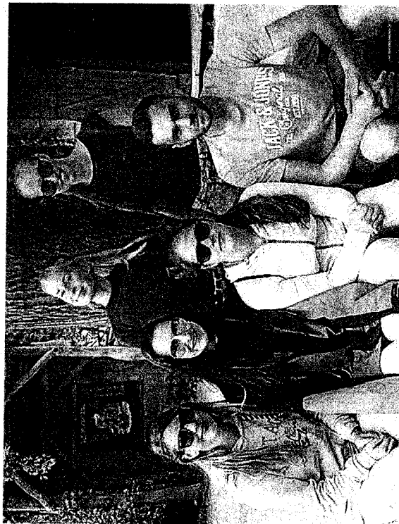
ÚČASTNÍCI Olympiády mladých chovatelů.

„Soutěžící dostali medaile, diplom a řadu dárek od sponzorů,“ dodala Nováčková a poděkovala Městskému úřadu Čáslav za příspěvek, bez něhož by se akce mohla uskutečnit jen s obtížemi. (red)