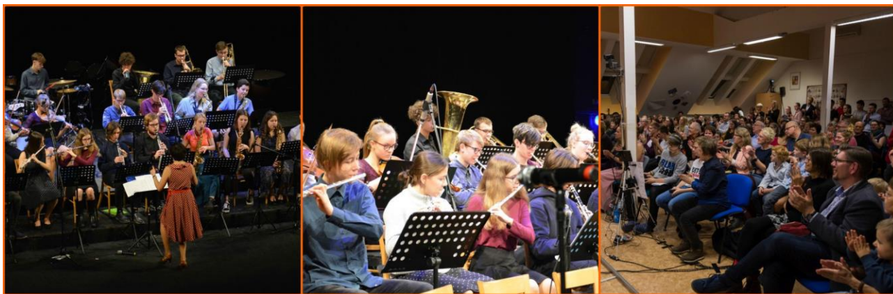
Vypracovala vedoucí orchestru Mgr. Miloslava Šmolíková