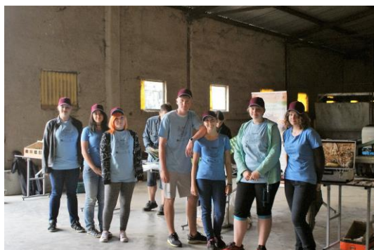
Obor Agropodnikání technologie

Na vyšší odborné škole se nevzdělával žádný cizí státní příslušník.