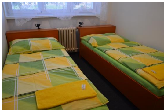
Rekonstrukce 1. křídla DM

Jako každý rok budeme provádět malování vnitřních prostor školy a DM a pokračovat ve snižování spotřeb energií výměnou dřevěných oken za plastová na budově DM. Provedeme opravu podlahy v tělocvičně. Navážeme na již provedenou opravu kanalizace další etapou rekonstrukce vodovodních rozvodů a odpadního potrubí v budově školy.