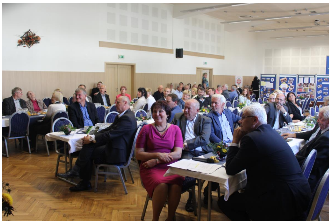
Výročí školy září 2016

Na DVPP jako vložné na semináře nebo jako školné v kurzech celoživotního vzdělávání bylo použito celkem 49 591 Kč (včetně cestovních nákladů); některé semináře (např. k maturitním zkouškám, některé odborné semináře) byly pořádány bez vložného.