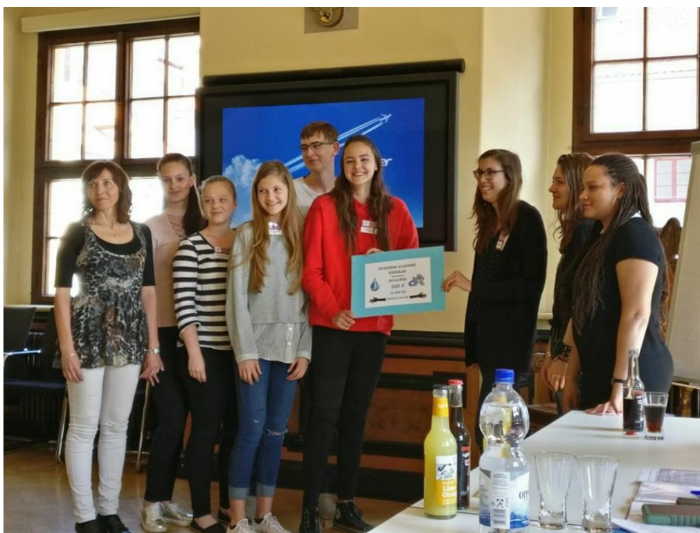
Setkání studentů ve Walbrzychu 2018

Tento projekt mezi partnerskými městy Příbram, Freiberg, Gentilly, Walbrzych a Delft se zaměřuje na spolupráci mladých lidí v oblasti sociální, kulturní a sportovní. Studenti z Česka, Polska, Německa, Francie a Holandska se pravidelně setkávají a pracují na konkrétních úkolech. Ve školním roce 2017/2018 proběhla dvě setkání, ve Freibergu a ve Walbrzychu. Současným tématem je solidární pomoc a vybudování vodní pumpy v africkém městě Duguwolowila v Mali. Projekt je finančně podpořen Městem Příbram.