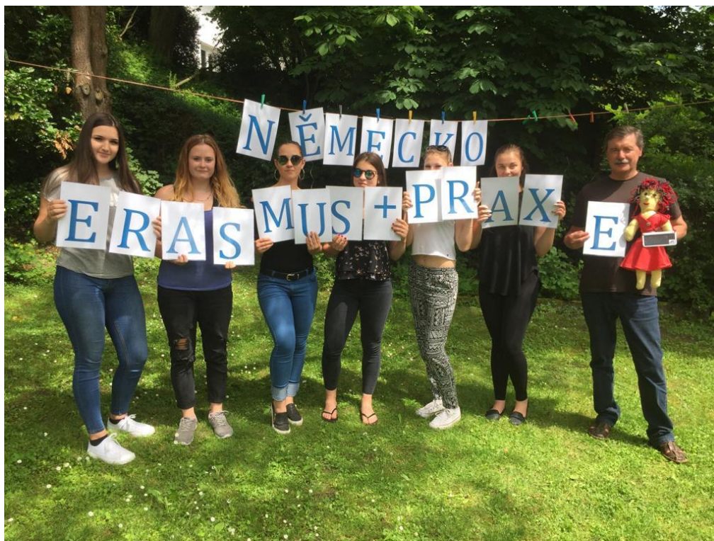
Praktikanti v Idar-Obersteinu 2018

Ve školním roce 2017/2018 jsme realizovali projekt Erasmus+ s názvem "Odborná praxe v Německu a Velké Británii". Díky němu se uskutečnily dva běhy stáží v Idaru-Oberstein (7 studentů říjen 2017, 6 studentů květen 2018), recipročně jsme v březnu 2018 hostili 7 německých studentů. K získání grantu velkou měrou přispěl i fakt, že jsme držitelé certifikátu kvality v odborném vzdělávání. Mezinárodní spolupráce se stala běžnou součástí výuky na naší škole a díky projektu „Učíme se praxí v Evropě“ bude v příštím školním roce probíhat čilá výměna praktikantů.