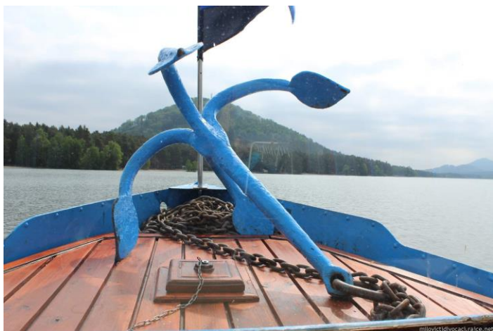
Dagmar Sofie Molinová

Učili jsme se upravovat fotografie a máme své webovky i http://milovictidivocaci.rajce.idnes.cz/ . Vystavovali jsme fotografie spolu s výtvarnými pracemi žáků 12. 4. 2018 během Fotománie v Městské knihovně v Milovicích i v rámci Dne otevřených dveří ZŠ TGM Milovice. Od 9. do 11. 5. se část Milovických divočáků zúčastnila matematického soustředění 5. C u Máchova jezera, kde v jednom ze tří dnů proběhla i exkurze do Muzea Čtyřlístek. Výletem do ZOO 1. 6. 2018 pro letošní školní rok aktivity kroužků skončily.