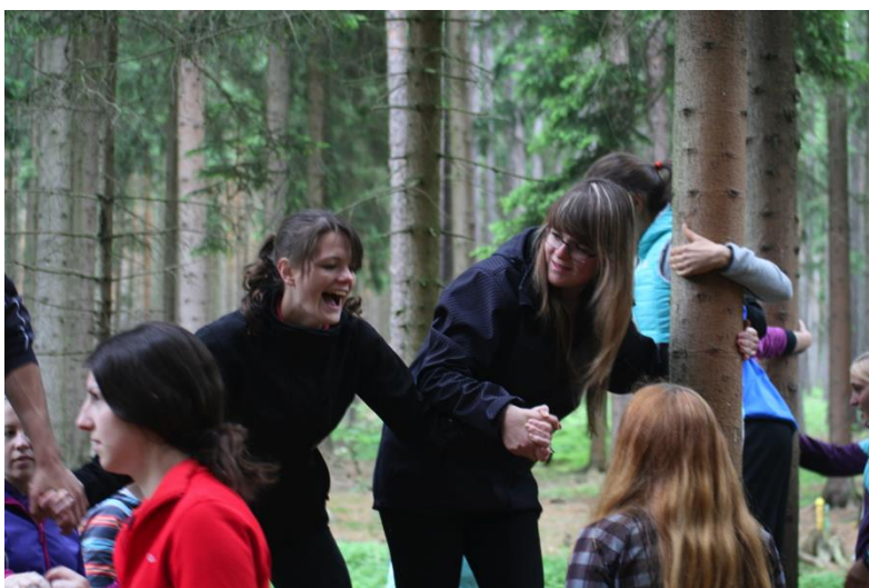
Sportovní a turistický kurz třetích ročníků a septimy.