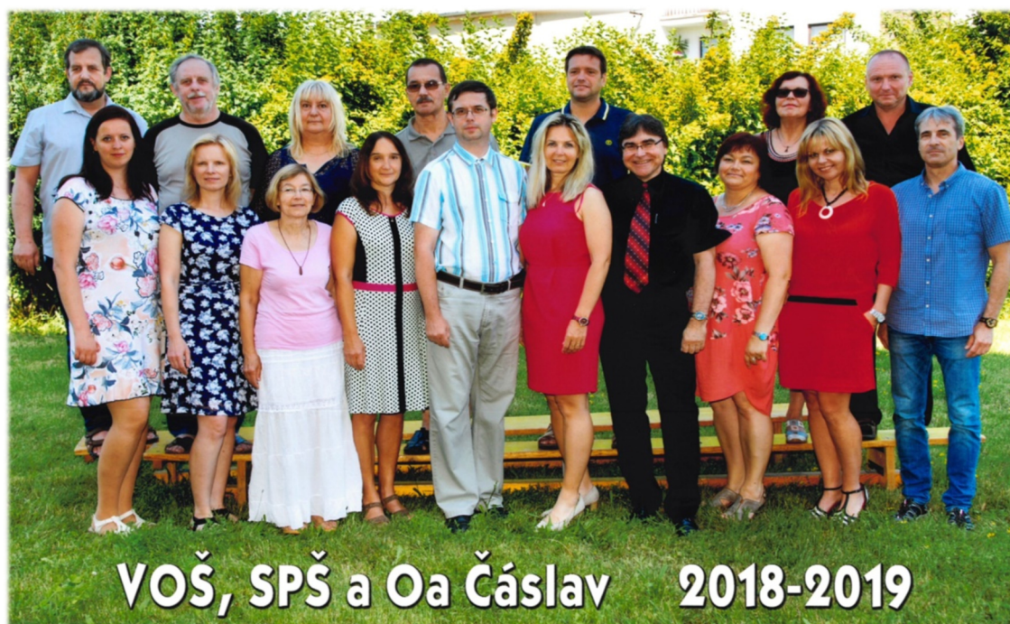
Foto pedagogického sboru ve školním roce 2018/2019

Všechny personální změny byly projednány s Odborovou organizací.