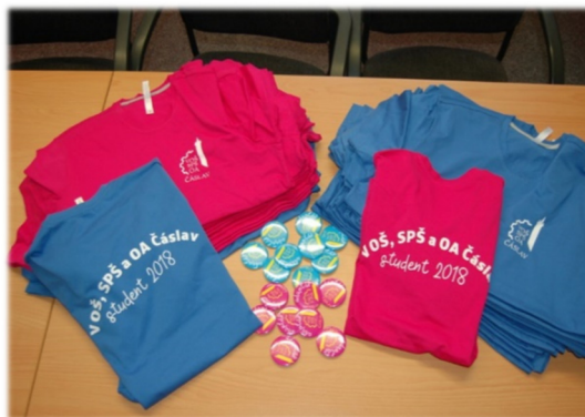
Adaptační kurz S1 a OA1