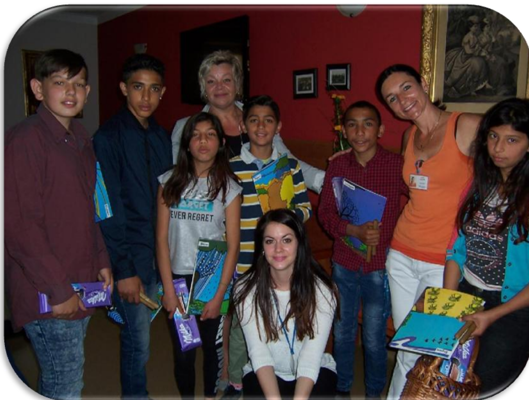
Vystoupení pro seniory