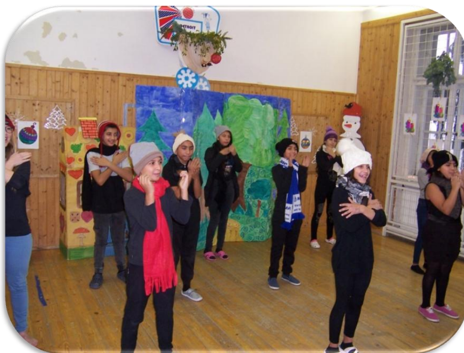
Vystoupení pro rodiče