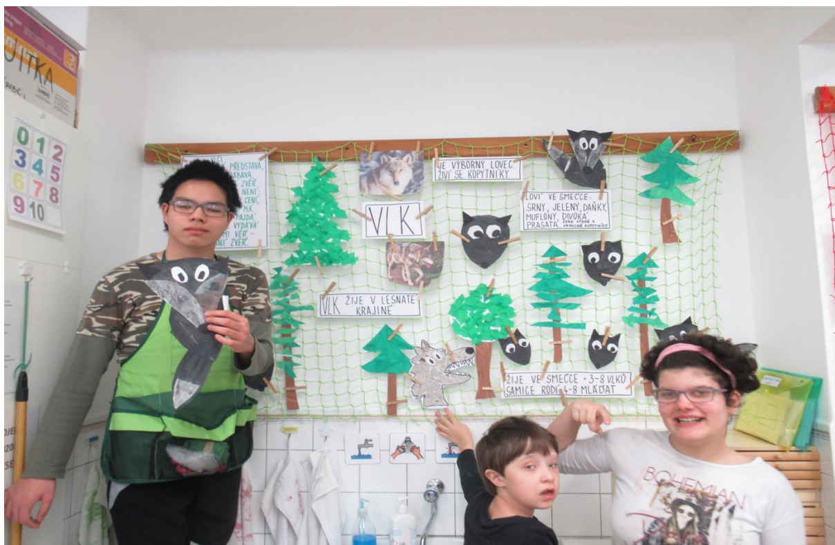
Rok v lese