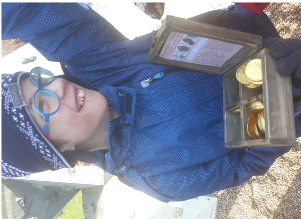
Pěší výlet a čokoládový poklad