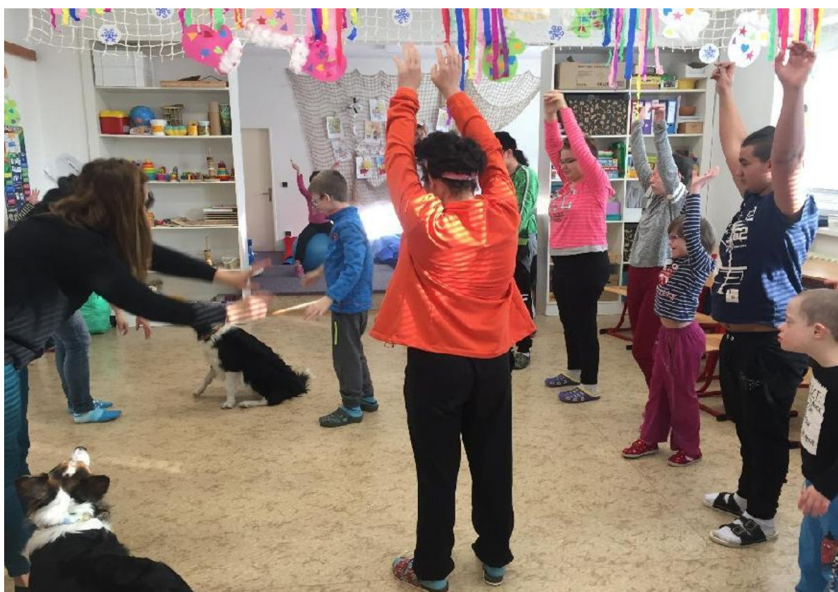
Canisterapie: Tam, kde zvířata pomáhají