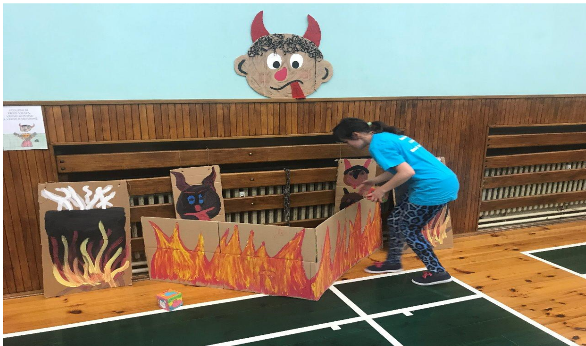
Hýbeme se spolu