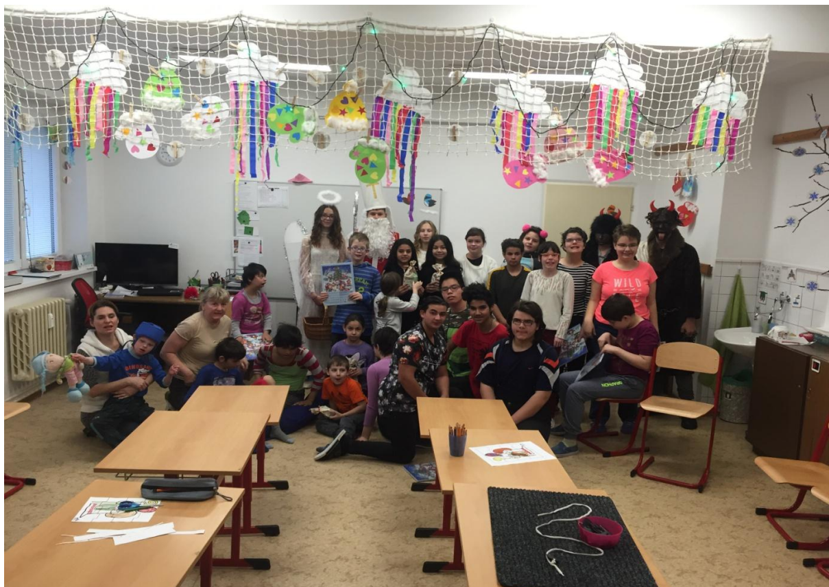
Čertovská návštěva žáků ZŠ Pražská