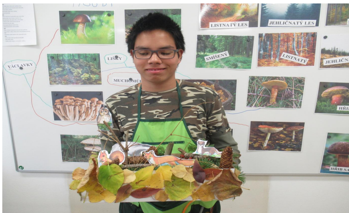
Rok v lese