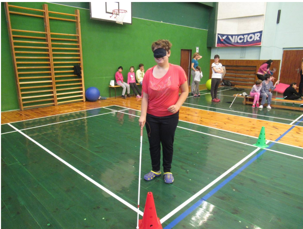
SONS: chůze „jako nevidomí“