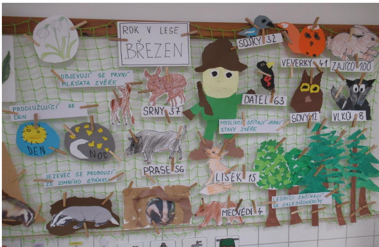
Rok v lese