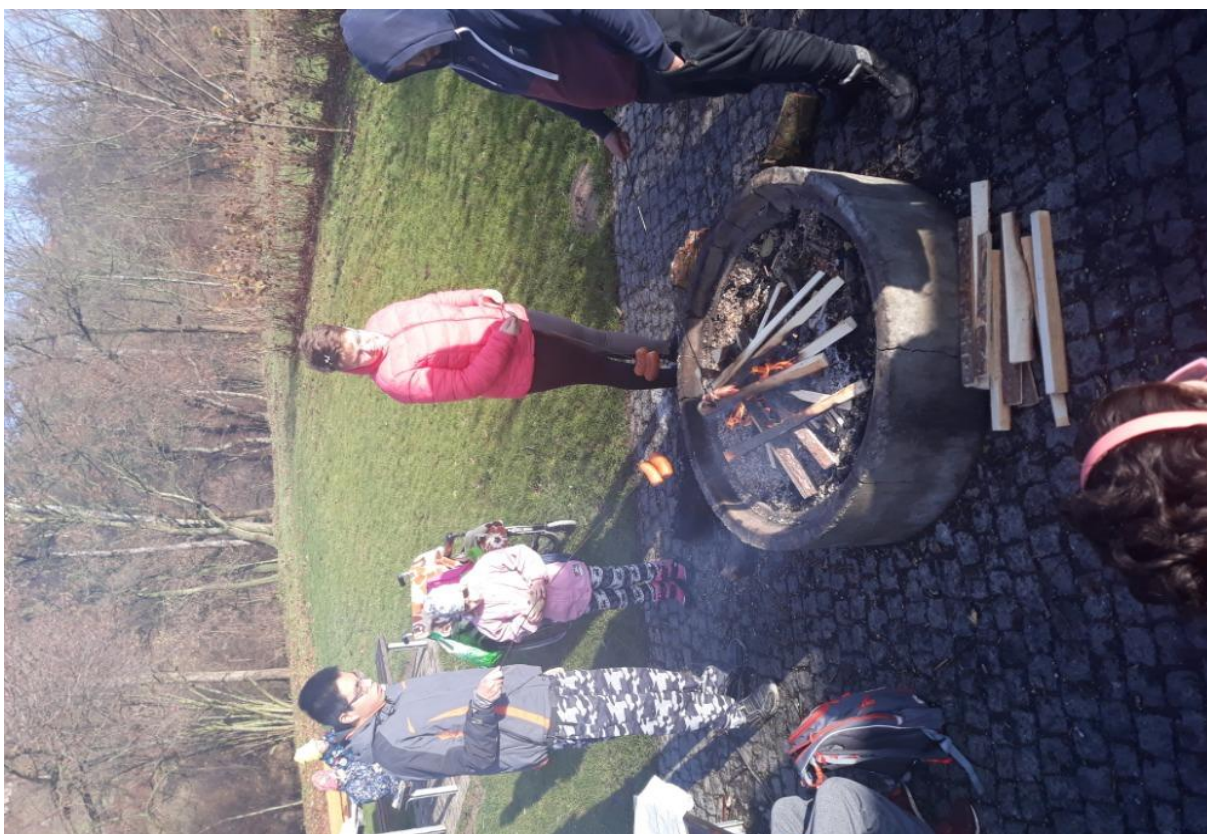
Pěší výlet – opékání vuřtů