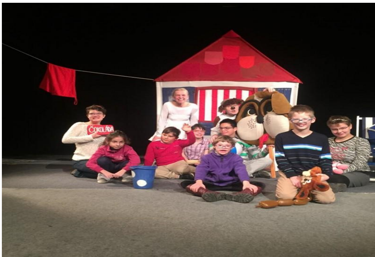
Divadelní představení O pejskovi a kočičce