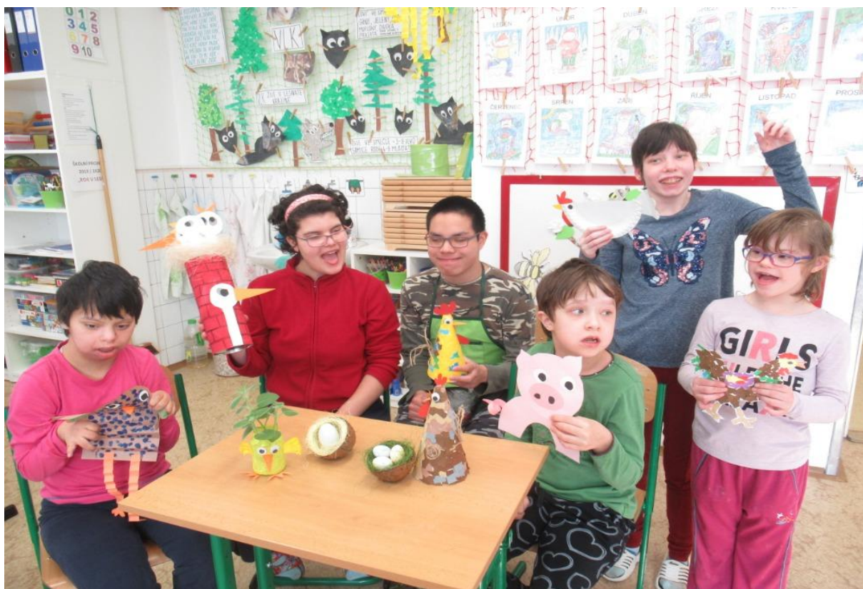
Velikonoční tvoření – máme radost z výrobků