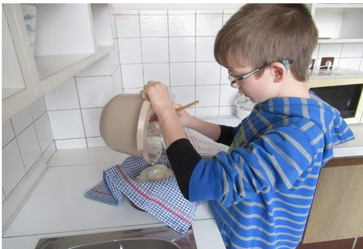
Podoby mléka - výroba domácí lučiny