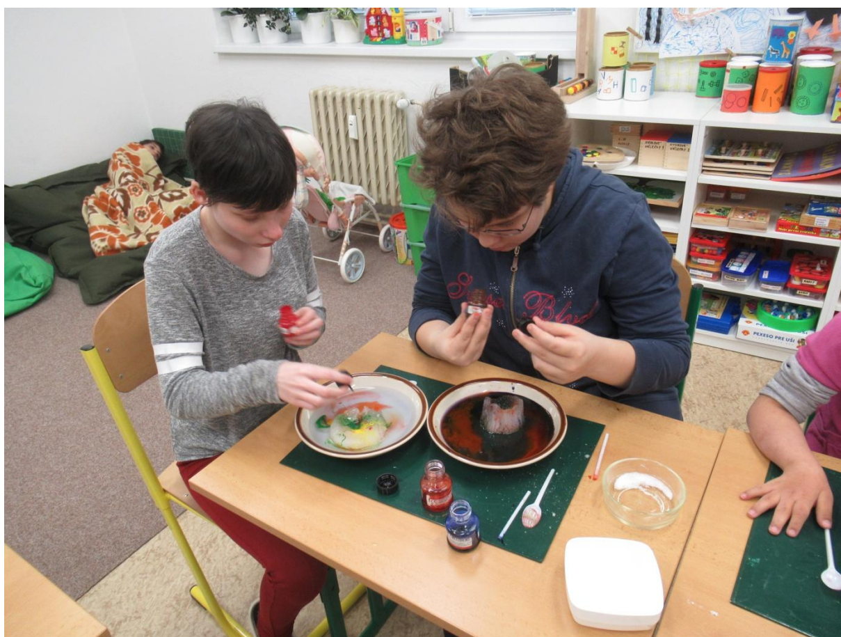
Pokusy s ledem a vodou