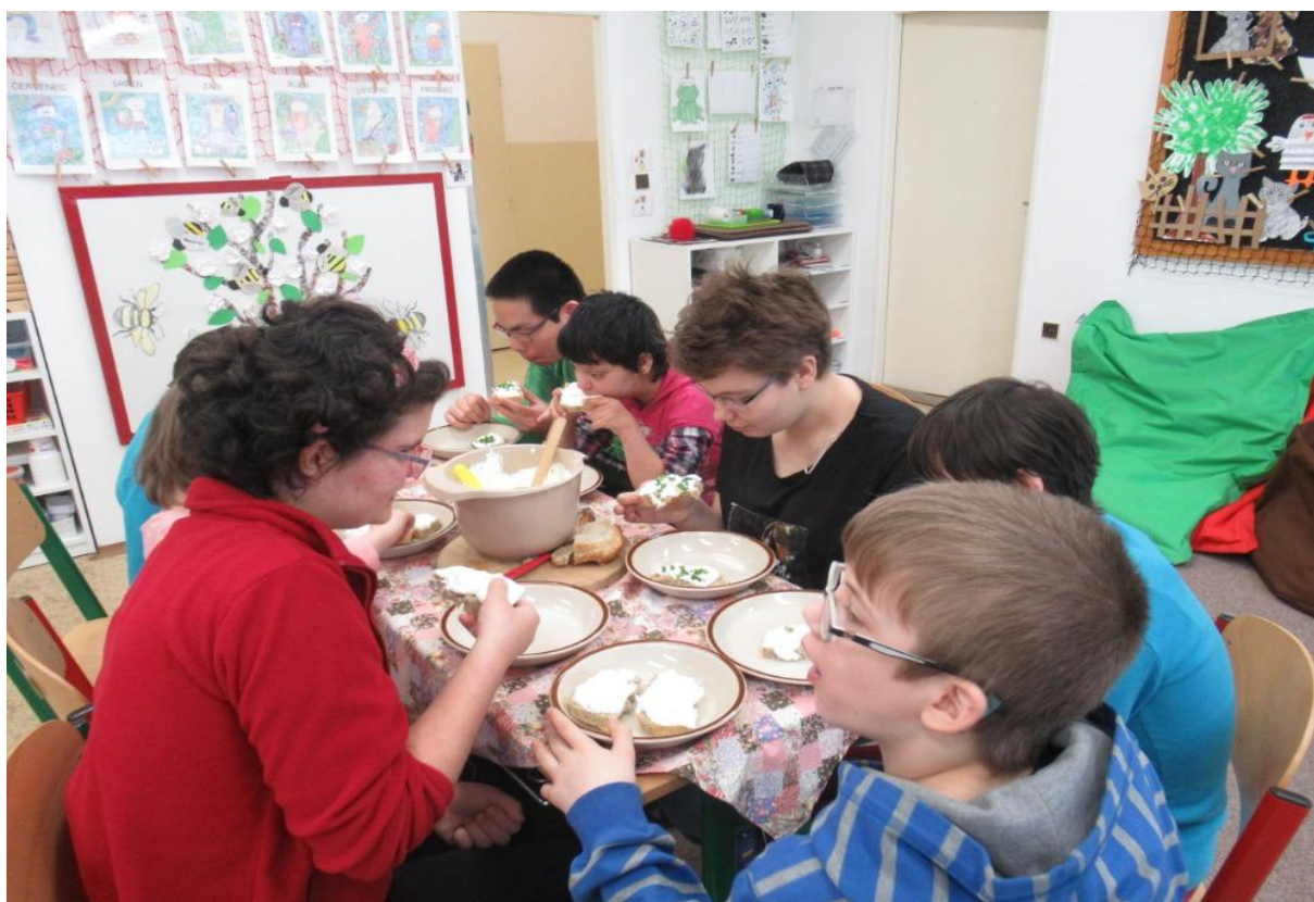
A malá ochutnávk