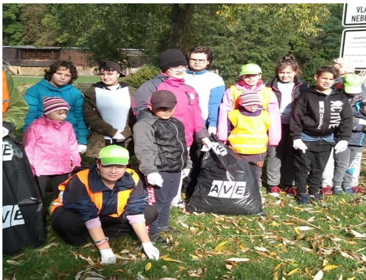
Čistá řeka Jizera