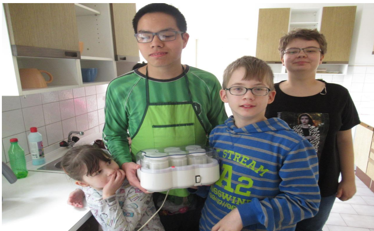
Vyrábíme jogurt v jogurtovači