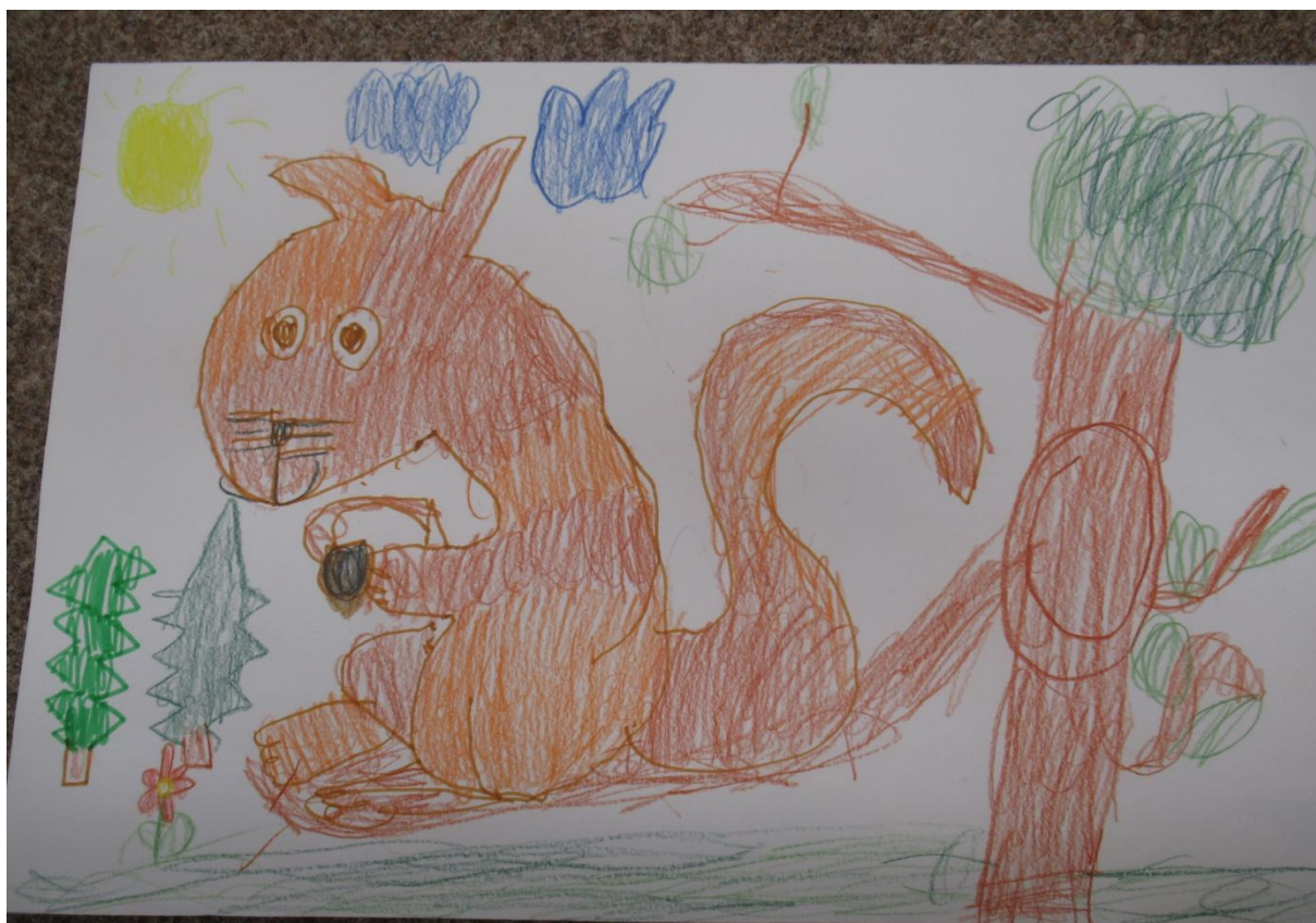
Výtvarná přehlídka „Radost“ Kolín. Autor obrázku: O. Mihalík – ZŠS