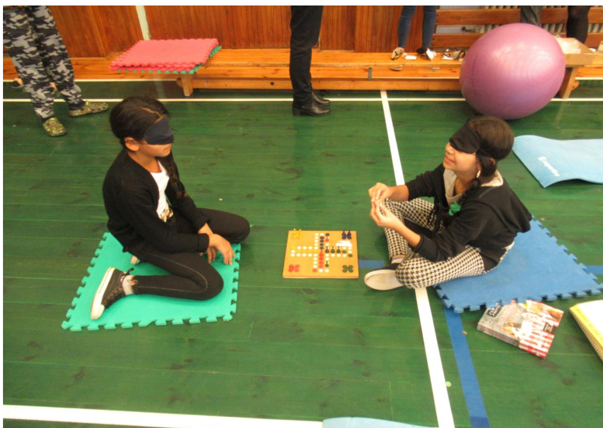
SONS: hrajeme společenské hry „jako nevidomí“