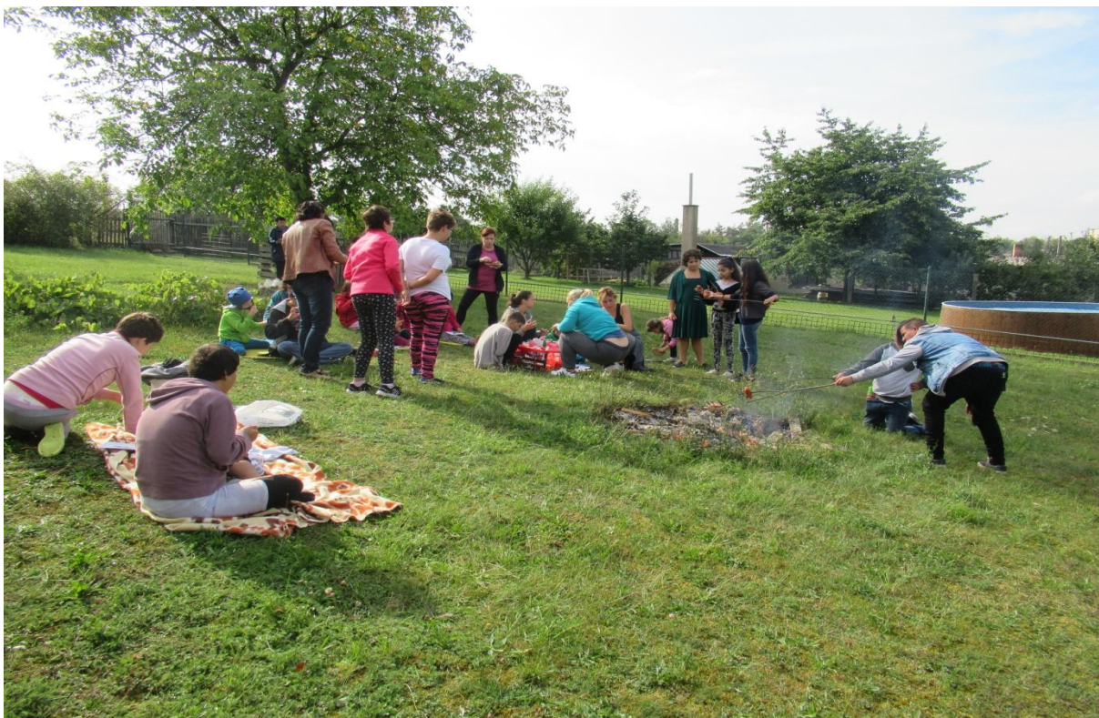
Opékání vuřtů a hry na zahradě