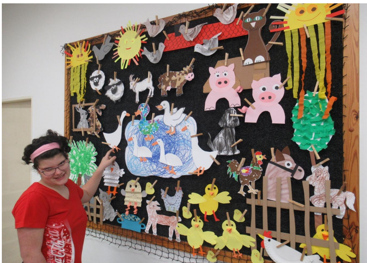
Poznáváme hospodářská zvířata