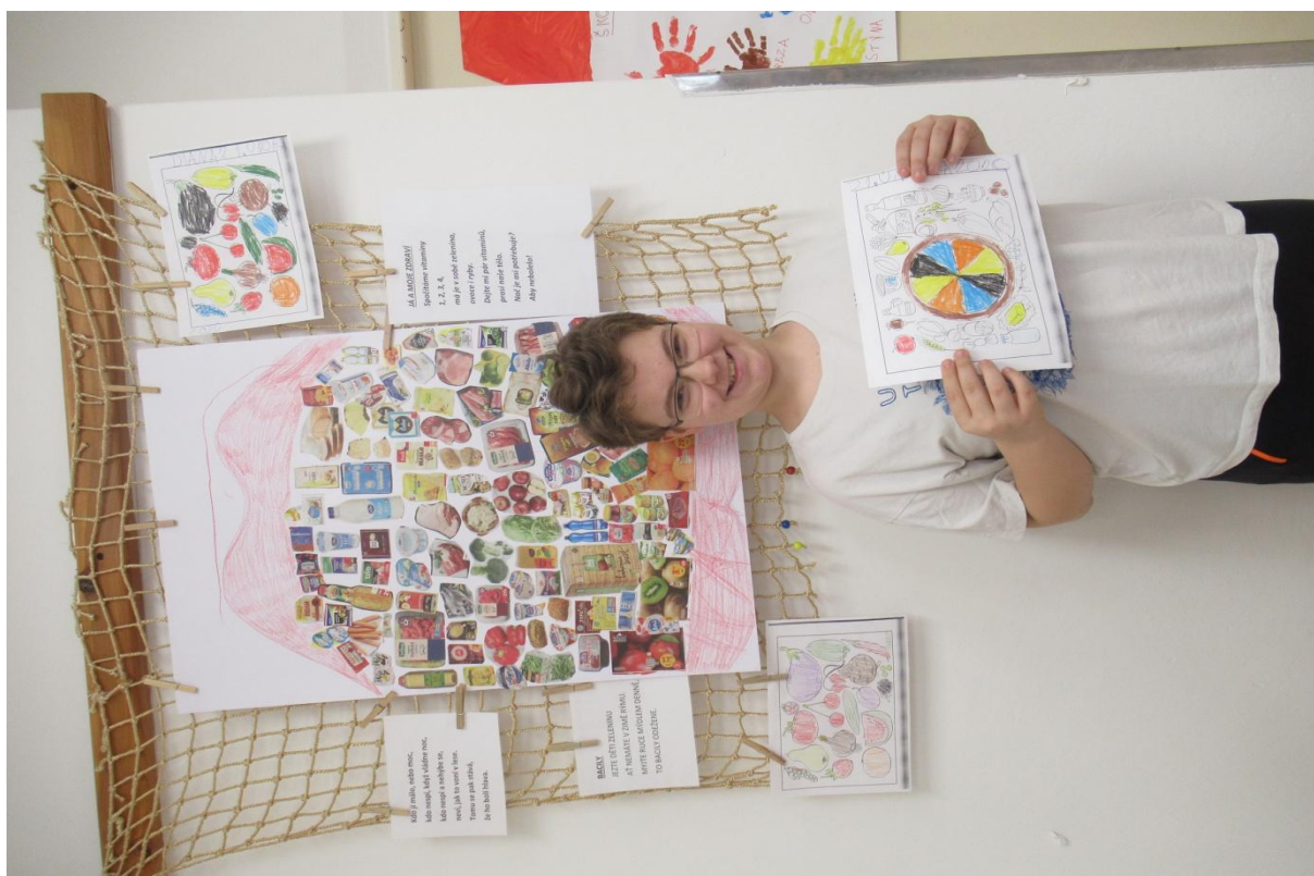
Já a moje zdraví

Těšili jsme se do Kolína na zimní Hry pro radost. Bohužel, jsme nemocní nebo nachlazení, takže nikam nejedeme.