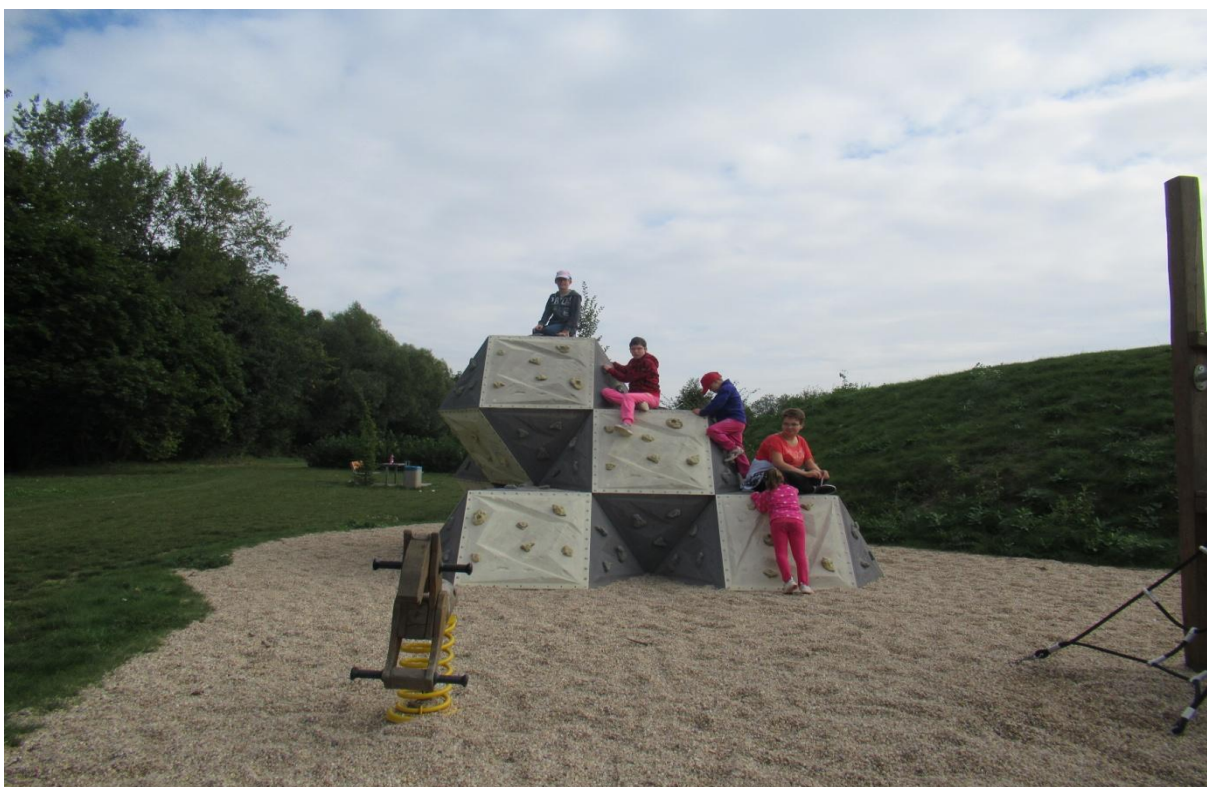
Pěší výlet zakončený na „Urbanovce“