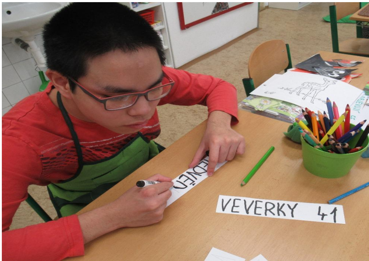
Rok v lese