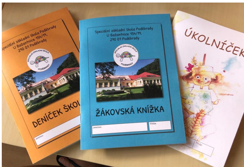
Máme vlastní žákovské knížky, deníčky a úkolníčky.

V letošním školním roce jsme si nechali vytisknout vlastní ŽK, s logem školy a prostorem pro sebehodnocení žáků.