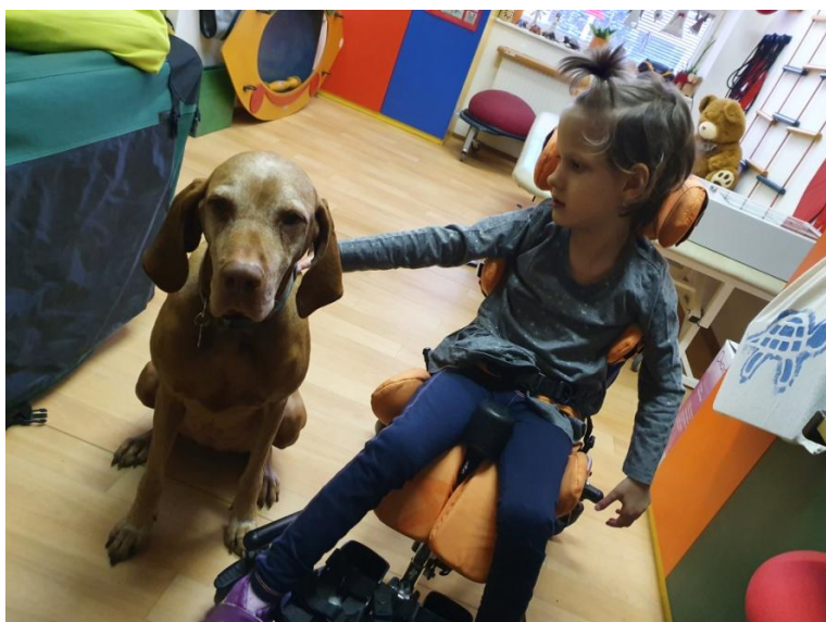
Využití stropního zvedacího systému ROOMER

V rámci individuální péče aktivizujeme, stabilizujeme, relaxujeme, cvičíme proti odporu či se zátěží, pasivně protahujeme, ovlivňujeme kloubní pohyblivost a hluboký stabilizační systém, zapojujeme jemnou a hrubou motoriku, stimulujeme zrak, hmat, sluch, čich a chuť, cvičíme koordinaci, stabilitu, orientaci v prostoru, polohujeme a využíváme dechovou gymnastiku.