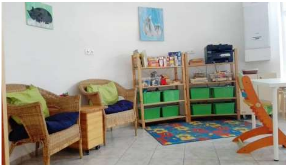
Naše druhé pracoviště 2016 – 2019 v ulici Karla Čapka

přírůstek 126 klientů v roce 2020 – přírůstek 128 klientů a v roce 2021 do SPC bylo nově přijato 130 klientů. Přírůstek je plynulý, přestože byla náročná situace v souvislosti s Covid 19.