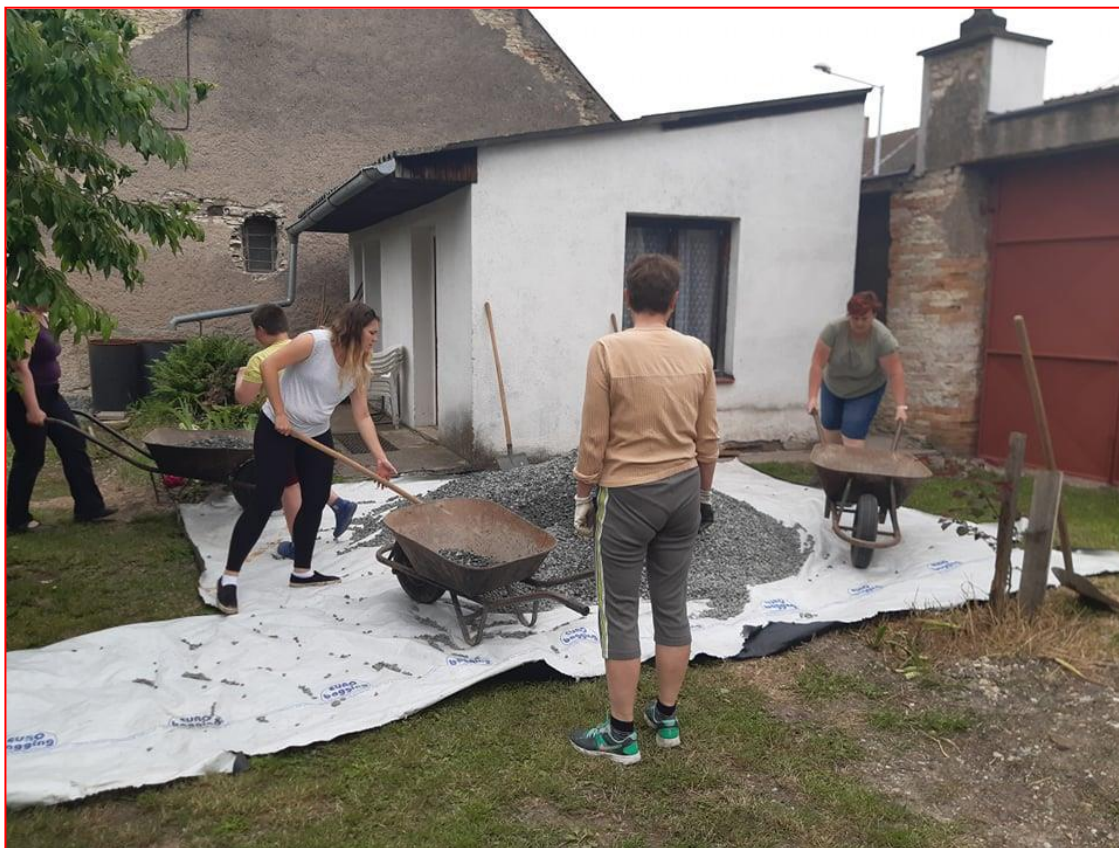
Paní učitelky a asistentky pracují na školním pozemku

Z těchto důvodů si nechala škola vypracovat projekt na obnovu školního pozemku.