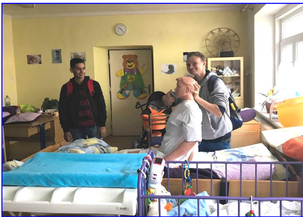
Foto z exkurze v Hořicích