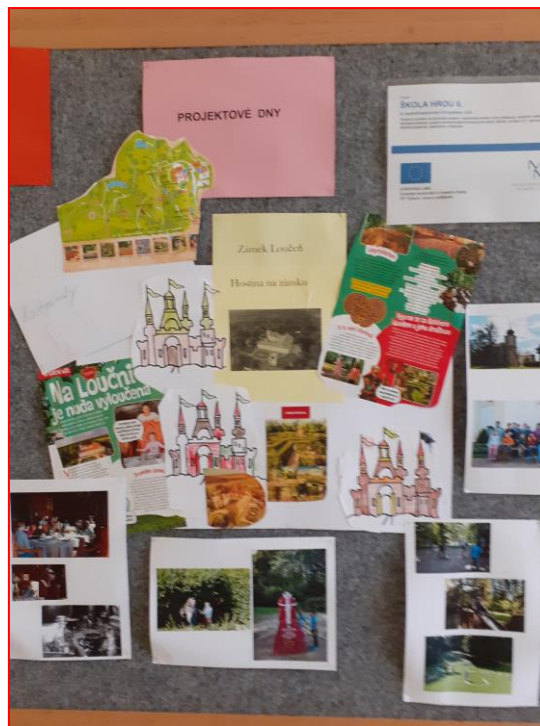
Foto nástěnky k projektu Škola hrou II