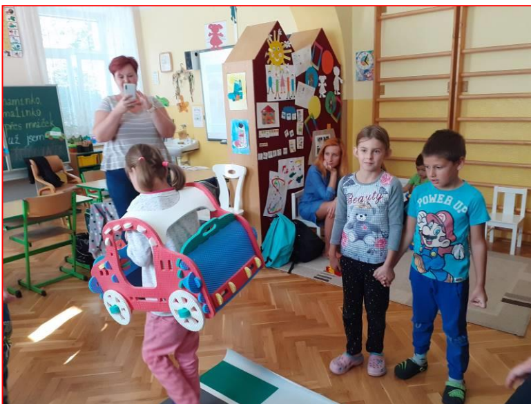
Pomoc asistentů pedagoga ve výuce