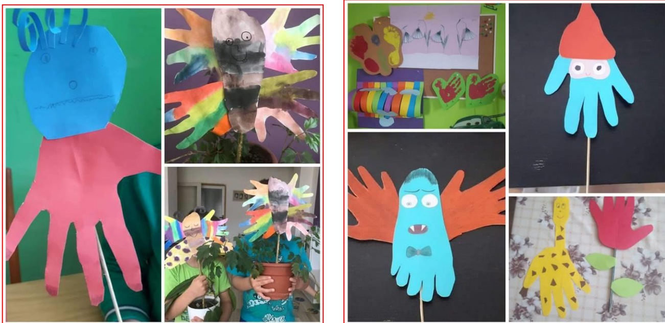
Domácí výtvarné práce dětí z přípravného stupně ZŠS