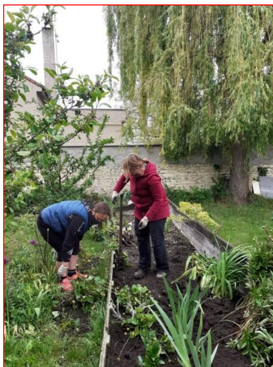
Obnova školního pozemku