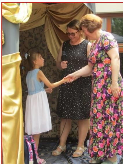
Barunku přišly podpořit paní učitelky ze základní školy