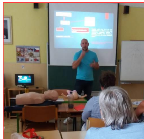
Pedagogičtí pracovníci při školení o poskytování první pomoci