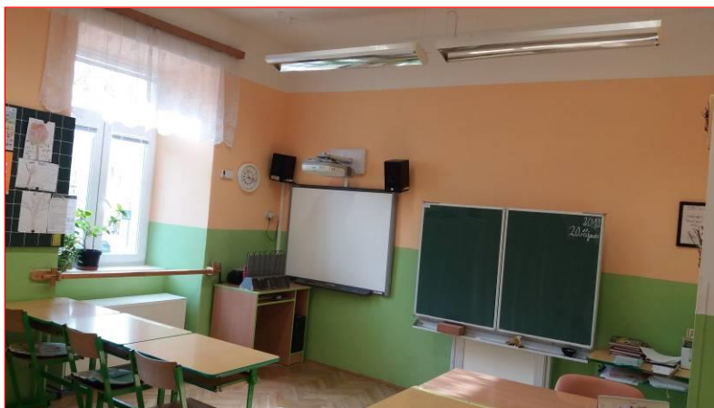
IV. třída – zrekonstruováno, vymalováno, renovované parkety

Celkově lze konstatovat, že spolupráce s Městem Městec Králové je na nadstandardní úrovni, vstřícná a přínosná. Zajištění bezpečného pracovního prostředí přineslo klid do práce a zpříjemnilo pobyt pedagogům i žákům ve škole.