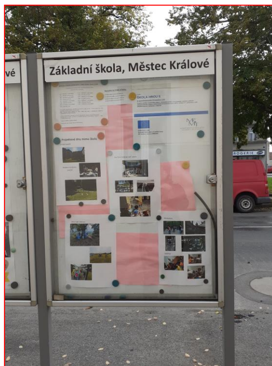
Informační panel školy před budovou školy