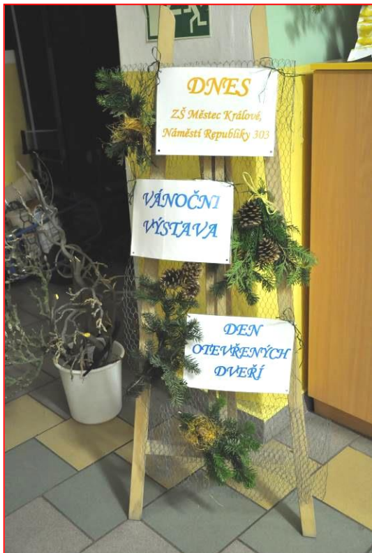
Poutač ke Dni otevřených dveří