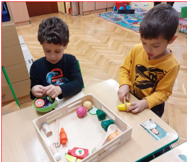
Děti z PS ZŠS s novými kompenzačními pomůckami