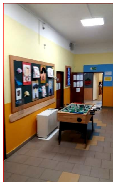
Chodba I. patro – vymalováno, zrekonstruováno