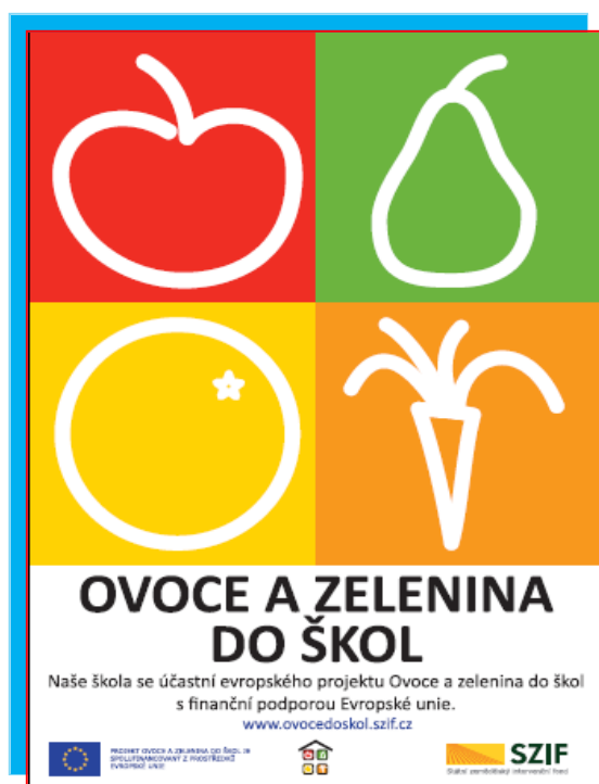
obr. č. 1