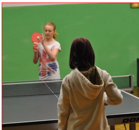
Okresní turnaj ve stolním tenisu