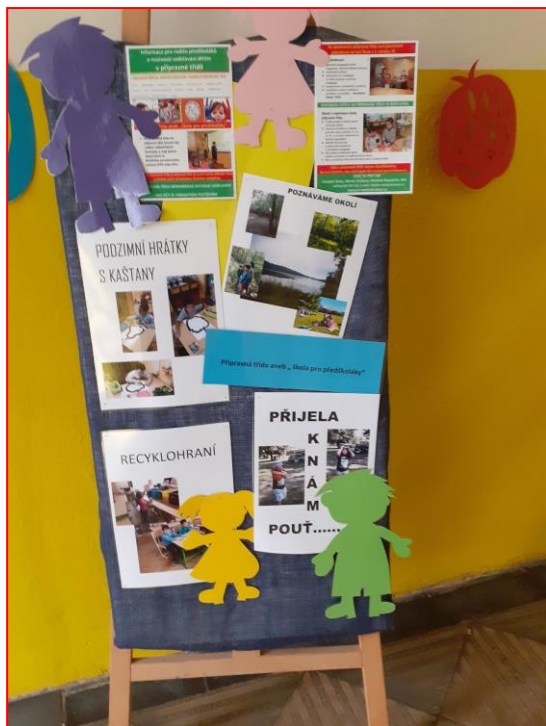
Foto informačního stojanu vystaveného v prostorách MěÚ

Městský úřad Městec Králové umožnil naší škole vystavovat ve svých prostorech informační stojany s výtvarnými pracemi našich žáků, fotografiemi z akcí naší školy a propagačními materiály o uplatnění našich žáků na trhu práce.