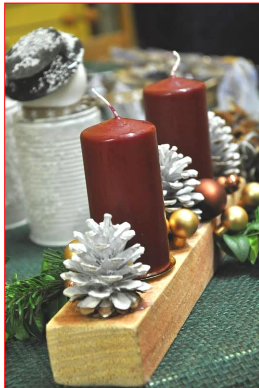
Foto z vánoční výstavky