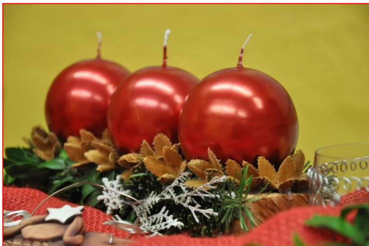
Fota z vánoční výstavy