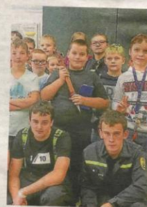
SPRÁVNÉ chování představili budoucí hasiči.

Hasiči učili žáky, jak správně komunikovat s operátorem při ohlašování mimořádné situace, jak poskytnout první pomoc a také jak si zabalit