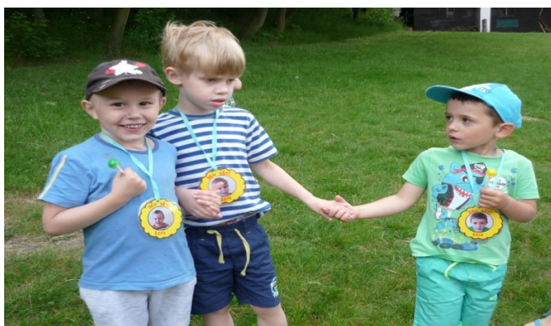
Oslava Dne dětí