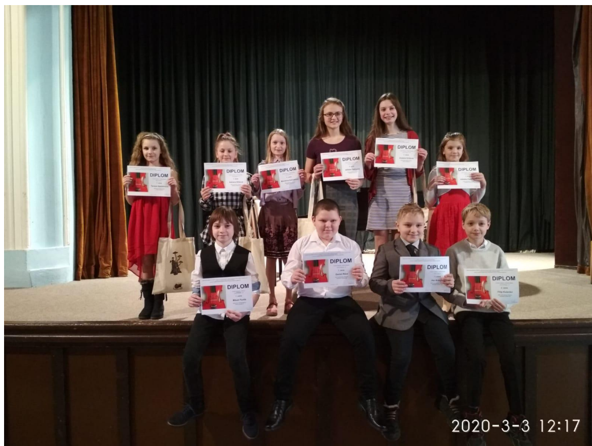
Okresní kolo ve hře na smyčcové nástroje, Sál radnice v Hořovicích

Naše škola byla pořadatelem okresního kola ve hře na smyčcové nástroje , do kterého se zapojila většina našich žáků na housle. Vzhledem k uzavření škol k 16. 3. 2020 z důvodu koronavirové epidemie byly všechny další plánovaná kola do konce školního roku zrušena.