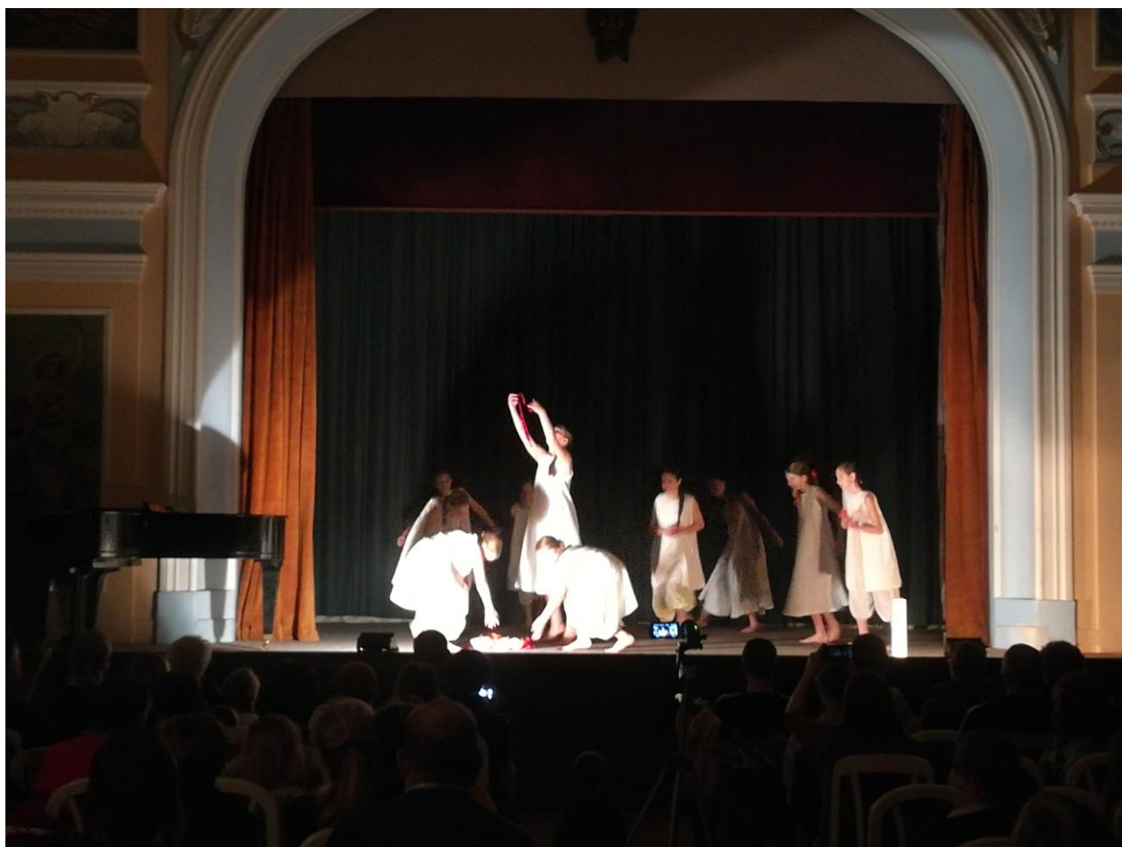
Putování Adventem 2019, (Taneční obor pí uč. V. Dědové)

Počet žáků, kteří úspěšně složili přijímací zkoušku do ZUŠ, byl podstatně vyšší. To odpovídá stále vysokému zájmu o studium v naší škole. Vzhledem k celkové kapacitě, jsme přijali do celkové kapacity školy 49 nových žáků.