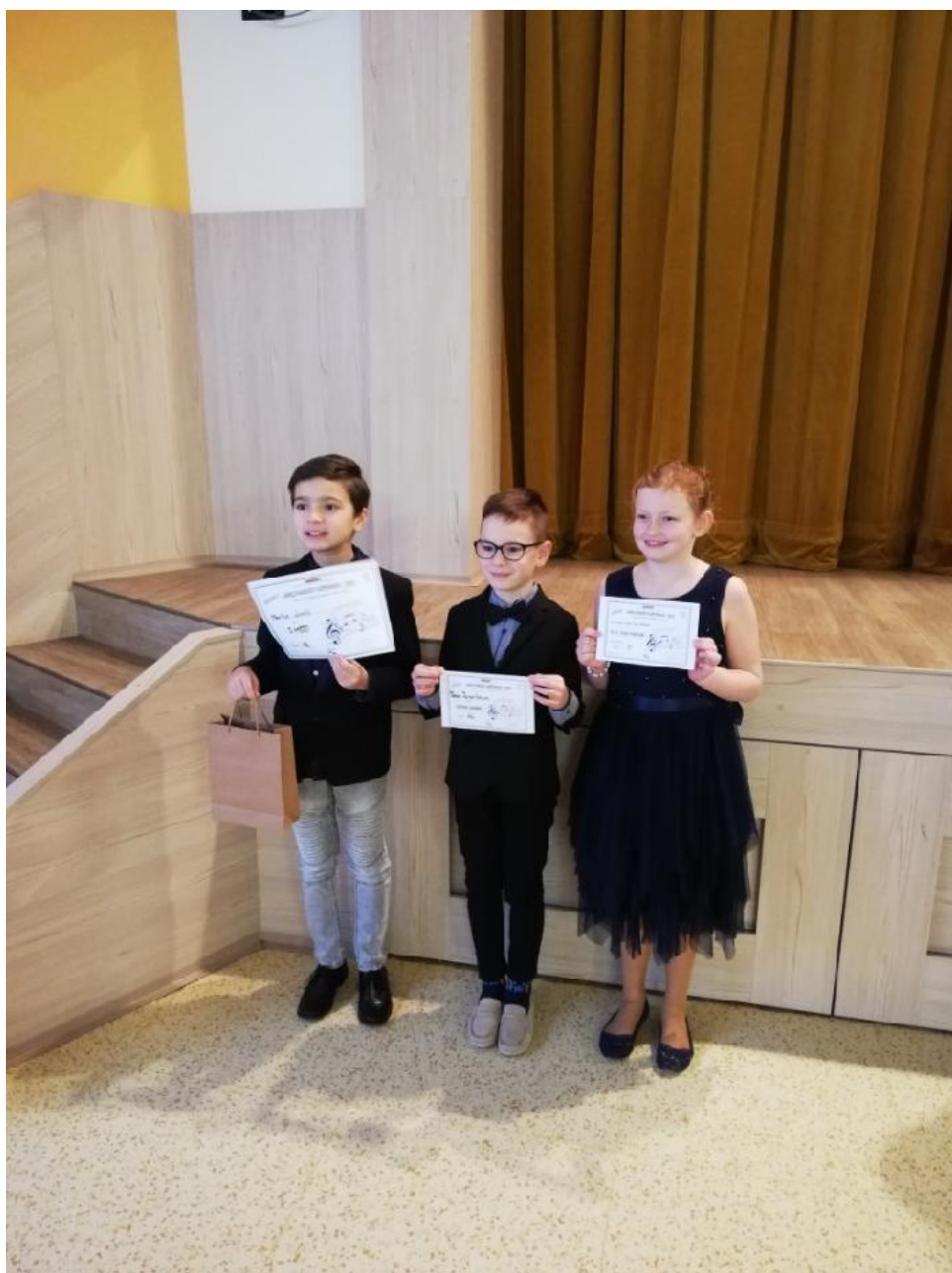
Karlovarský skřivánek, Krajské kolo

Kromě slabých stránek byly vyzdvihnuty také silné stránky školy a dále byly stanoveny doporučení pro zlepšení činnosti školy.