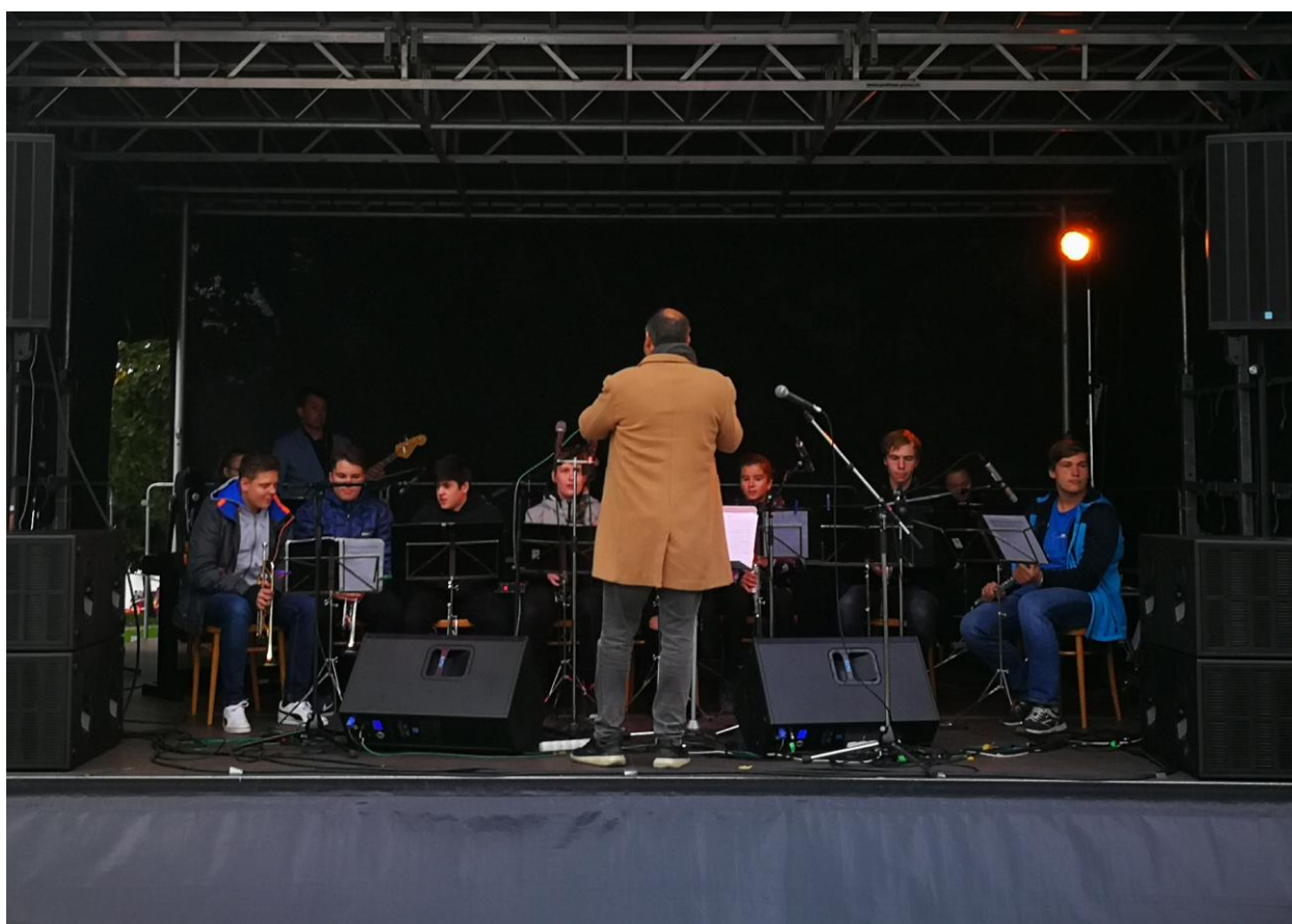
HORband na Cibulovém jarmarku, 2019