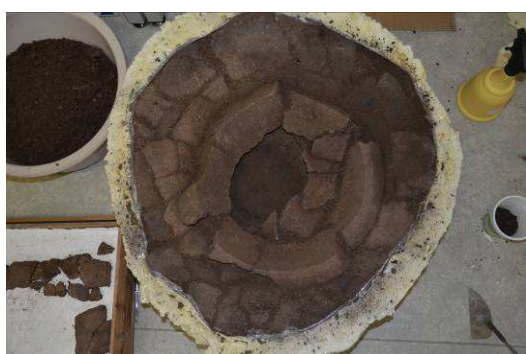
Obj. 19 - hrob, ZAV Holubice