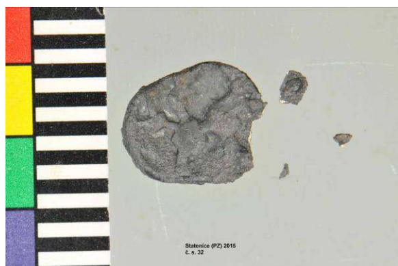
Archeologická mince - stav před restaurováním