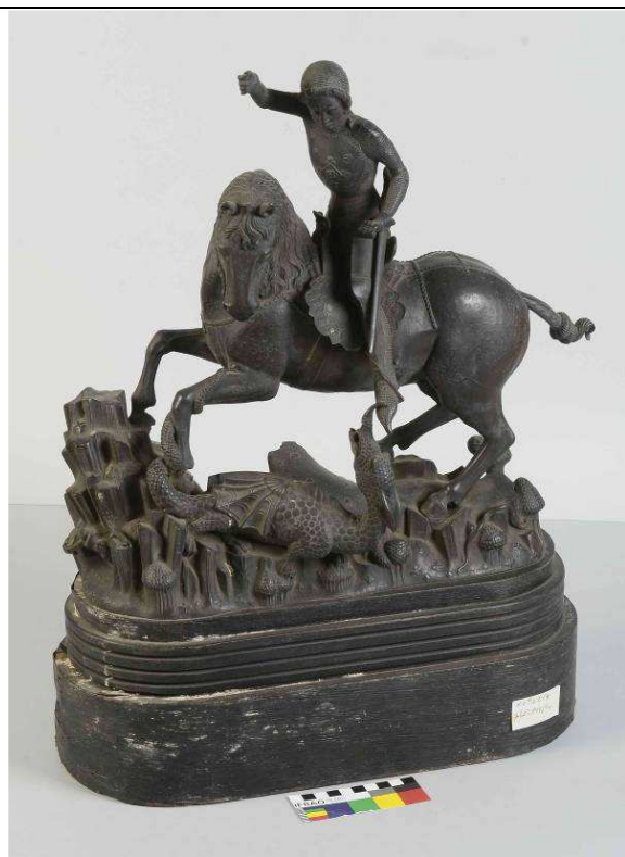
Sv. Jiří – stav před restaurováním