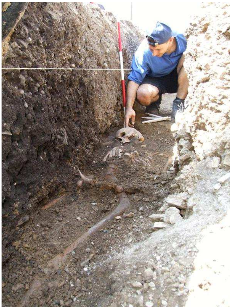
Roztoky – Žalov, hroby, pravděpodobně vrcholný středověk