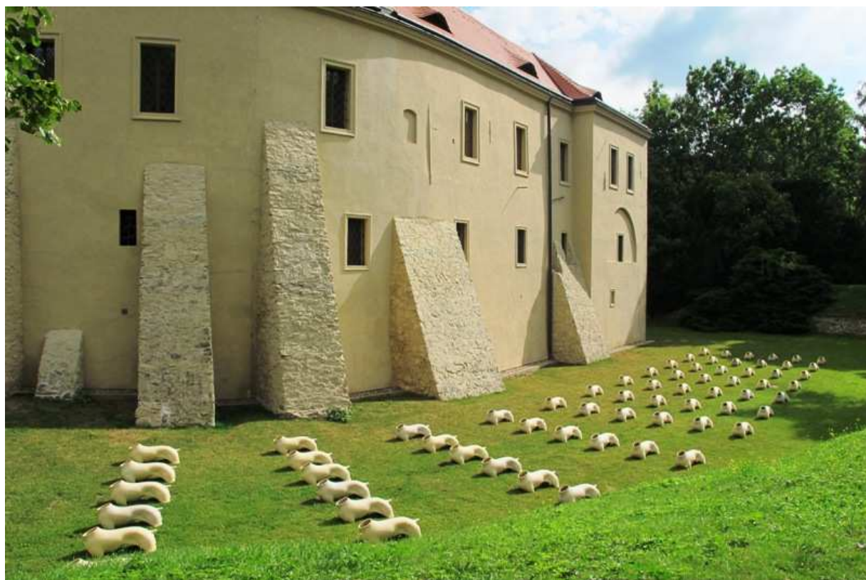
Letní keramická plastika