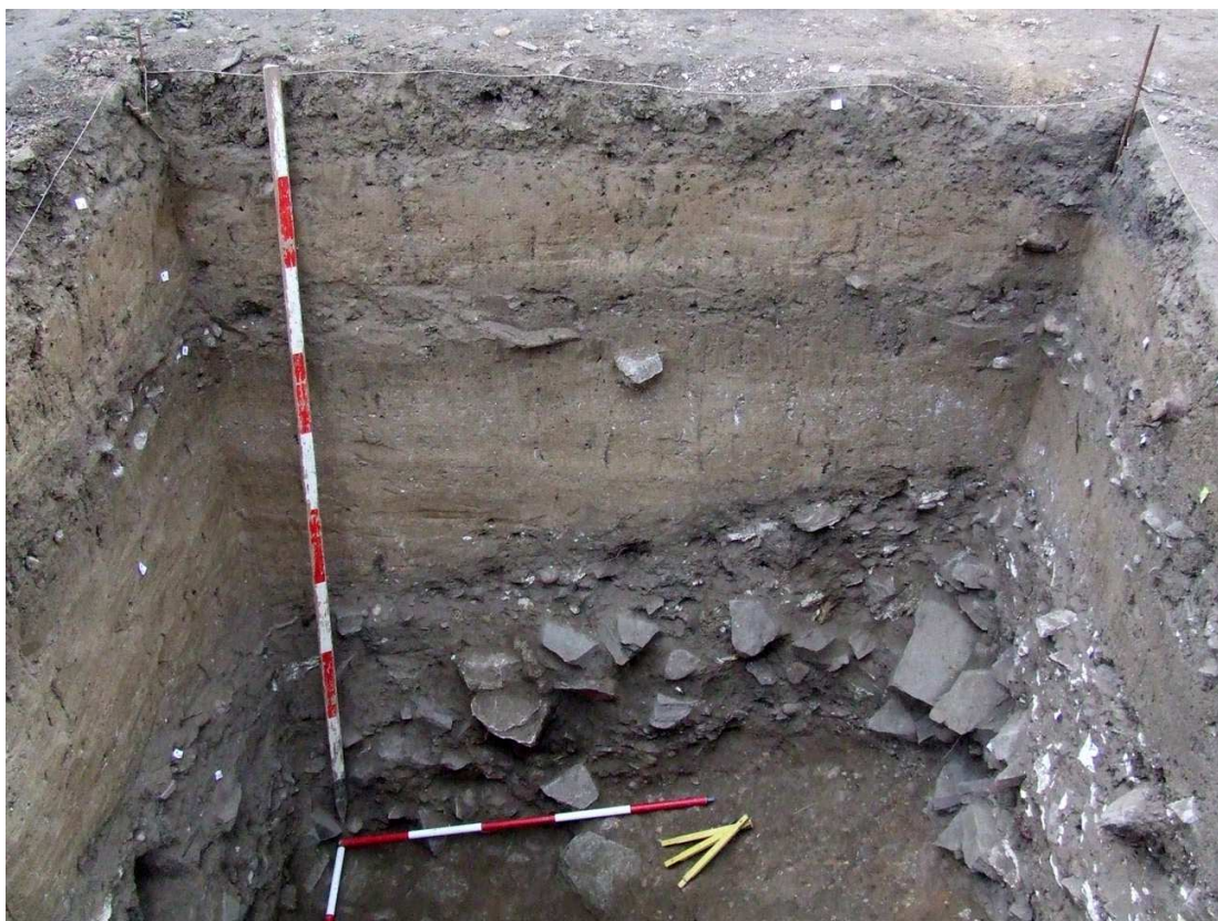
Profil sondy odhalující raně středověké úpravy terénu v sousedství vstupu do druhého předhradí hradiště Levý Hradec