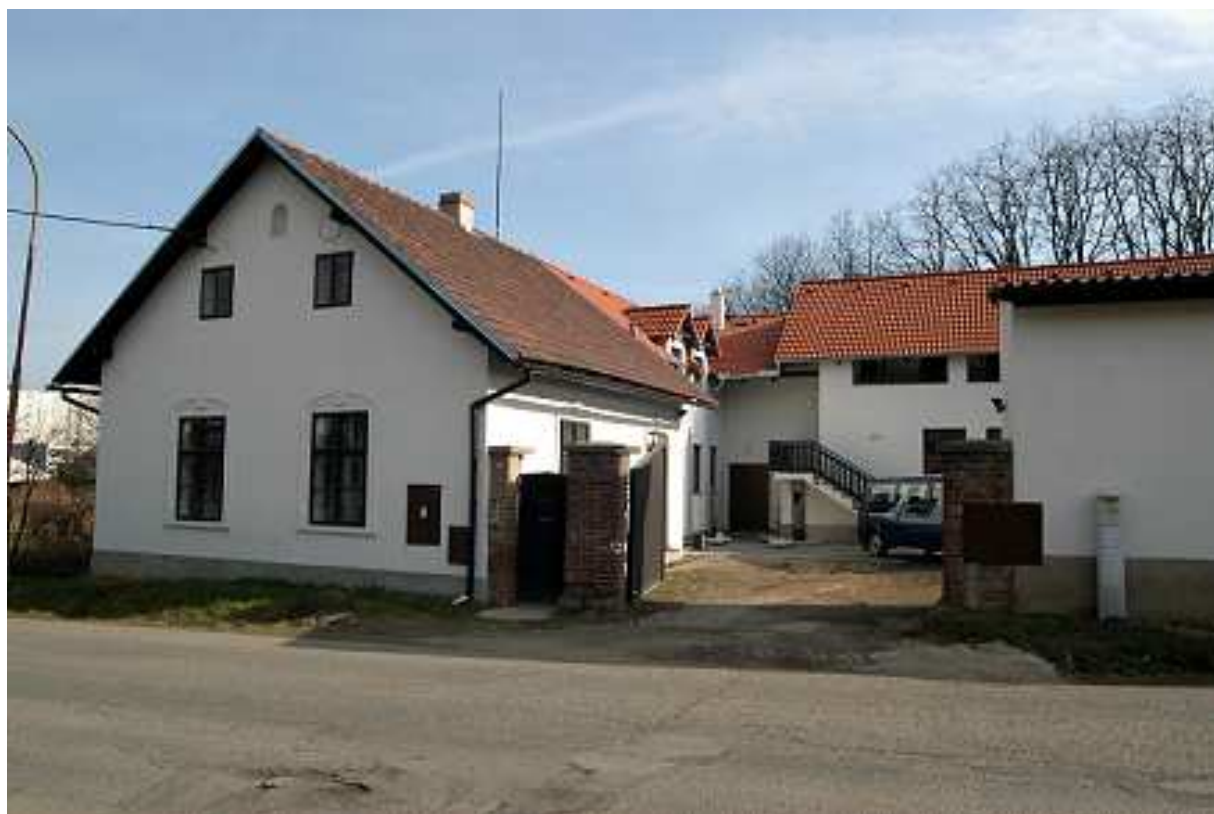
Areál statku v Libčicích nad Vltavou