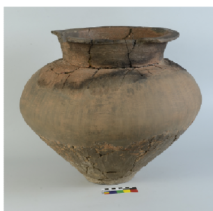
Obj. 19-hrob, ZAV Holubice