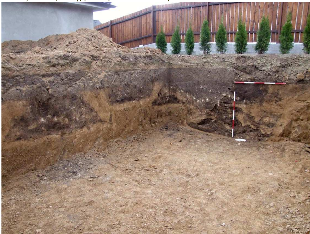
Holubice – objekty z pozdní doby kamenné a starší doby bronzové