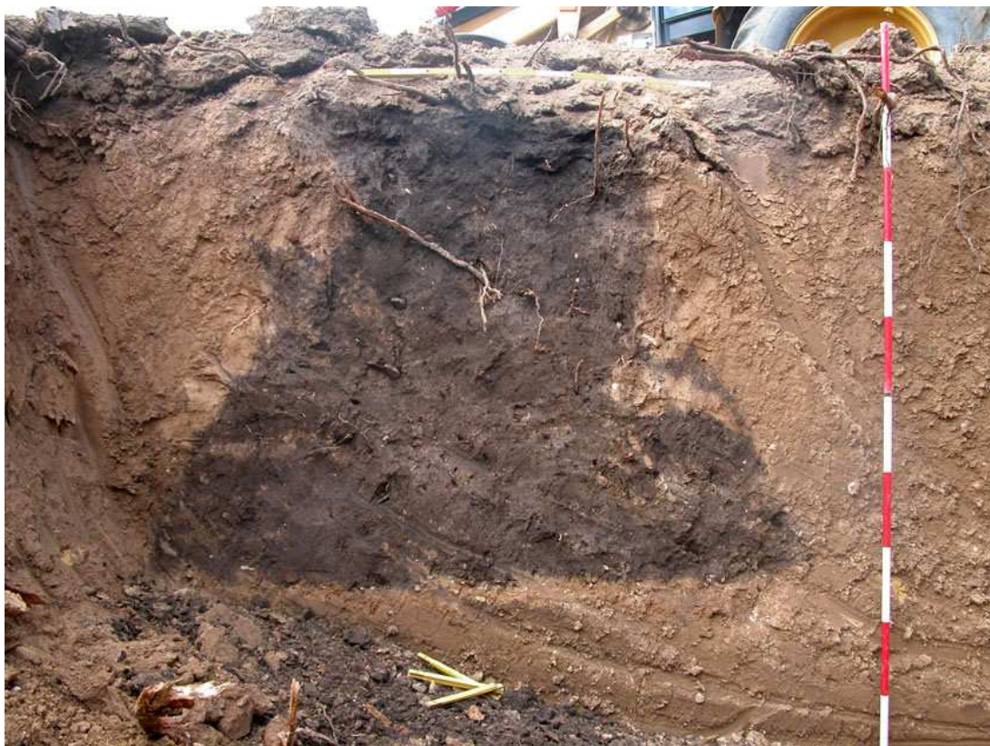
Litovice – zásobní jáma kultury nálevkovitých pohárů