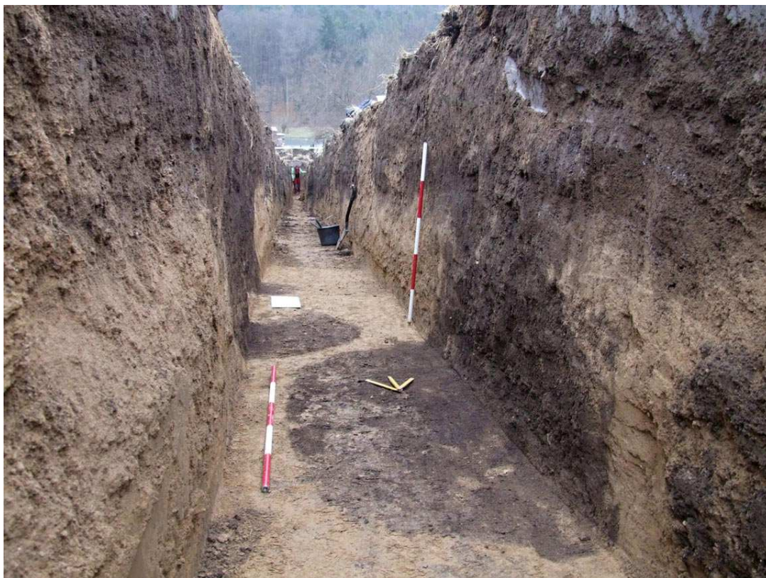
Statenice – blíže nedatovatelné pravěké objekty a objekty z doby halštatské a laténské