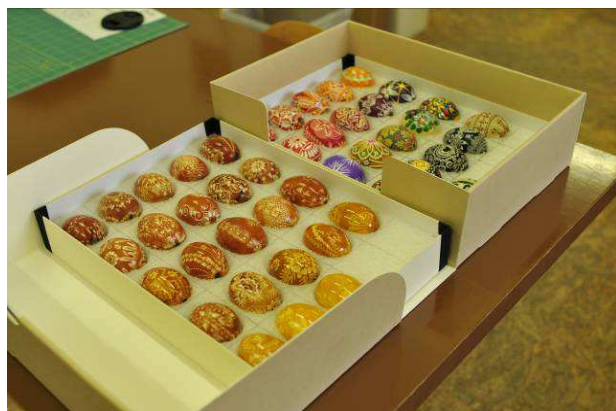
Příklad uložení sbírkových předmětů