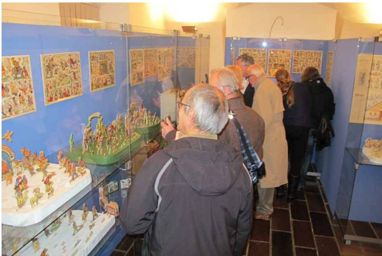
Betlémy, tentokrát tištěné