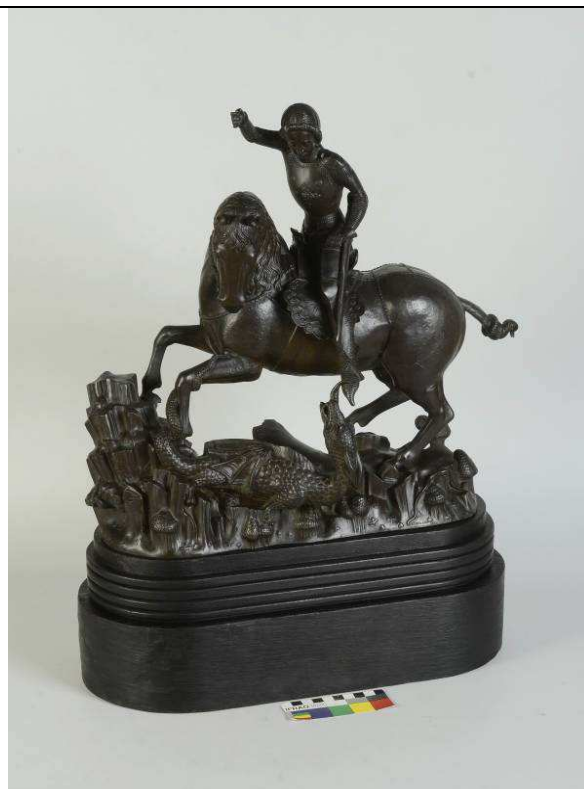
Stav po restaurování