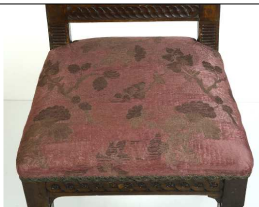
Stav po restaurování