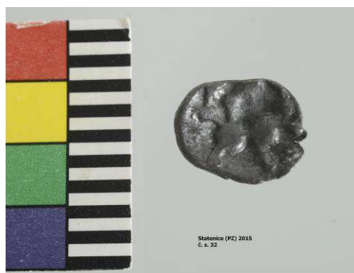
Stav po restaurování