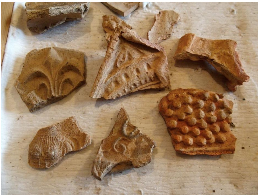
Fragmenty kamnových kachlů ze 16. století nalezené v odpadní jámě, Holubice, jádro obce Rekonstrukce vedení kNN