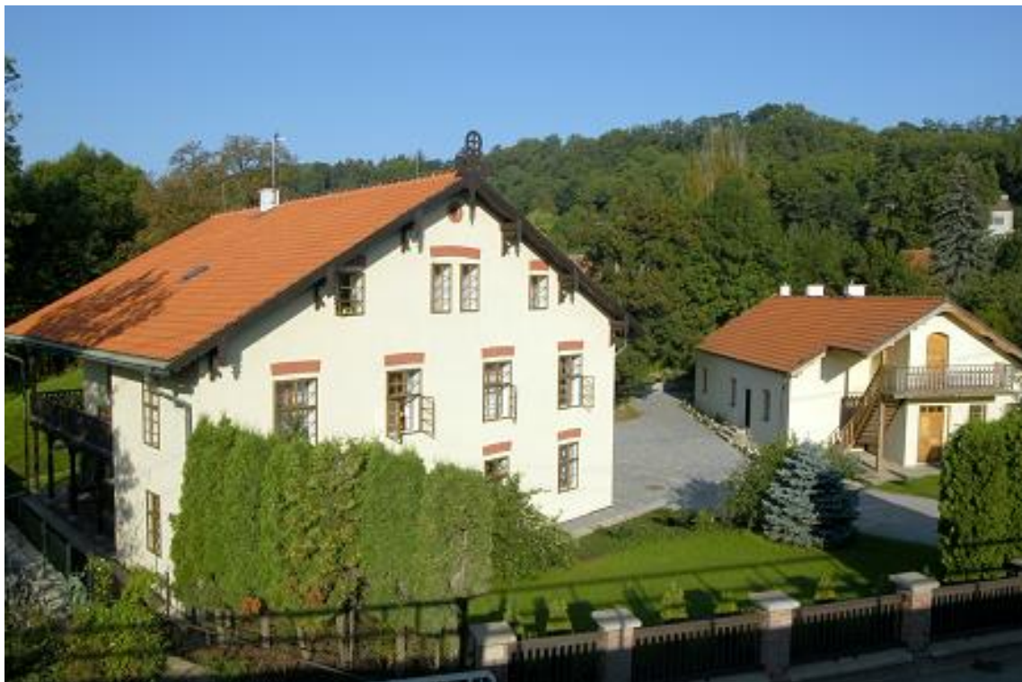
Roztoky – areál Braunerova mlýna, budovy ředitelství, administrativního a odborného pracoviště

Libčice nad Vltavou – areál statku – detašované archeologické pracoviště, depozitáře