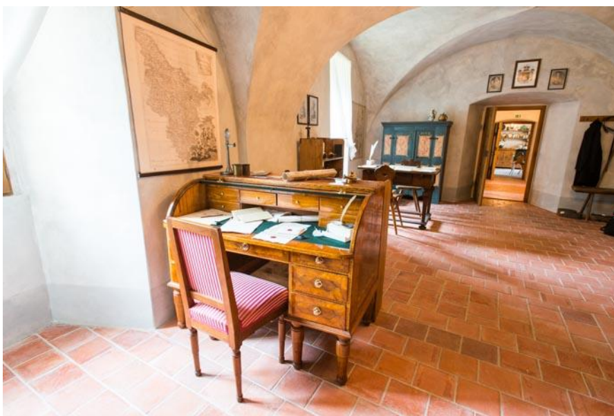
Roztoky – Zámek – Pohled do expozice Vrchnostenská správa panství aneb jak bydlel a úřadoval pan správce