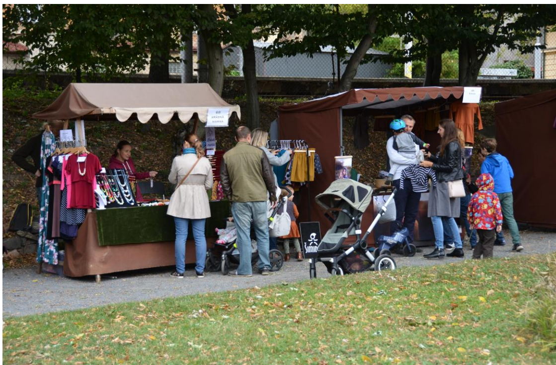
Design Lock – 1. ročník design marketu