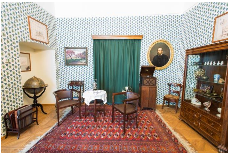
Roztoky – Zámek, Pohled do expozice Život v letovisku aneb jak se jezdilo do Roztok na letní byt