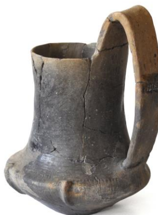
Nádoba, kanelovaný čerpáček ze sbírek SM, pálená hlína, v. čerpáčku – 13, 8 cm, kultura s kanelovanou keramikou, inv. č. A 112179-180