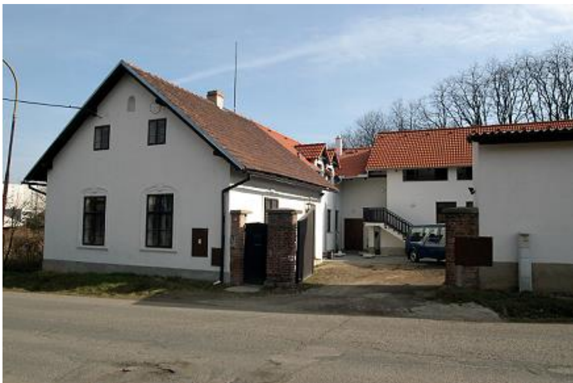
Libčice nad Vltavou – areál statku – detašované archeologické pracoviště, depozitáře