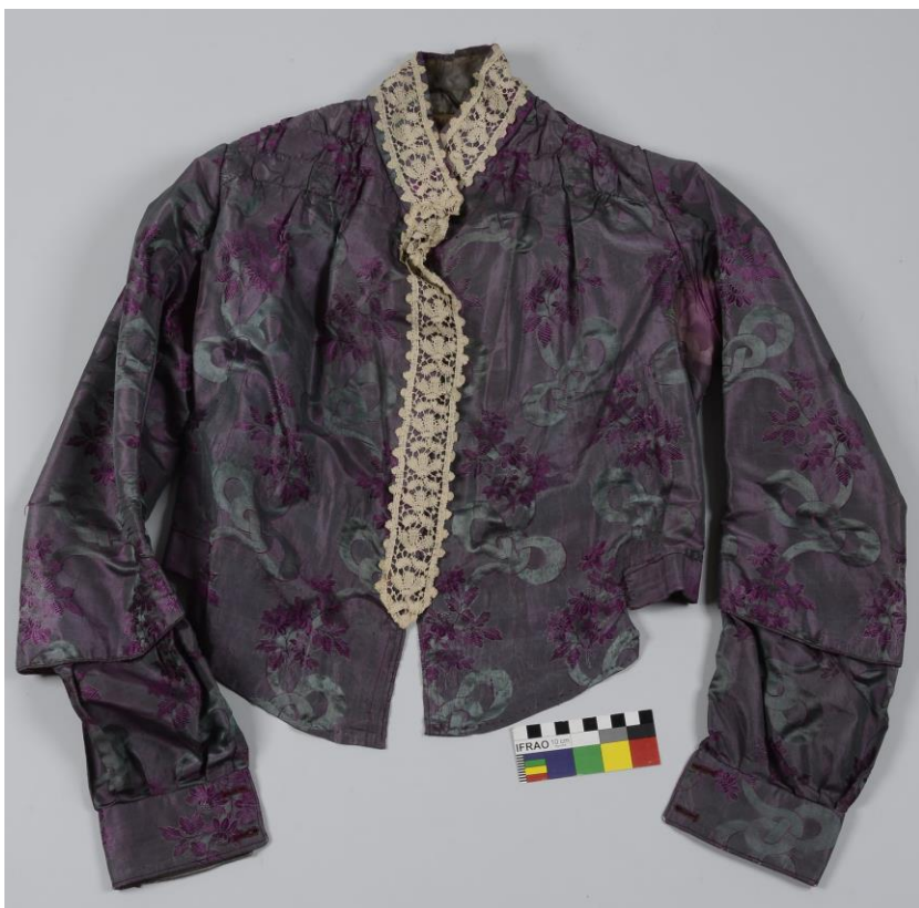
Dámský hedvábný kabátek ze sbírek SM, hedvábí, krajka, 20. léta 20. století, Čechy, př. č. 427/2018