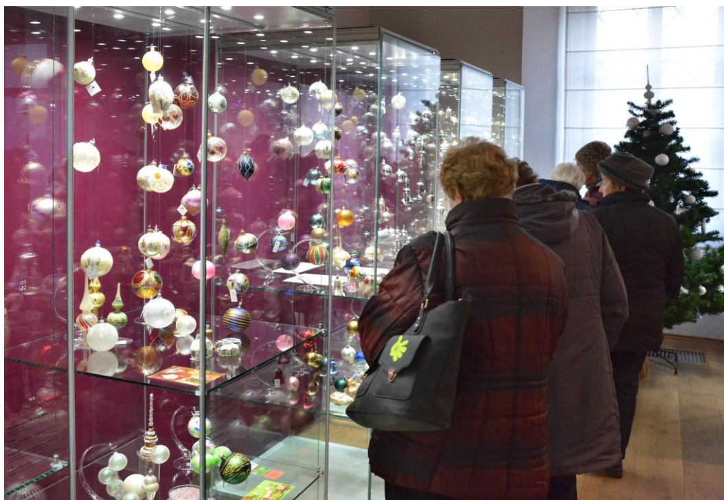
Pohled do výstavy Historické vánoční ozdoby ...tentokrát z Královédvorka