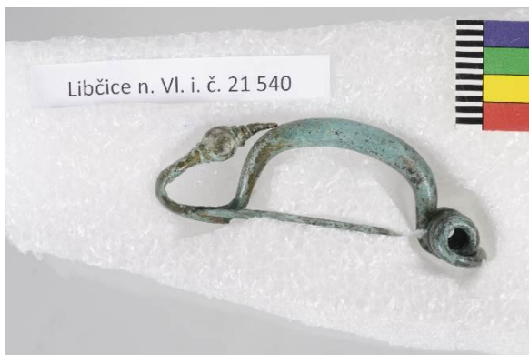
Spona ze sbírek SM, nález z Libčic nad Vltavou, slitina mědi, inv. č. 21540