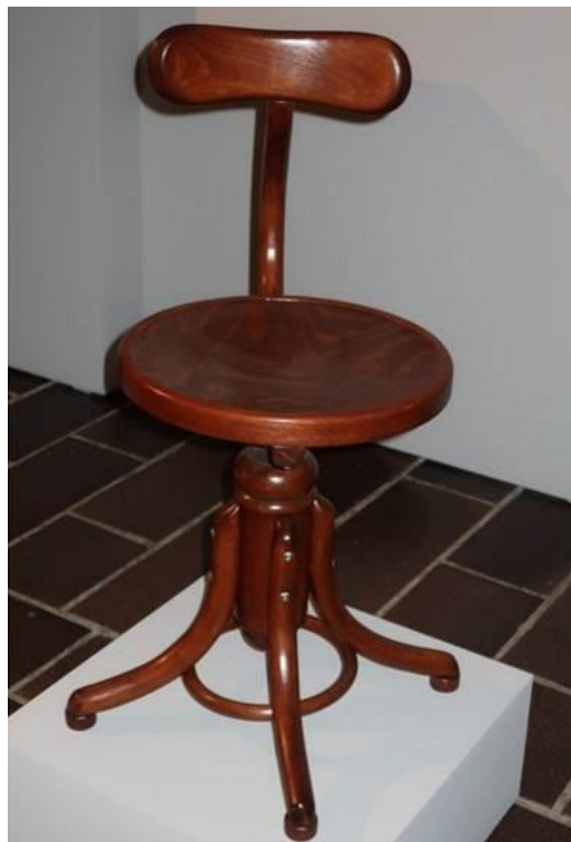
Stolička Thonet, soukromá sbírka, 1930, Návrhář Gustav Siegel, židle Thonet B 564, 1930, bukové dřevo, šířka 37 cm, zakázka ze sbírky UPM