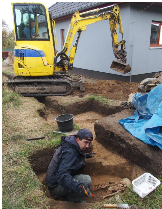
Záchranný výzkum pohřebiště únětické kultury Holubice, parc. č. 93/15, Stavba oplocení pozemku