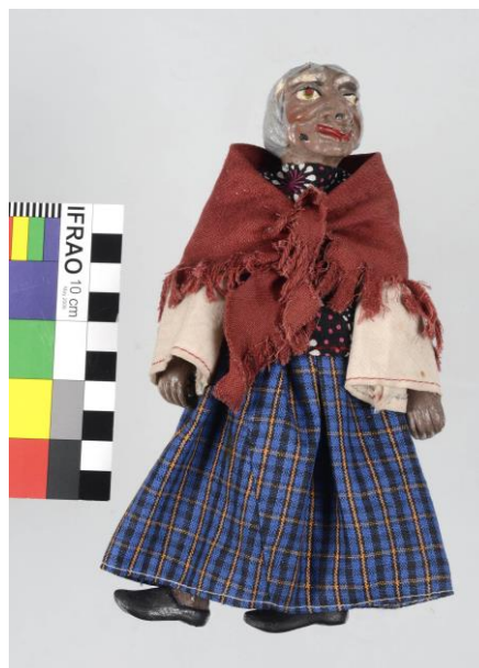
Loutka čarodějnice ze sbírek SM, 30. léta. 20. století, kompozit a textil, v. 19 cm, př. č. 1206/2017