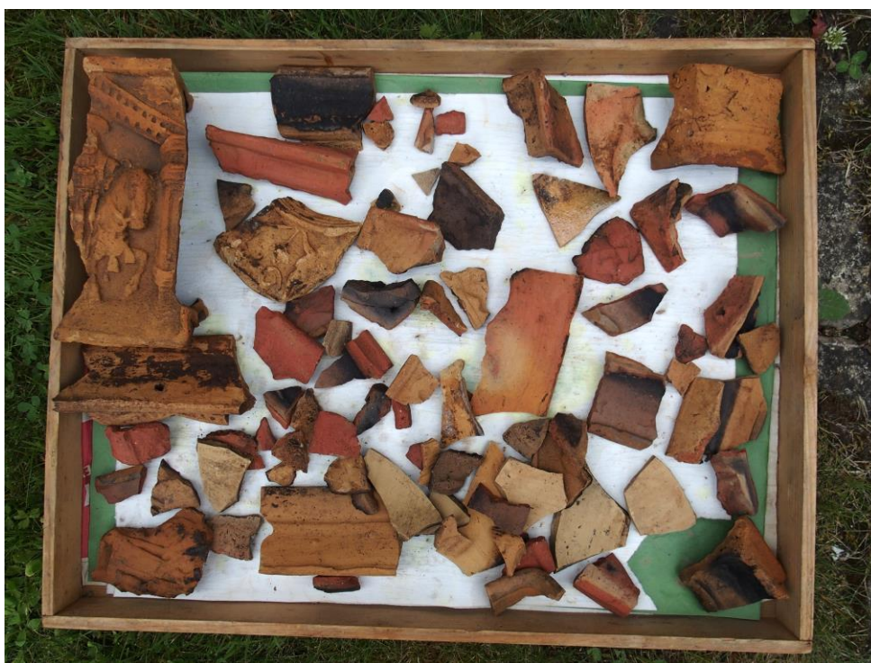
Fragmenty kamnových kachlů ze 16. století nalezené v odpadní jámě, Holubice, jádro obce Rekonstrukce vedení kNN