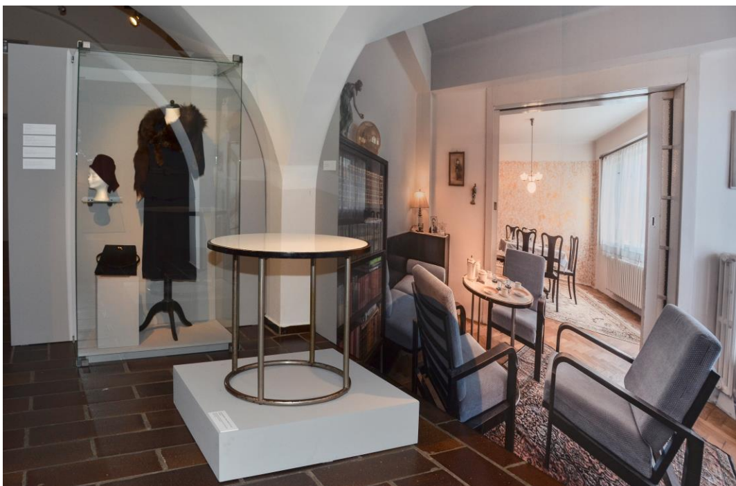
Pohled do výstavy Prima sezóna. Vily v okolí Prahy – interiérový a oděvní design první republiky