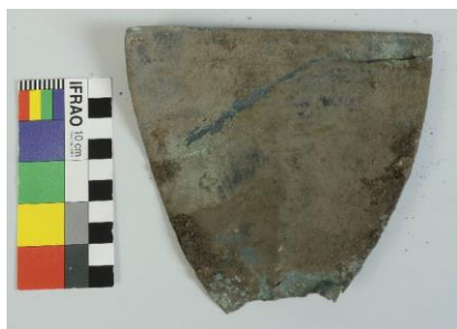
Veslovitá jehlice ze sbírek SM, Tursko 2015, slitina mědi, č. s. 084