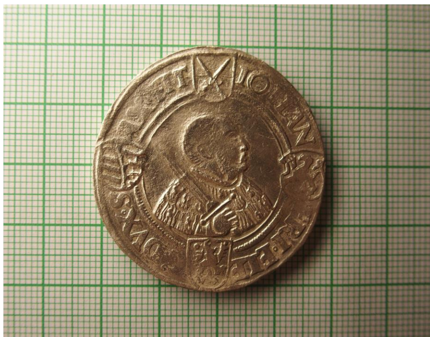
Saský tolar z roku 1539 objevený ve výhozu z výkopu před čp. 76, Holubice, jádro obce, Rekonstrukce vedení KNN