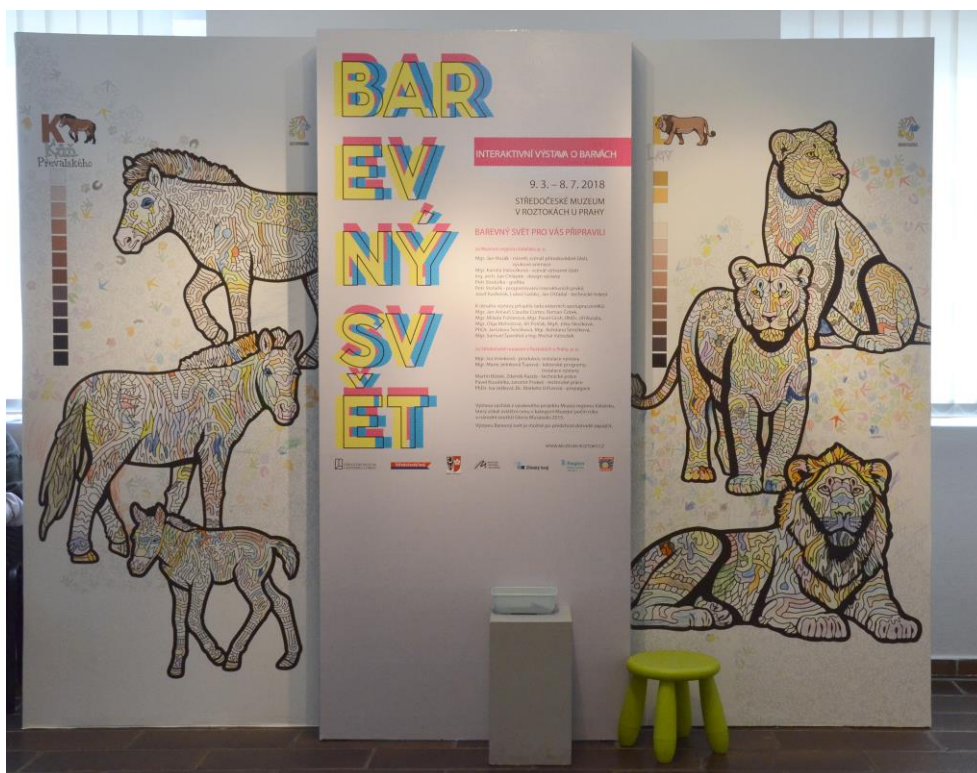
Pohled do výstavy Barevný svět