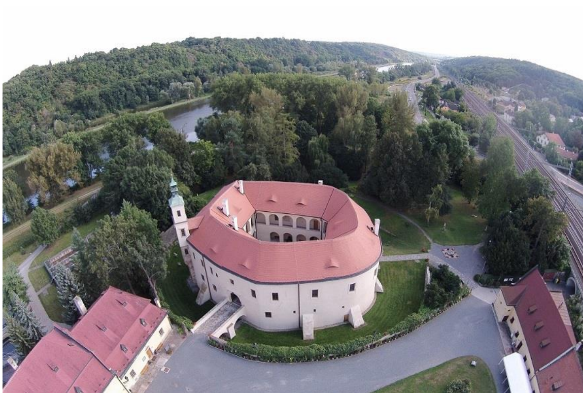
Roztoky – letecký pohled na areál zámku