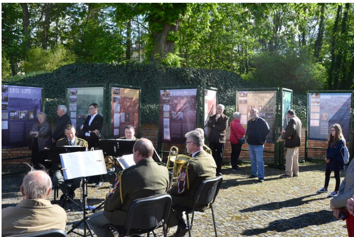
Zahájení projektu Příběhy Tichého údolí. Osudy zpečetěné hákovým křížem, srpem a kladivem