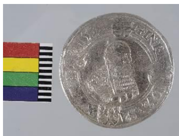
Stříbrný tolar ze sbírek SM, nález Holubice 2018, datace 1539, stříbro, př. č. 8/2018