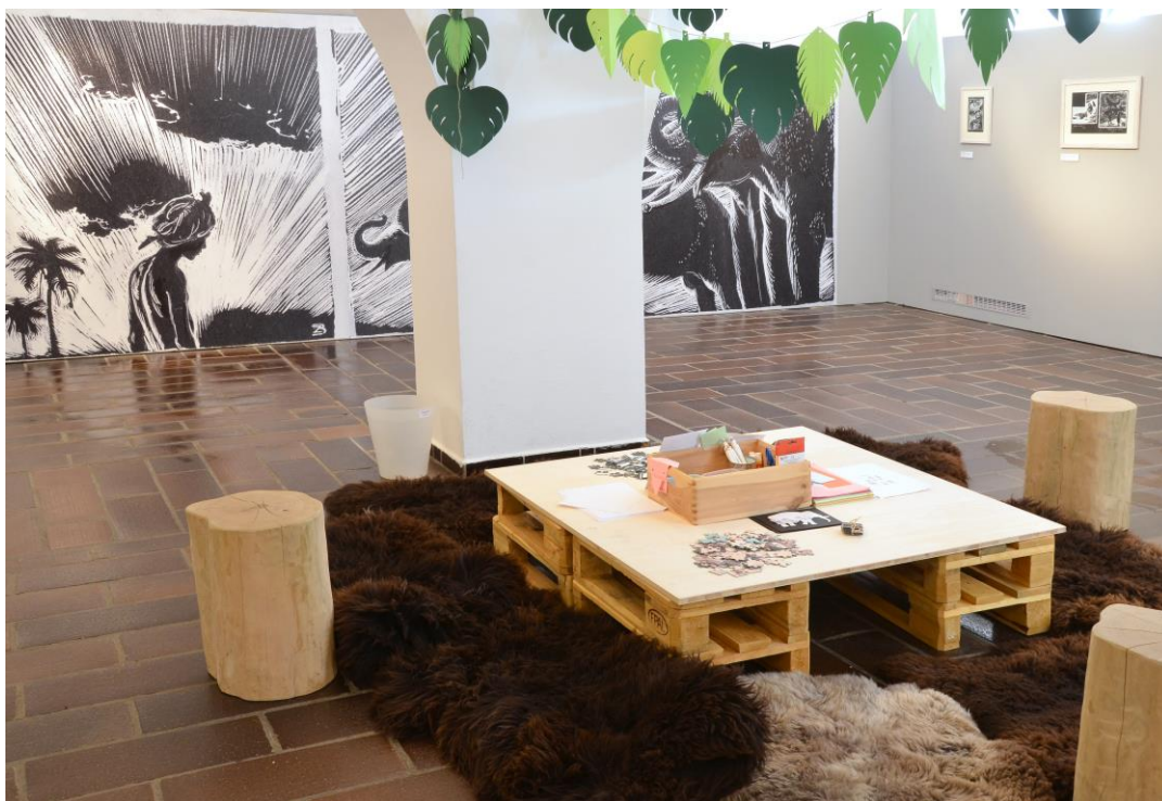
Pohled do výstavy Zdeněk Burian. Na vlně dobrodružství