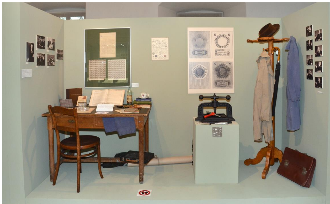
Pohled do výstavy Československý kolek ...milovník nejen rumu a tabáku