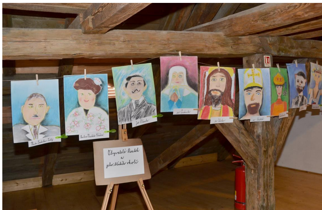
Pohled do výstavy Dětská kresba