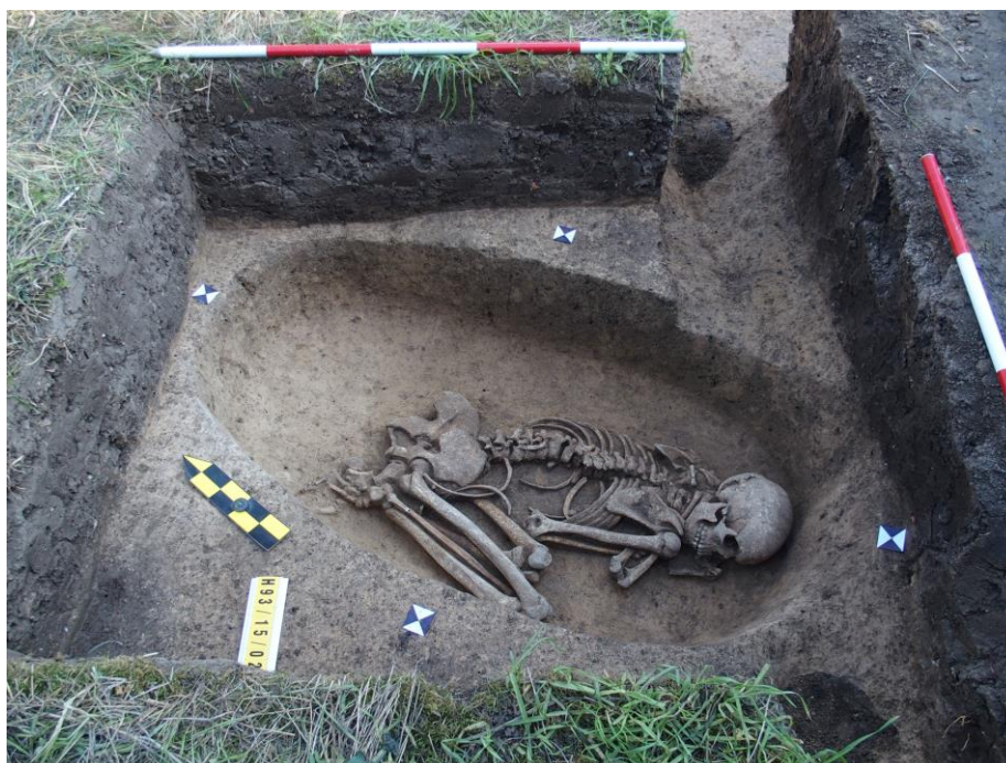
Kostrový hrob únětické kultury, Holubice, parc. č. 93/15, Stavba oplocení pozemku