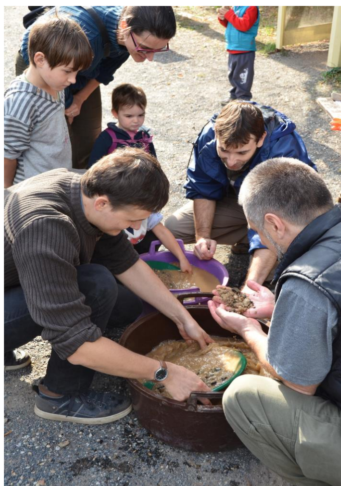
5. Mezinárodní den archeologie