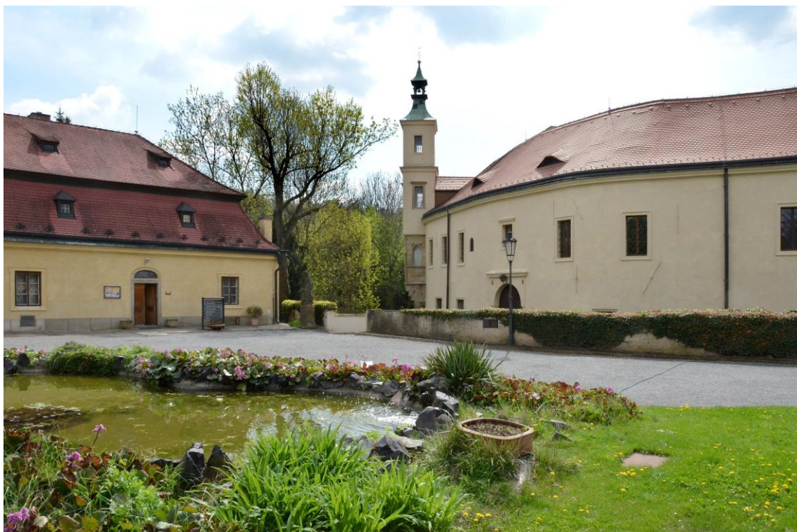
Roztoky – areál zámku