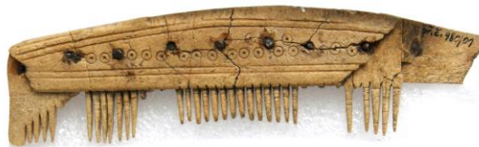
Kostěný hřeben rovného hřbetu zdobený vybíjenými kroužky ze sbírek SM, kost, d. 14 cm, období stěhování národů, inv. A 168082