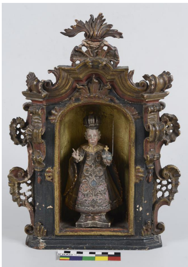
Soška Pražského Jezulátka v ozdobné skříňce, polychromovaná dřevořezba, Jezulátko v. 19 cm, skříňka v. 38 cm, 22, 5 cm x 9, 5 cm, konec 18. století, pp. Čechy, př. č. 296/2018