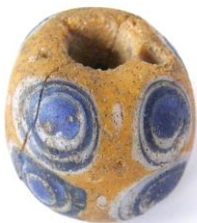
Skleněný korál s očky ze sbírek SM, skelná pasta žluté barvy s 8 modrobílými očky, v. 1, 5 cm, Ø 1,7–1,9 cm, Ø otvoru 0,6 mm, č.období halštat – latén, inv. č. A 22446