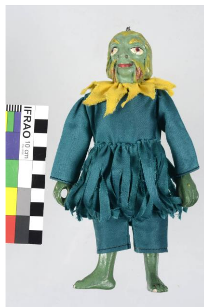
Loutka vodníka ze sbírek SM, 30. léta 20. století, kompozit a textil, v. 19 cm, př. č. 1215/2017