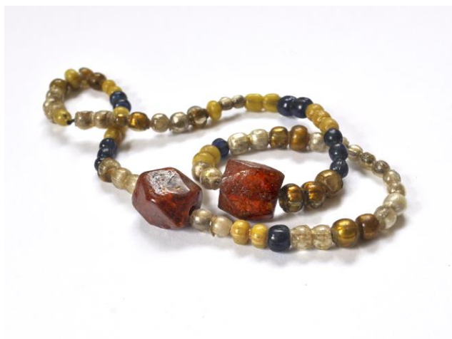
Náhrdelník ze skleněných korálků a 2 hraněných jantarů ze sbírek SM, sklo, jantar, raný středověk, inv. č. A 72111