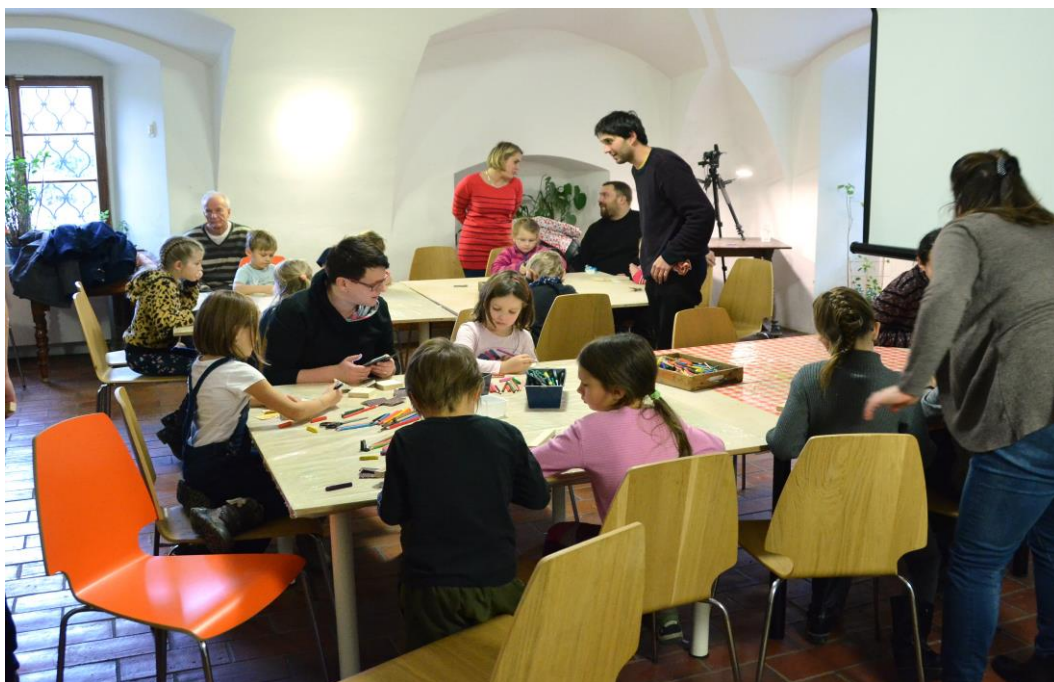
Výtvarné a animační dílny – Adventní neděle