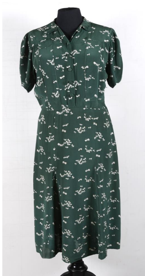
Dámské šaty ze sbírek SM, 30. léta 30. století, hedvábí, tisk, př. č. 570/2014