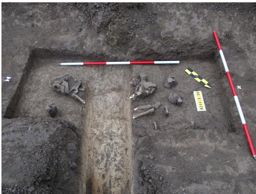
Kostrový hrob únětické kultury se dvěma nádobami, Holubice, parc. č. 244/8, Stavba rodinného domu