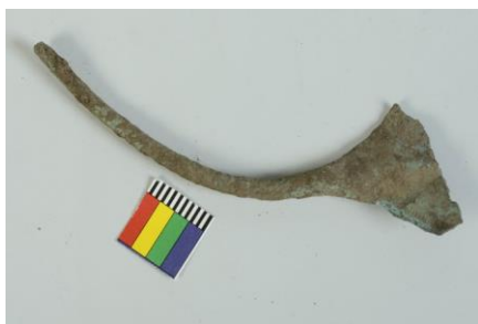
Veslovitá jehlice ze sbírek SM, Tursko 2015, slitina mědi, č. s. 152