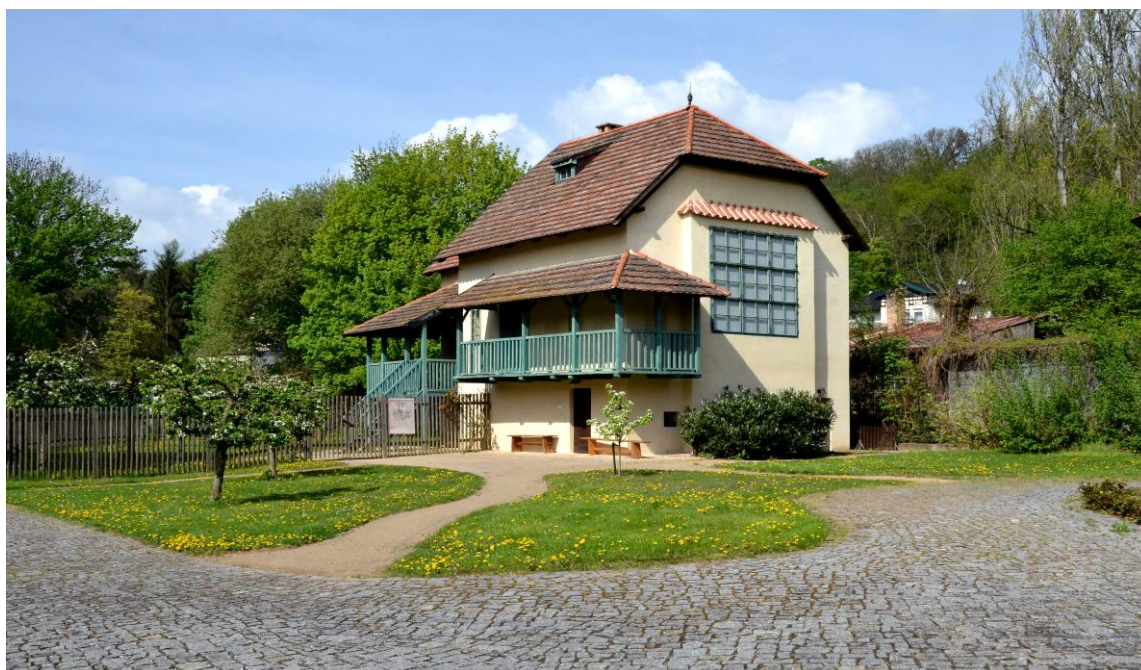
Roztoky – Ateliér Zdenky Braunerové