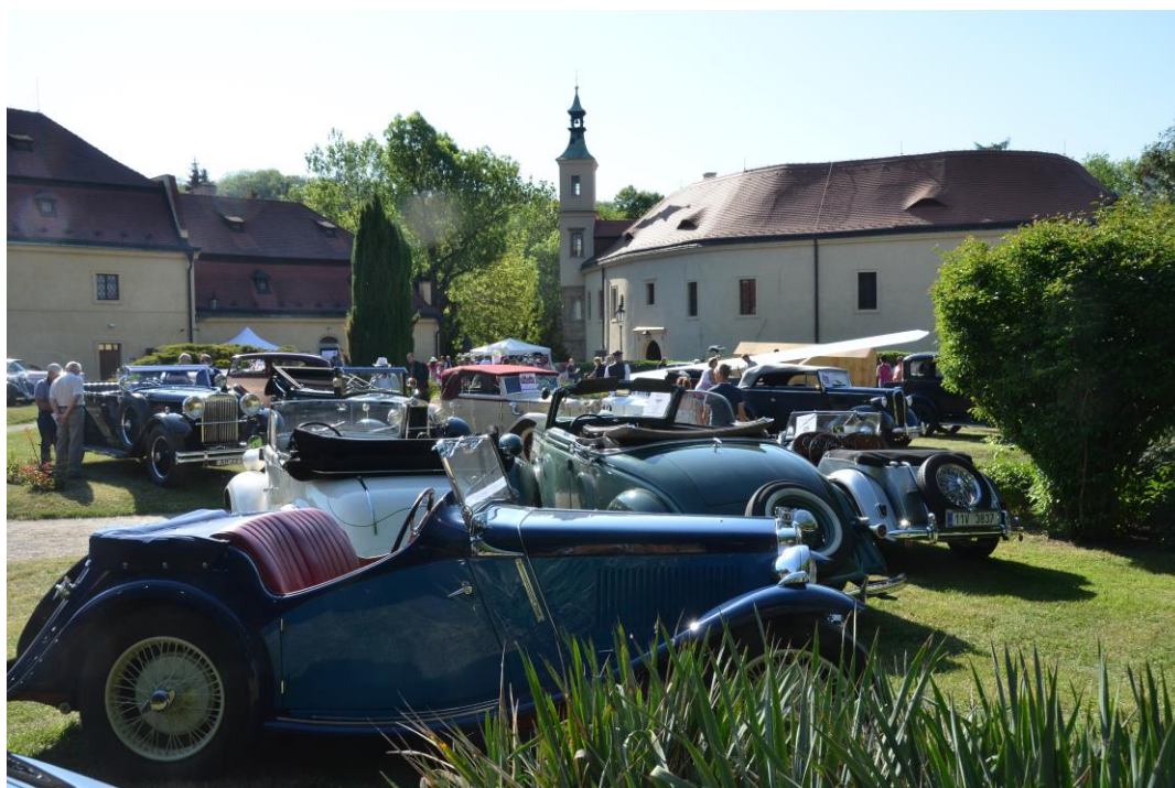
Veteráni – 39. ročník soutěže elegance historických vozidel