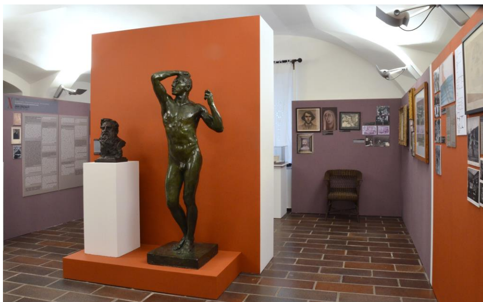
Pohled do výstavy Vysoce ctěná slečno / Můj milý. Desatero mužů na paletě Zdenky Braunerové