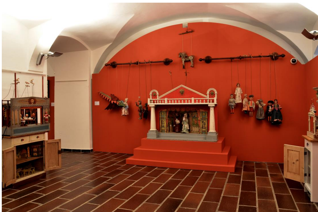
Pohled do výstavy Kašpárkův svět. Rodinná loutková divadla