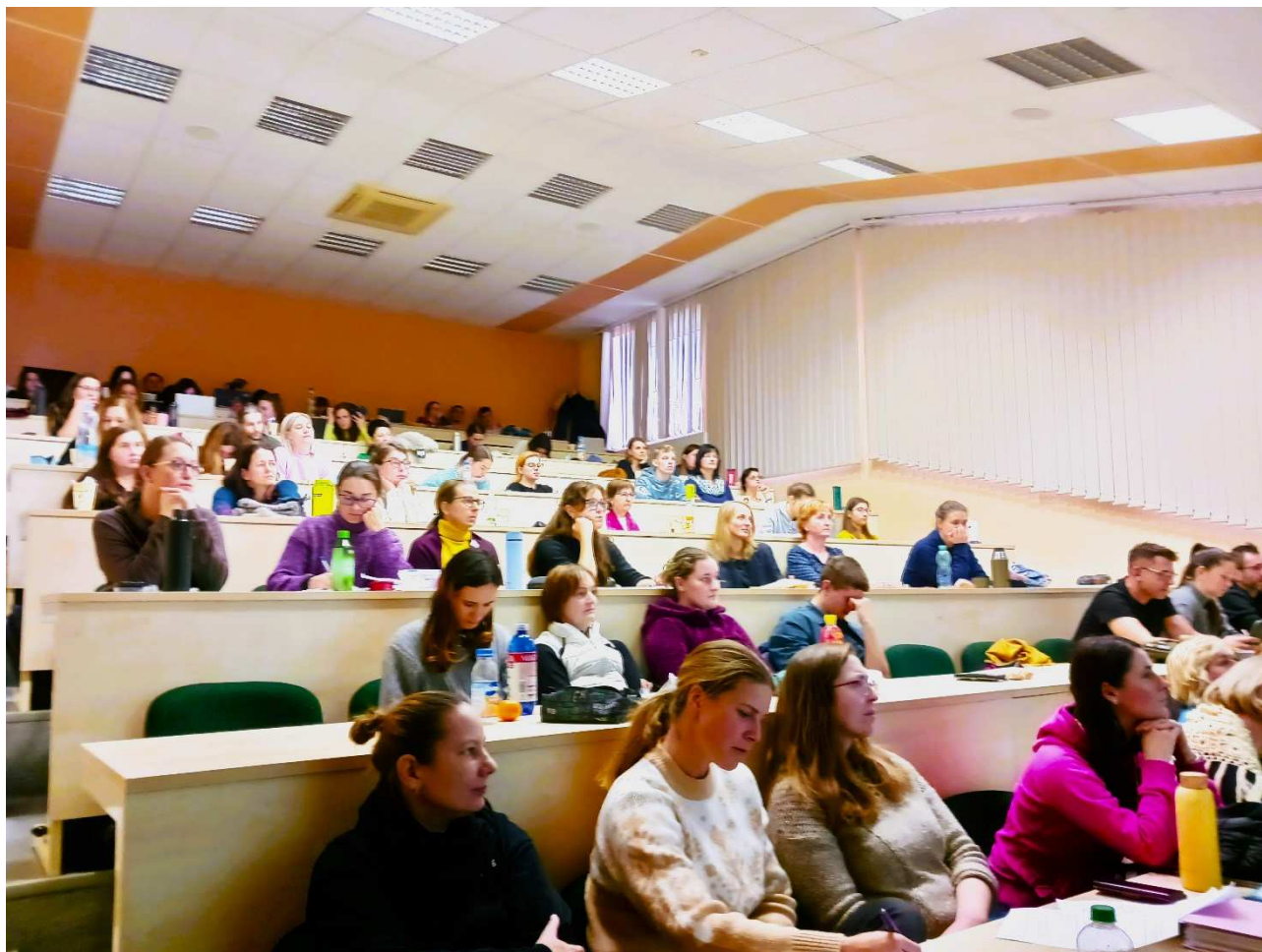
Arboristická konference s účastí studentů VOŠ i zástupců z řad odborné veřejnosti (7. 12. 2023)

Česká zahradnická akademie Mělník střední škola a vyšší odborná škola, příspěvková organizace