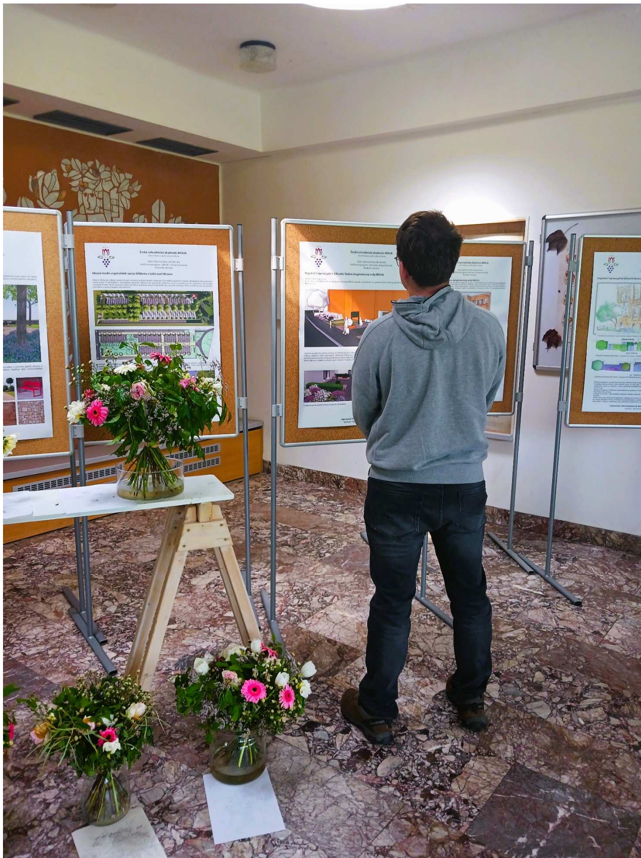
Výstava projekčních prací studentů VOŠ ve vestibulu školy (duben 2024)

Česká zahradnická akademie Mělník střední škola a vyšší odborná škola, příspěvková organizace