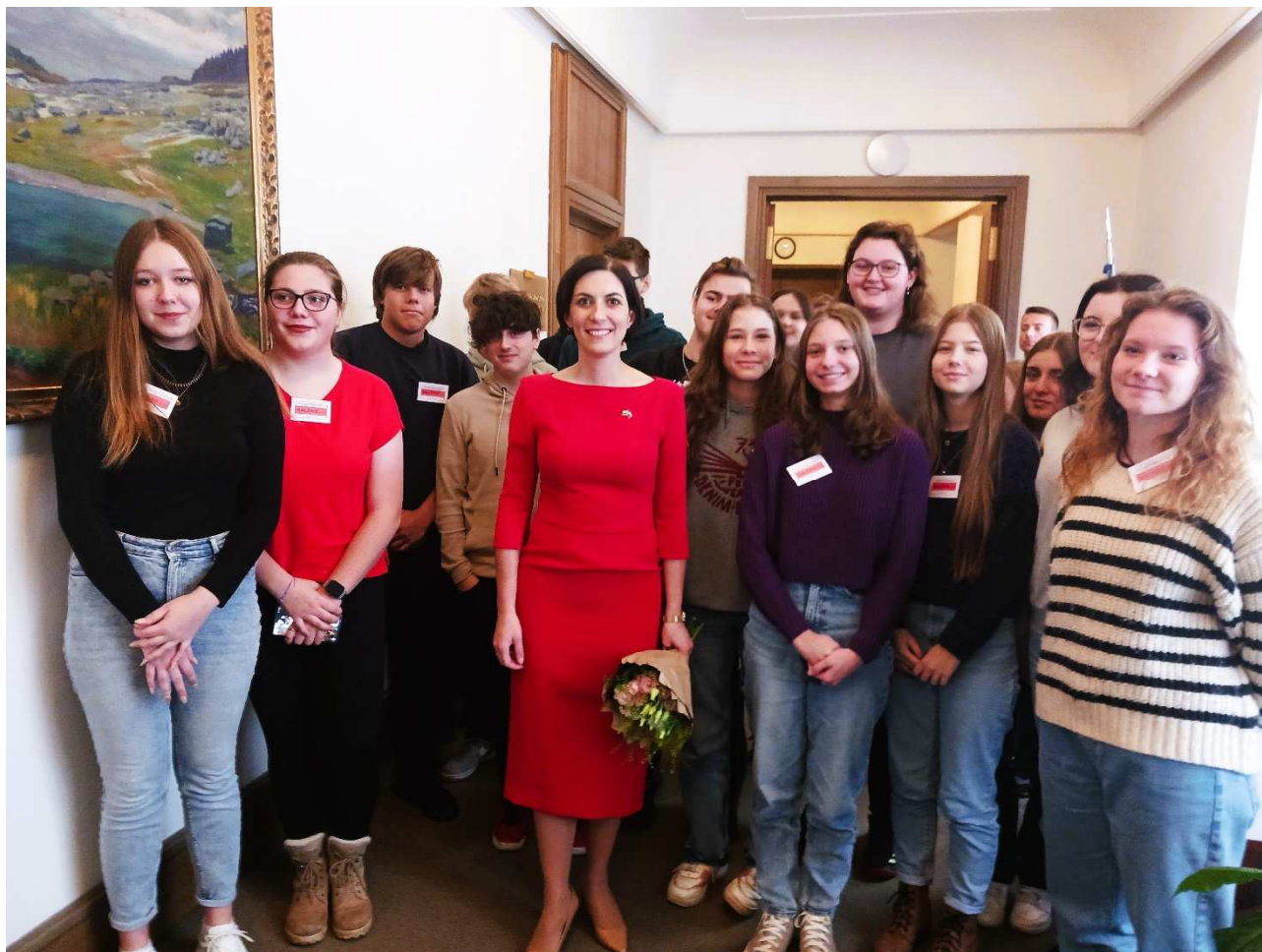
Žáci 2.B v Poslanecké sněmovně Parlamentu České republiky při krátkém setkání s předsedkyní sněmovny Markétou Pekarovou Adamovou (30. 11. 2023)

Česká zahradnická akademie Mělník střední škola a vyšší odborná škola, příspěvková organizace