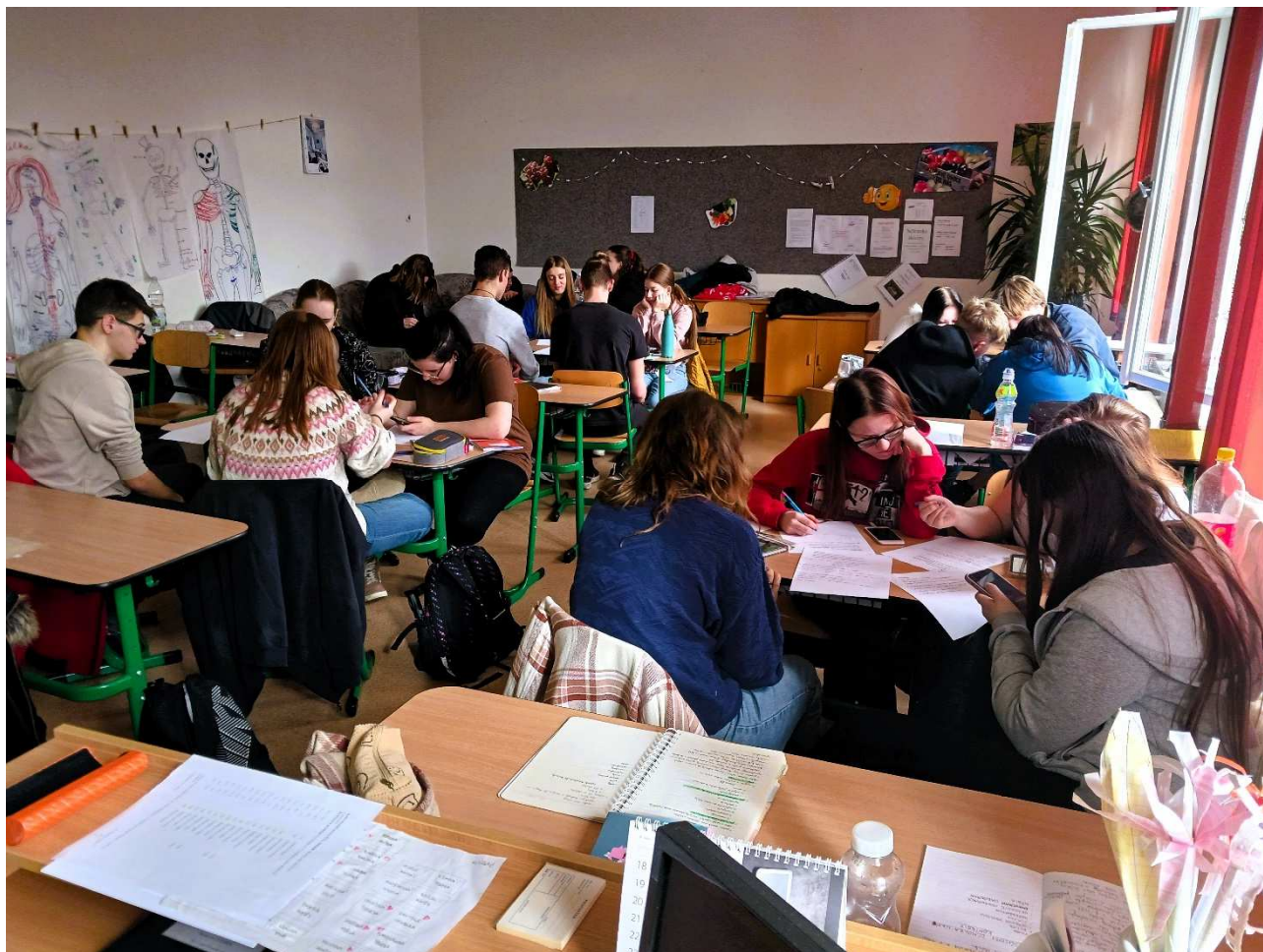
Skupinová práce ve výuce žáků 2.B (14. 4. 2024)

Česká zahradnická akademie Mělník střední škola a vyšší odborná škola, příspěvková organizace