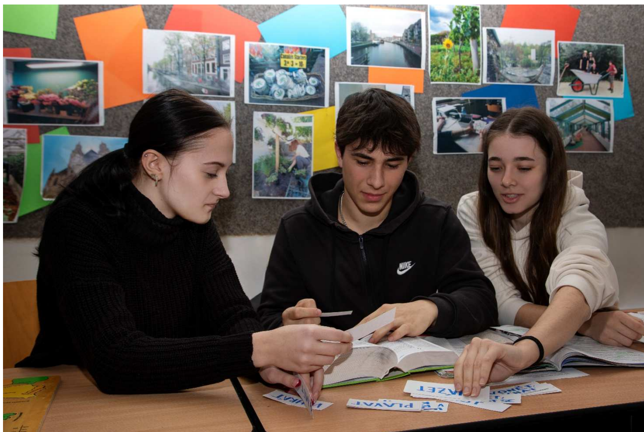
Žáci 3.A ve výuce angličtiny, propagační foto (březen 2024)

Česká zahradnická akademie Mělník střední škola a vyšší odborná škola, příspěvková organizace