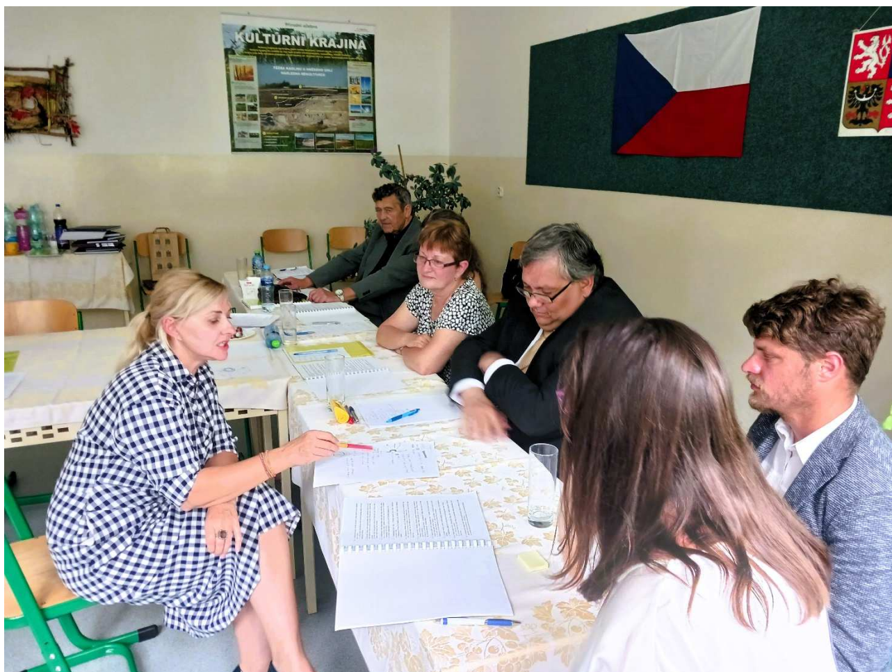
Průběh závěrečného absolutoria na vyšší odborné škole (19. 6. 2024)

Česká zahradnická akademie Mělník střední škola a vyšší odborná škola, příspěvková organizace