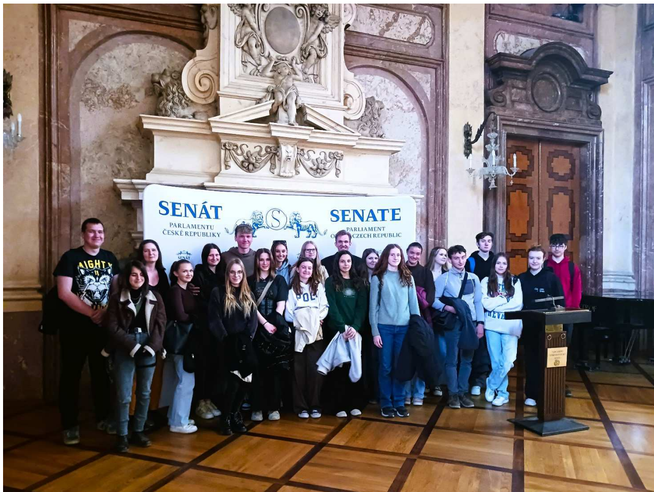
Žáci 2.A na prohlídce Senátu Parlamentu České republiky (18. 4. 2024)

Česká zahradnická akademie Mělník střední škola a vyšší odborná škola, příspěvková organizace