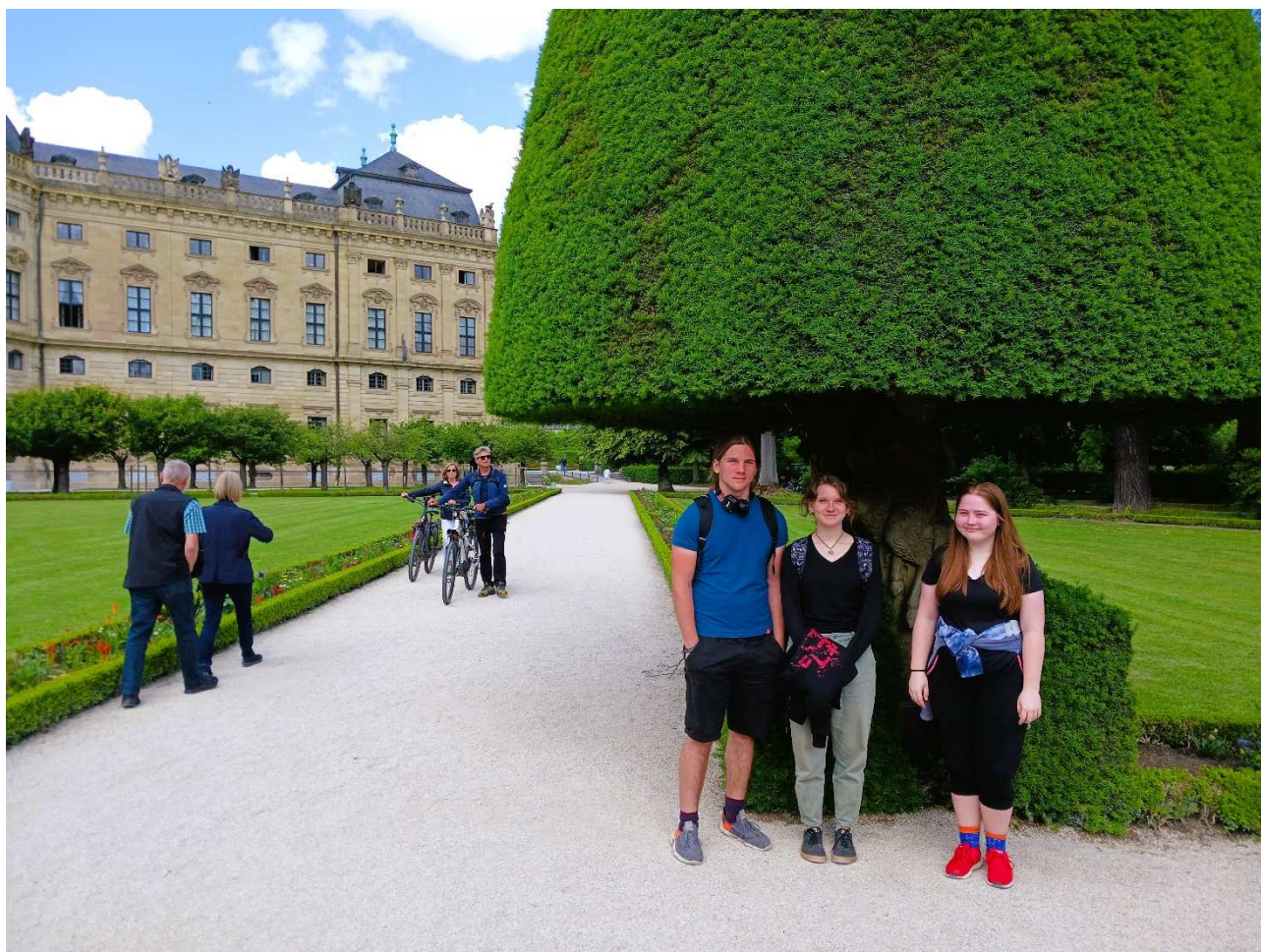
Žáci 2.B při prohlídce areálu hraběcí rezidence v německém Würzburgu (11. 6. 2024)

Česká zahradnická akademie Mělník střední škola a vyšší odborná škola, příspěvková organizace