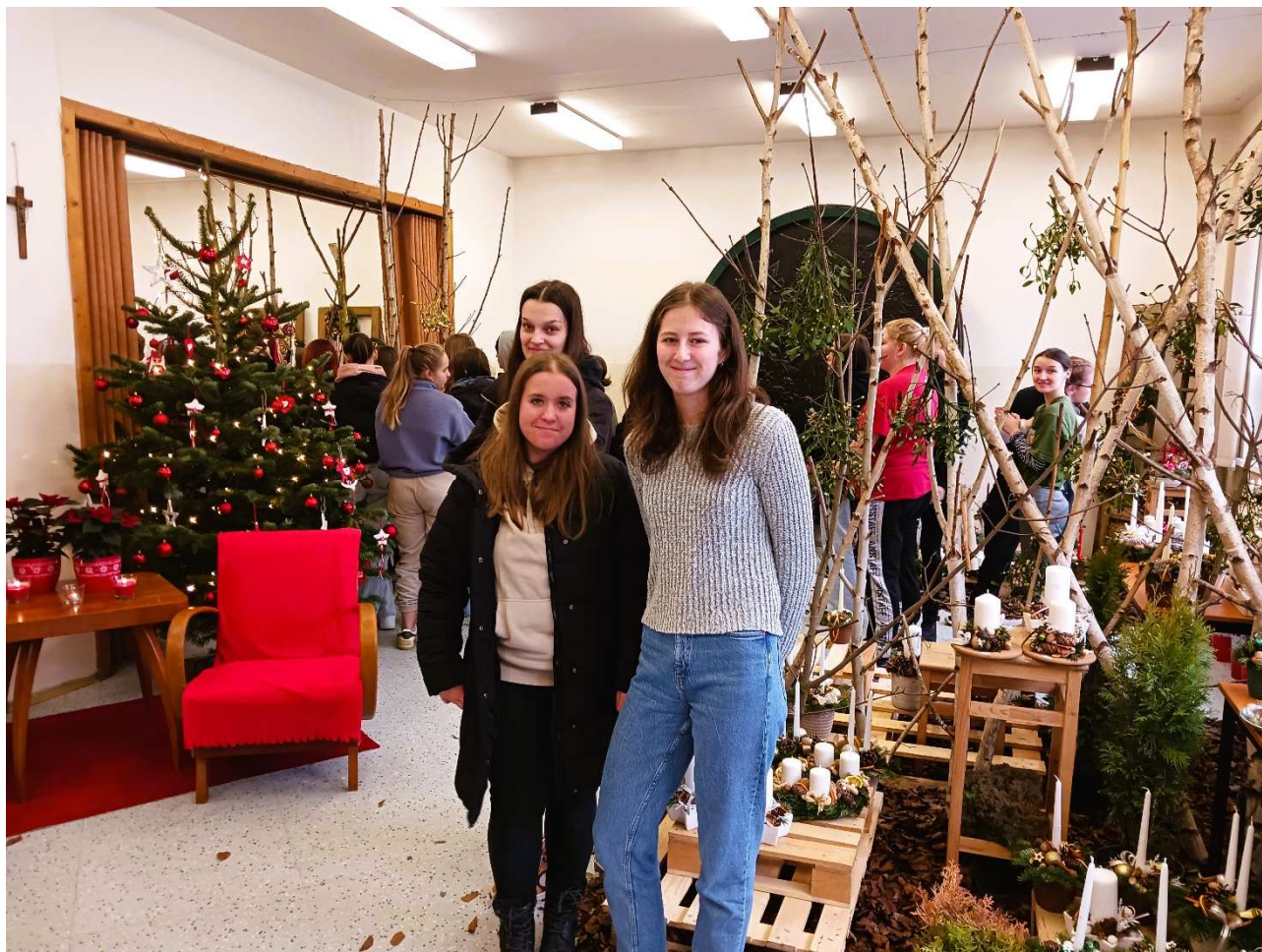
Vernisáž tradiční vánoční výstavy žákovských floristických prací v sále za jídelnou (1. 12. 2023)

Česká zahradnická akademie Mělník střední škola a vyšší odborná škola, příspěvková organizace