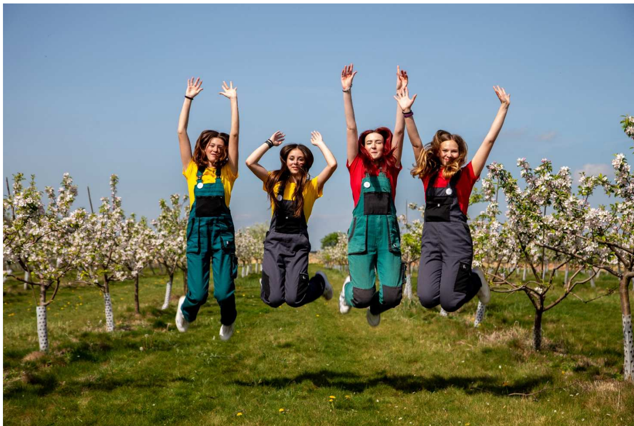
Žákyně střední školy v sadu na školním statku, propagační foto (duben 2024)

Česká zahradnická akademie Mělník střední škola a vyšší odborná škola, příspěvková organizace