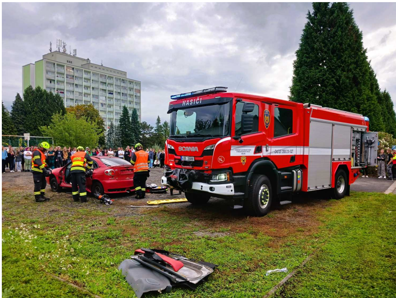
Na hřišti v areálu školy při cvičném poplachu a ukázce práce integrovaného záchranného systému (13. 10. 2023)