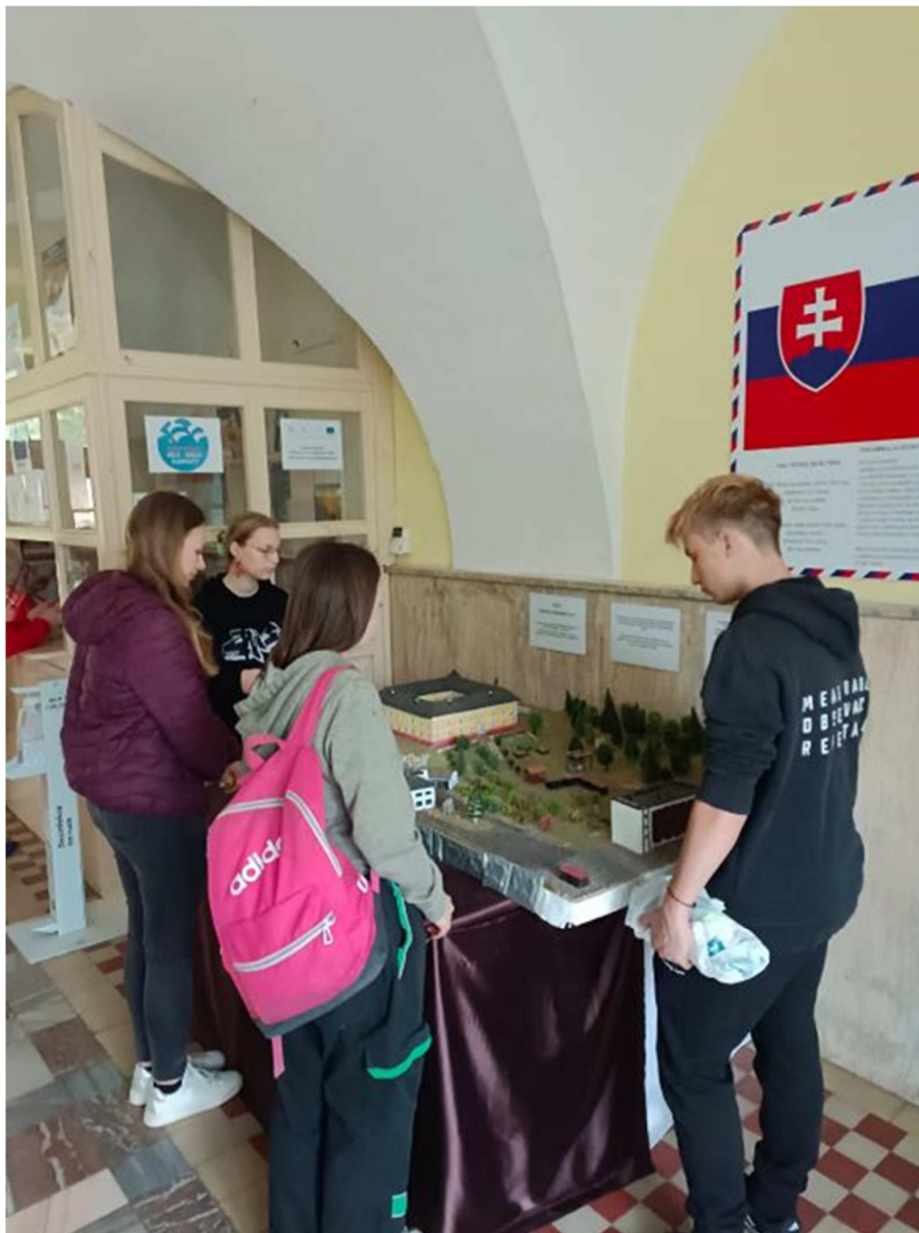
Žáci 2.U na odborné stáži ve slovenském Pruském (duben 2024)

Česká zahradnická akademie Mělník střední škola a vyšší odborná škola, příspěvková organizace