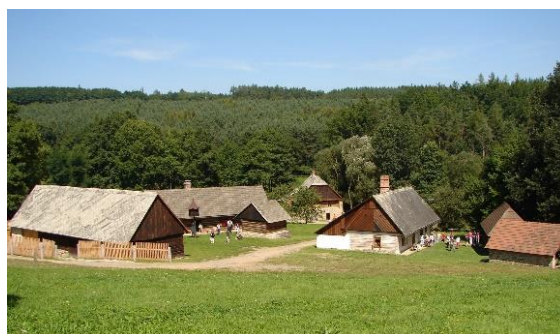
Skanzen Vysoký Chlumec