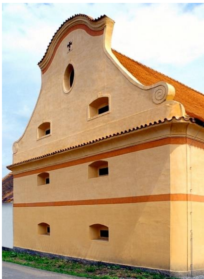
Muzeum Špýchar Prostřední Lhota