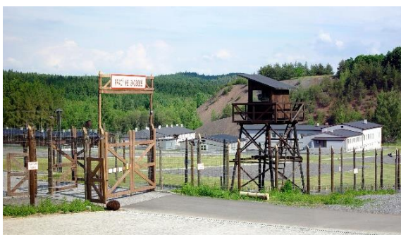
Památník Vojna Lešetice

Činnost Hornického muzea Příbram v současné době zajišťuje 65 zaměstnanců , z toho 56 kmenových . Přepočtený počet kmenových zaměstnanců činní 49,52 osob . Rozsahem prohlídkových areálů s několikakilometrovým podzemím zdejších historických dolů, 3 drážními tělesy hornických vláčků, 71 stálými expozicemi v 57 budovách je jedním z největších hornických muzeí v ČR i v Evropě ; kromě areálů v Příbrami provozuje 5 poboček : Památník Vojna Lešetice, Skanzen Vysoký Chlumec, Špýchar Prostřední Lhota, Muzeum zlata Nový Knín a Uranový důl Bytíz, vše v lokalitách dotčených báňským podnikáním.