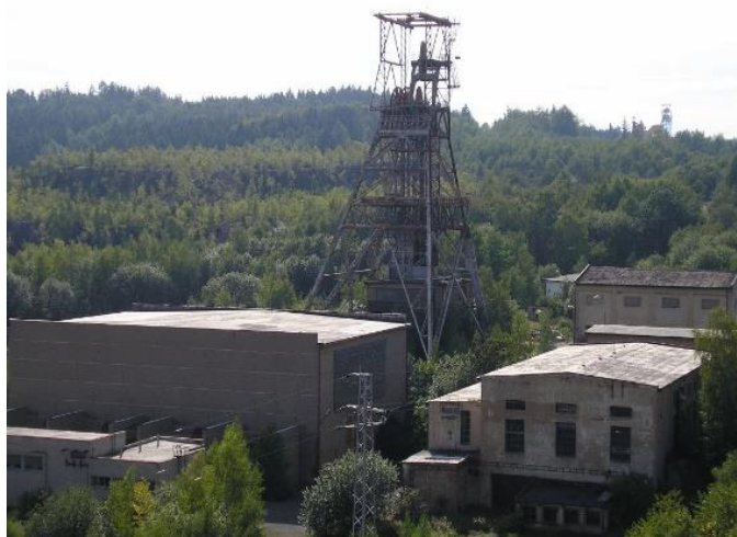
Uranový důl Bytíz