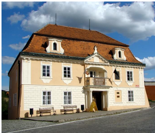
Muzeum zlata Nový Knín