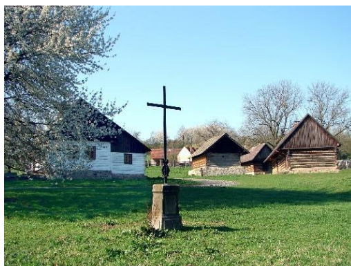
Skanzen Vysoký Chlumec