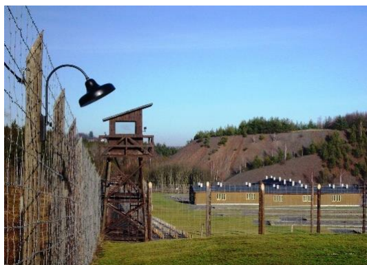
Památník Vojna Lešetice

Činnost Hornického muzea Příbram v současné době zajišťuje přibližně 60 kmenových zaměstnanců . Rozsahem prohlídkových areálů s několikakilometrovým podzemím zdejších historických dolů, 3 drážními tělesy hornických vláčků, 72 stálými expozicemi v 57 budovách je jedním z největších hornických muzeí v ČR i v Evropě ; kromě areálů v Příbrami provozuje 5 poboček : Památník Vojna Lešetice, Skanzen Vysoký Chlumec, Špýchar Prostřední Lhota, Muzeum zlata Nový Knín a Uranový důl Bytíz, vše v lokalitách dotčených báňským podnikáním.