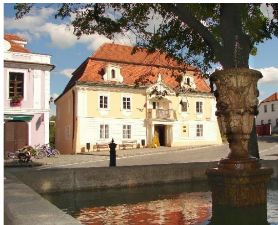
Muzeum zlata Nový Knín