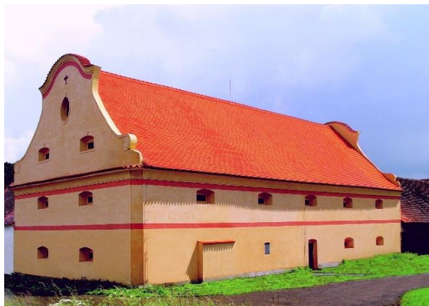
Muzeum Špýchar Prostřední Lhota