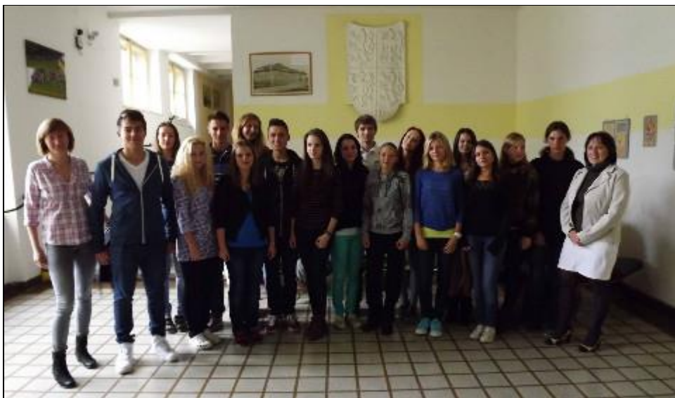
(český tým projektu Comenius)

(příloha 5 – program projektu Comenius v České republice – září 2014, článek v okresním periodiku).