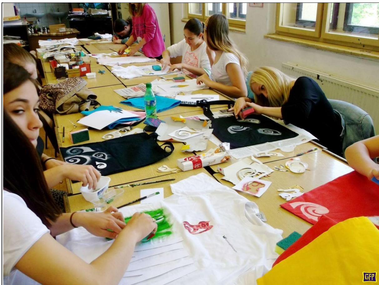
(dílny – malování na textil)