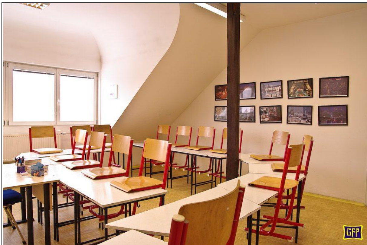
(Pracovna francouzského jazyka a latiny )