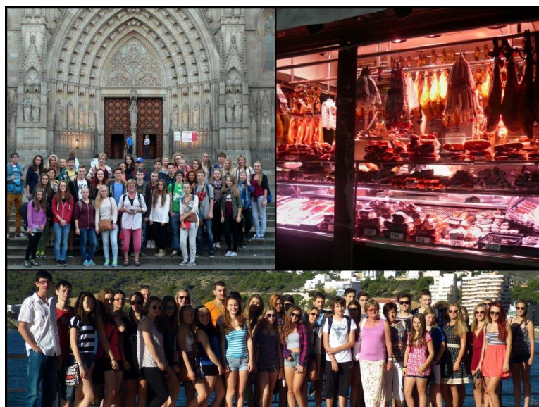
Poznávací zájezd do Španělska

9. – 13. 6. 2015 se konal poznávací zájezd do Francie – Štrasburk a Paříž. Zájezd byl zaměřen na poznávání reálií. Zúčastnilo se ho 37 žáků.