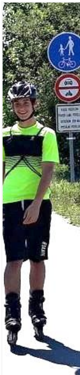
Inline brusle Kostelec - Brandýs