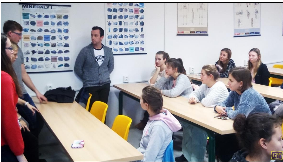
(z letošního setkání s absolventy GFP)

Učební plán vychází vstříc individuálním požadavkům žáků, v septimě a oktávě jim poskytuje širokou nabídku volitelných předmětů. Výběrem předmětů může každý žák dát konkrétní směr své další profesní orientaci. Pro sextány a septimány organizuje škola besedy s bývalými absolventy školy o přijímacím řízení na vysoké školy. Sextáni procházejí testy profesní orientace, absolvovali besedu s pracovníci Poradenského střediska pro volbu povolání.