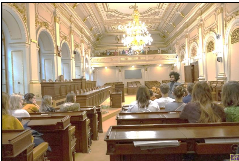
(Septima v Poslanecké sněmovně)