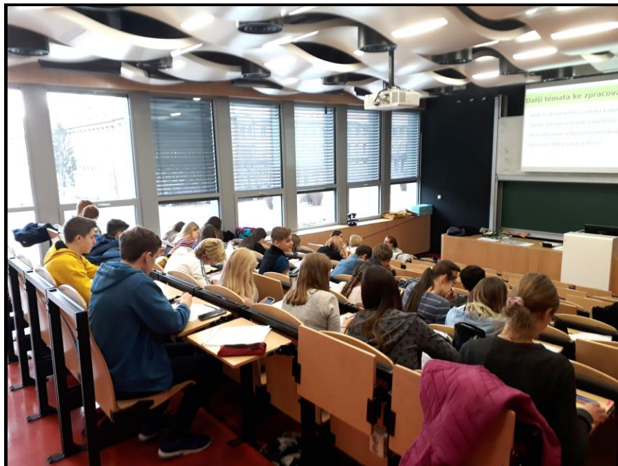
(kvintáni na ČVÚT Praha)

Projektu se zúčastnila v roce 2018/2019 jedna kvinta. V roce 2019/2020 se ho zúčastní jedna sexta.