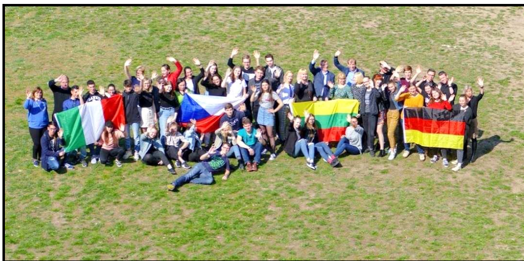
(Závěrečná výměna v Neratovicích)

Ve školním roce 2018/2019 se uskutečnily dvě výměny: Na přelomu září a října 2018 v Litvě a závěrečná výměna proběhla v dubnu 2019 v Neratovicích.