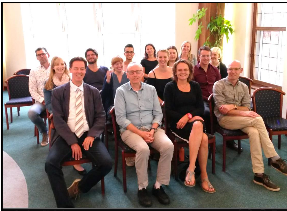
(účastníci mezinárodního mítinku učitelů – přijetí na neratovické radnici)

Geo-Circle by měl trvat 3 roky a měl by být zakončen (stejně jako předchozí projekt Geo-Water) v Nizozemsku (v roce 2021).