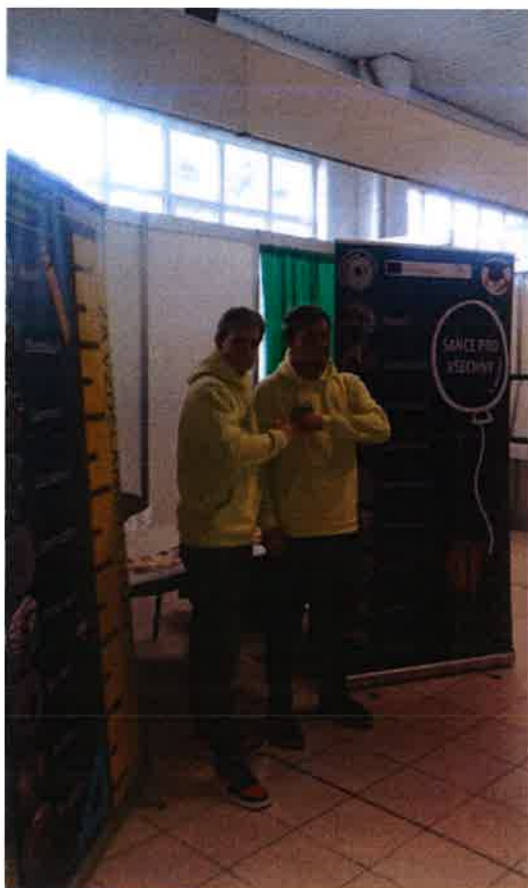
Burza technického vzdělávání Lysá n. L – únor 2020