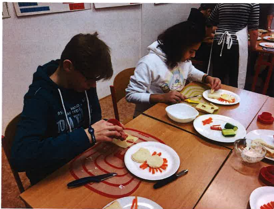
Tzv. „Dílničky“ pro žáky základních škol – prosinec 2019