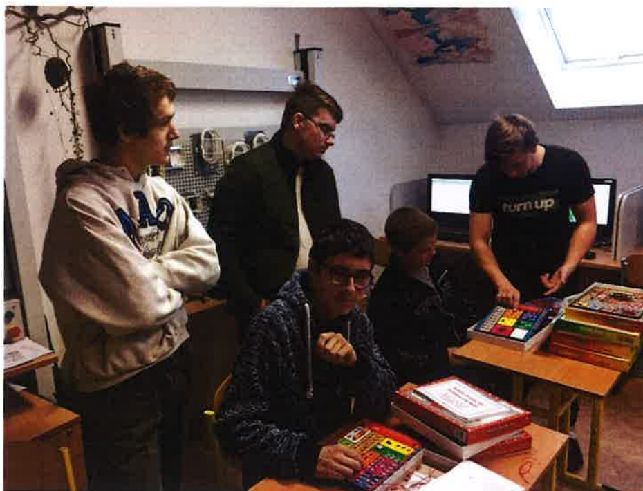
Den pro řemeslo – prezentace pro ZŠ – listopad 2019