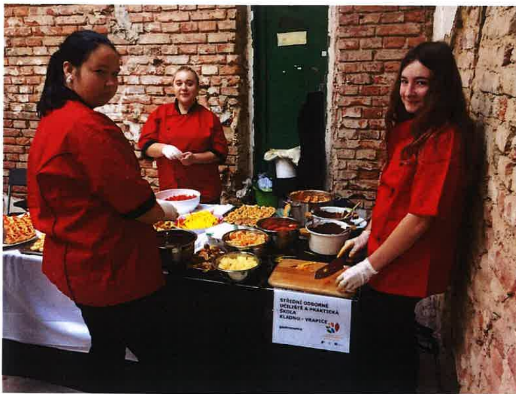
Prezentace škol Vet fest – říjen 2019