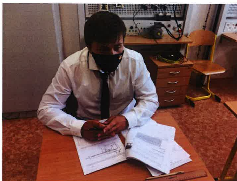
Závěrečné zkoušky – červen 2020