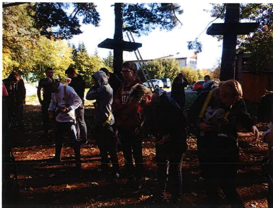
Sportovně – kulturní pobyt Křižanov – říjen 2019