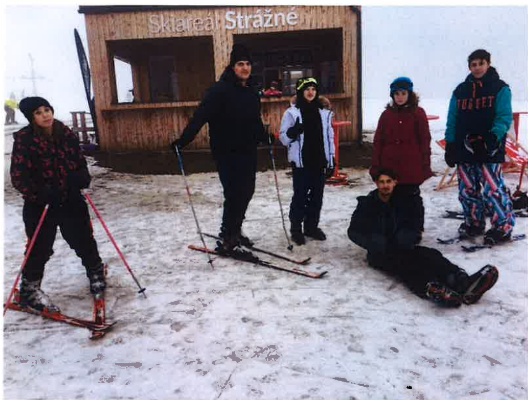
Lyžařský pobyt Strážné Krkonoše – leden 2020