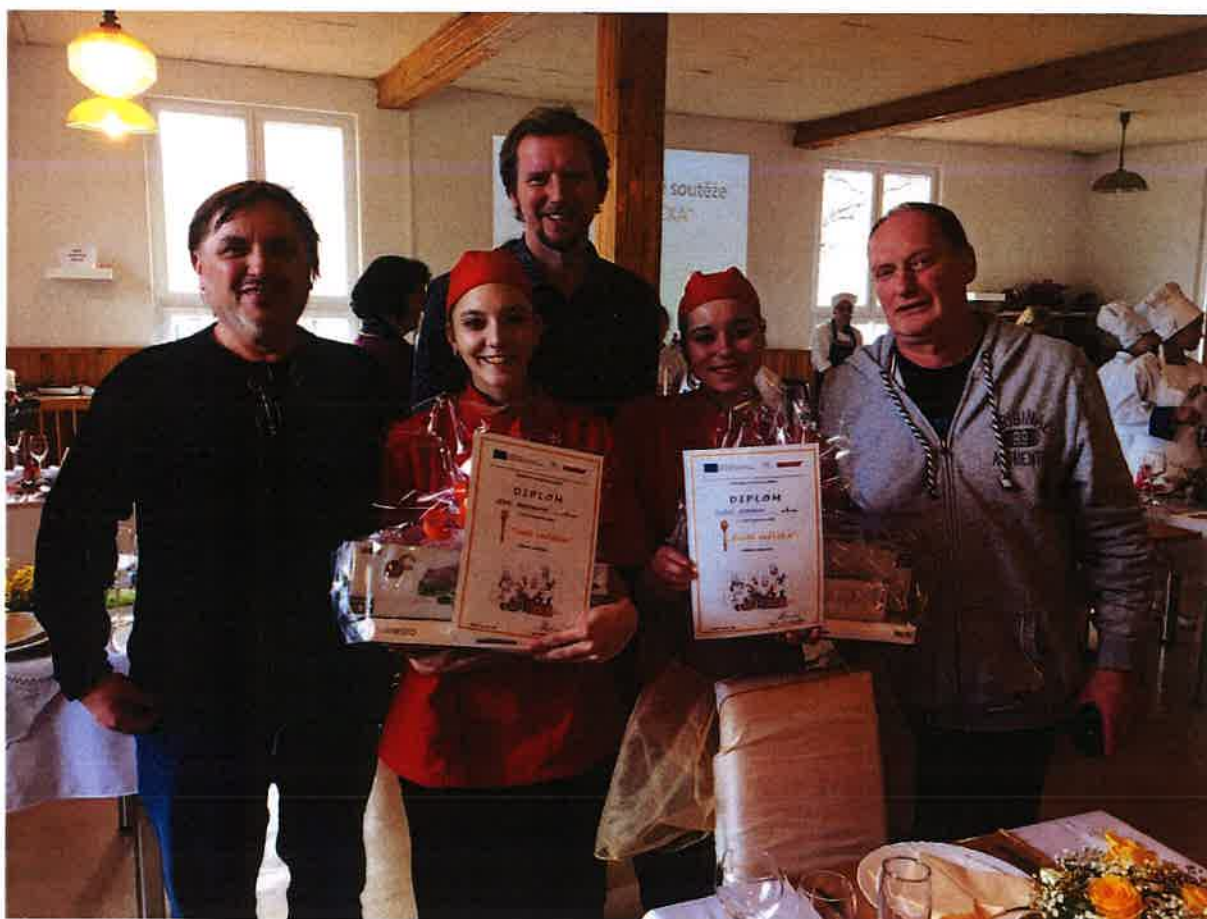
Soutěž „Zlatá vařečka“ – listopad 2019