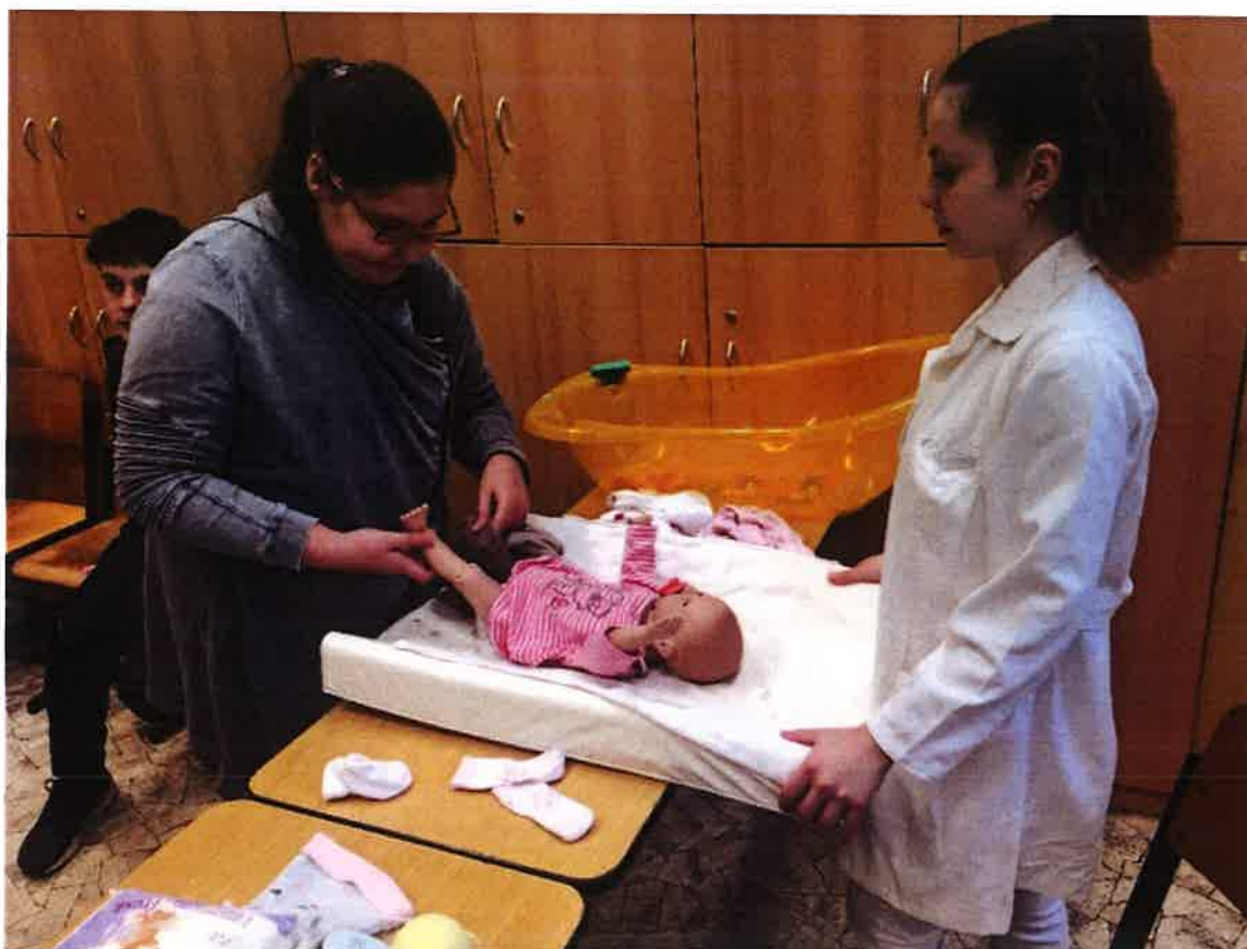
Den pro řemeslo – leden 2020