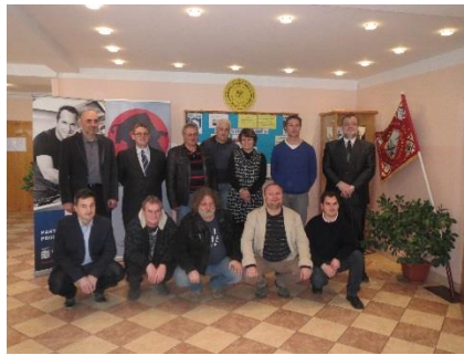
Soutěž klempířů ve Stochově

Soutěžící měli za úkol nejen teoretický test, ale hlavně praktický úkol: provedení drážkové krytiny na sedlové střeše se střešním prostupem (arkýřem) a oplechování plochy střechy, včetně štítového lemování a odvětraného hřebene.