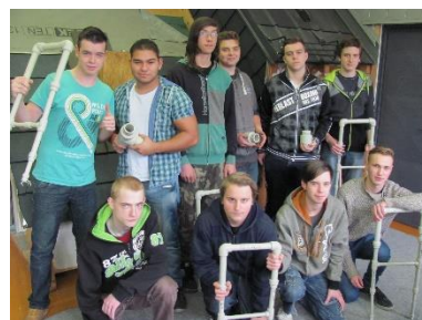
Kurs svařování plastů – instalatér 2. ročník

Kurs svařování plastů úspěšně zvládlo 10 žáků druhého ročníku, kurs svařování plamenem absolvovalo 6 žáků třetího ročníku, z nichž jeden získal pouze potvrzení o zaškolení, a zbývajících 5 bylo úspěšných.