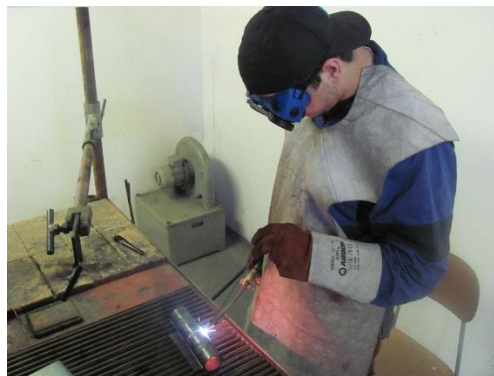
Kurs svařování plamenem – instalatér 3. ročník

Kursy svařování jsou zajišťovány akreditovanými svařečskými školami - pro plasty UNO Praha s.r.o, a pro plamenové svařování AZ Welding Praha, s.r.o.