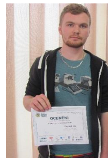
Soutěž „O zlatou kuklu společnosti SIAD“ v Mostě

Ke zvýšení profesních dovedností slouží také kurs svařování . Pro klempíře organizujeme kurs svařování elektrickým obloukem v ochranném plynu. Finančně se na kursu podílí škola, Sdružení