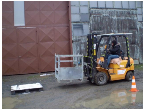
Kurs manipulační techniky – vysokozdvíhové vozíky

Žáci v případě úspěšného složení zkoušky získají oprávnění pro manipulaci s vozíky na elektrický pohon, nebo pohon se spalovacím motorem a to skupiny A - plošinové, nízkozdvíhové, tažné a tlačné ručně vedené, skupiny D vysokozdvíhové ručně vedené, skupiny E – vysokozdvíhové s pákovým řízením a skupiny W1 – vysokozdvíhové s volantovým řízením do 5t nosnosti.