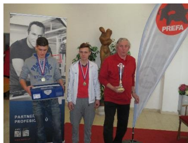
Soutěž klempířů ve Stochově

Nelehkého úkolu hodnocení se ujala odborná porota složená ze zástupců Cechu klempířů, firem Prefa a Berner. A že neměli úkol lehký, o tom svědčí velmi vyrovnané výkony všech družstev. Konečné rozuzlení se soutěžící, jejich učitelé, hosté a veřejnost dověděli při slavnostním vyhlášení výsledků v obřadní síni Městského úřadu Stochov.