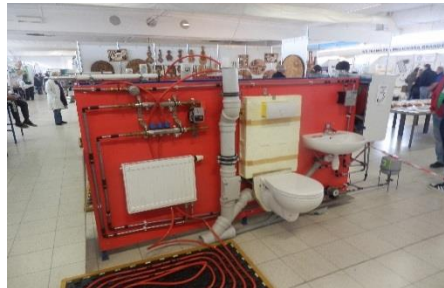
Soutěž instalatérů v Lysé nad Labem

Dále se také konaly dvě soutěže s teoretickým zaměřením , a to MĚŘ 2016 a Vědomostní olympiáda. Obě soutěže byly řízeny ze školy Brno- Bosonohy společně s Cechem topenářů a instalatérů.