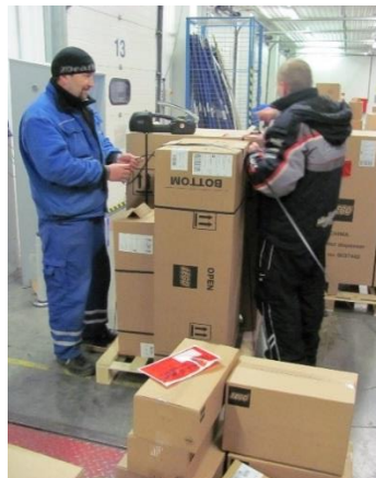
Práce žáků na pracovištích

Ke zvýšení profesní kvalifikovanosti se každoročně organizuje kurz Obsluhy manipulační techniky – vysokozdvíhových vozíků umožňující získání osvědčení pro manipulaci se skladovými vozíky. Tuto činnost pro nás smluvně zajišťuje vzdělávací středisko Horizont v Novém Strašecí. Výuka se skládá z 5 denní teoretické výuky, jednodenní praktické výuky jízd a manipulace s technikou. Na závěr konají žáci zkoušku formou testu.