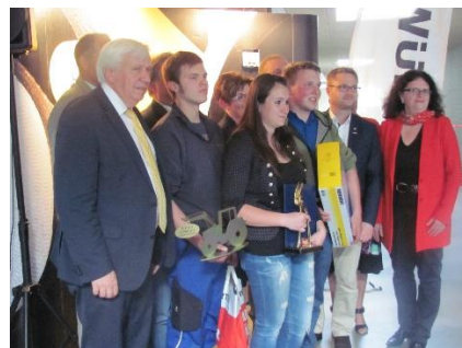
Návštěva Mistelbachu – vyhlášení výsledků soutěže klempířů