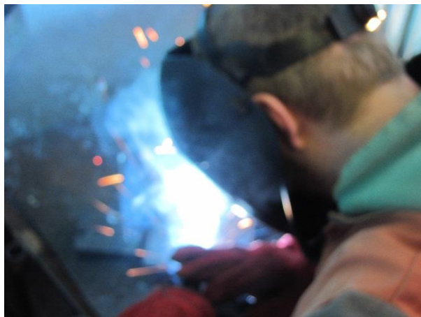
Kurs svařování – svařování v ochranné atmosféře

rodičů a pak také žáci, či jejich zákonní zástupci. K úspěšnému zvládnutí kursů je třeba získat potřebné znalosti v oblasti BOZP, technologie svařování a také konečně svařit potřebné vzorky – svaření plechů na tupo a koutové svary v polohách vodorovných a svislých. To vše zhodnotí akreditovaný zkušební komisař a úspěšní žáci obdrží příslušná svářečská oprávnění. Kurs svařování úspěšně dokončili 4 žáci.