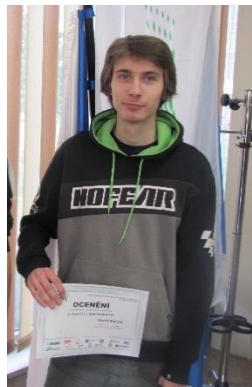
Soutěž „O zlatou kuklu společnosti SIAD“ v Mostě

Instalatérská profese si žádá další odborné znalosti a dovednosti, ke kterým jistě patří svařování. Také v této oblasti se daří organizovat svařečské kursy . Ve druhém ročníku to je kurs na svařování plastů, v ročníku třetím kurs plamenového svařování, včetně zaškolení na pájení měděných trubek a tvarovek. Finančně se na kursu podílí škola, Sdružení rodičů a pak také žáci, či jejich zákonní zástupci.