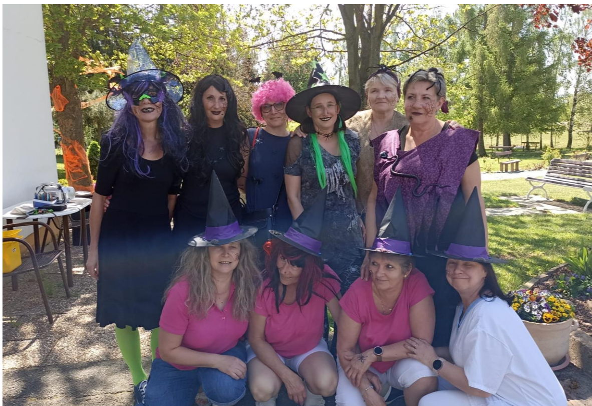
Pálení čarodějnic se vydařilo