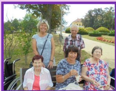
Výlety s vozíčky