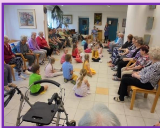
Spolupráce s MŠ a ZŠ