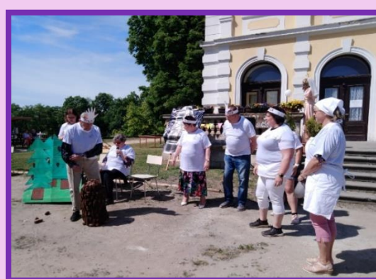
1.místo Lyský pětiboj