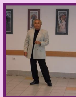
Duo Ruggieri – operní árie a balet