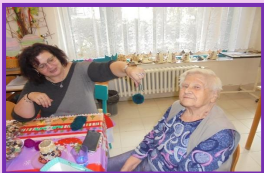
Rukodělná dílna Olbrachtova ulice