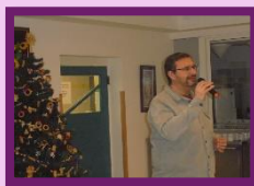
Vánoční čas a koncerty