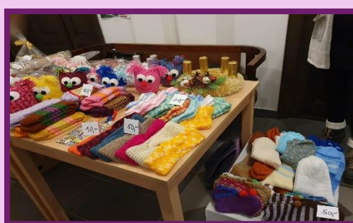
Výrobky z naší dílny