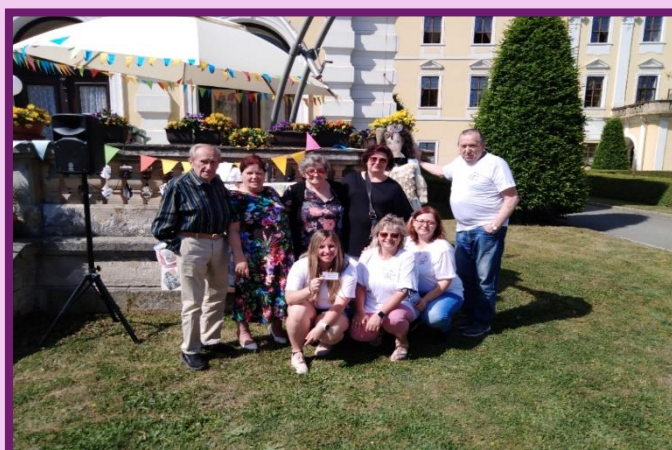
Lyský pětiboj – soutěž domovů pro seniory – 1. místo