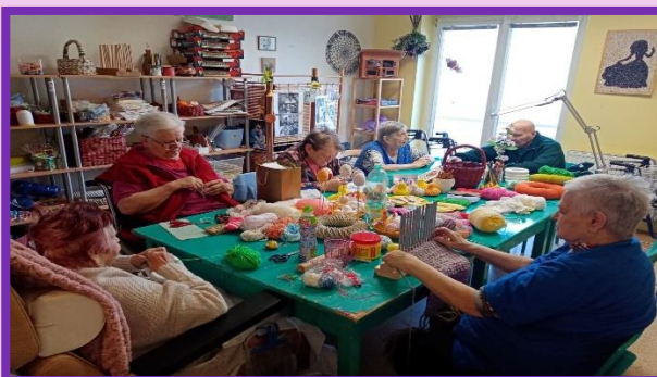
Rukodělná dílna ulice Na Celně