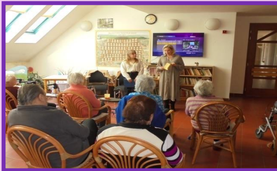
Beseda „Dvě na cestě“