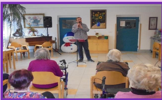
Hudební vystoupení pan Pečenka