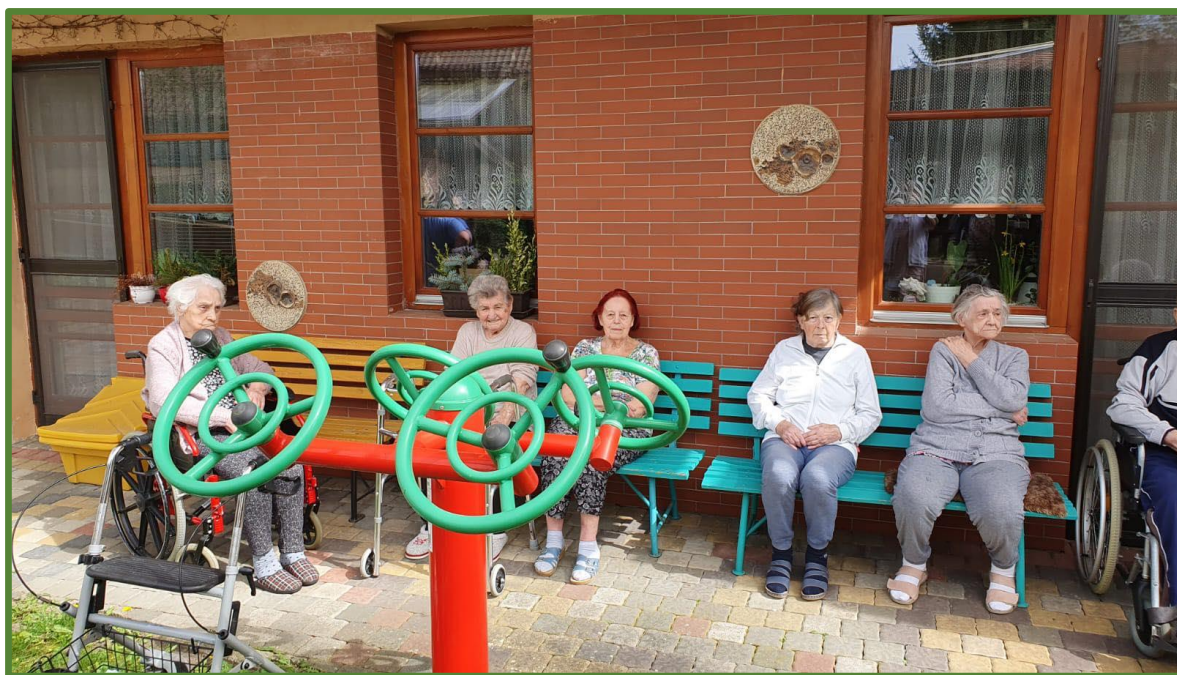
08.04.2024 Zahradní posezení v našem DS