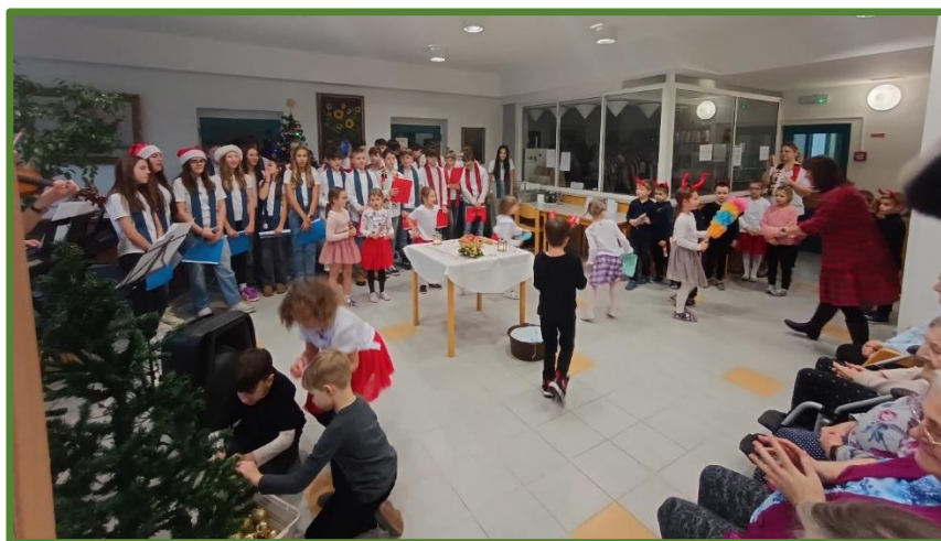
Předvánoční vystoupení žáků ze 3. Základní školy