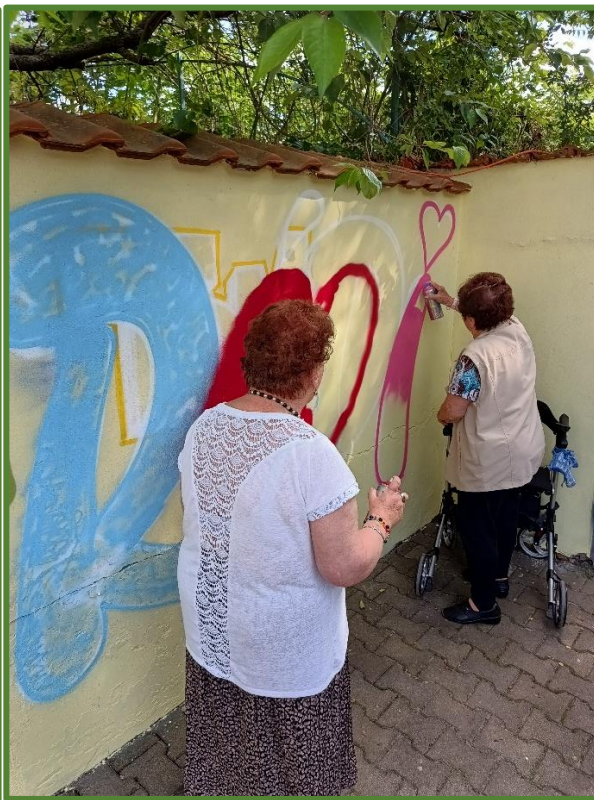
05.06.2024 StreetArt v podání našich seniorů