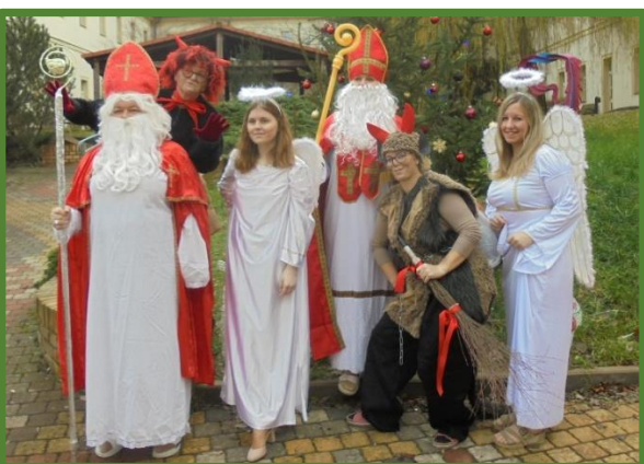
I v našem Domově chodil Mikuláš