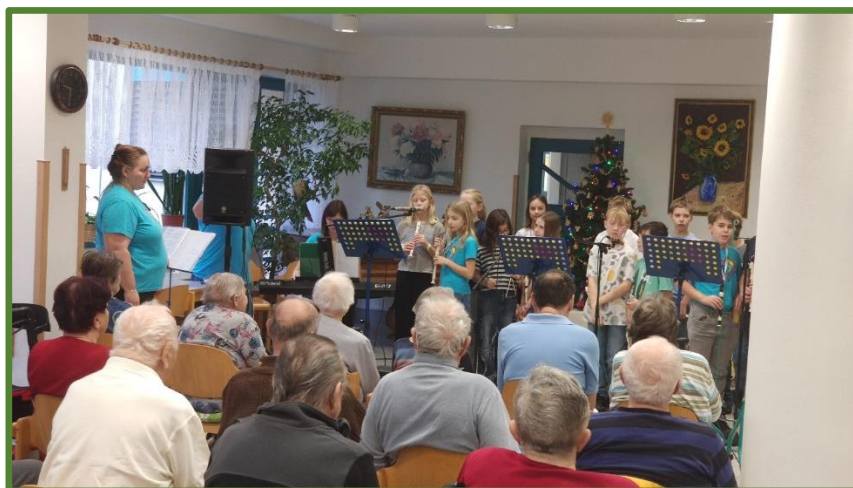
17.12.2024 Vánoční koledy v podání žáků Dalovické základní školy