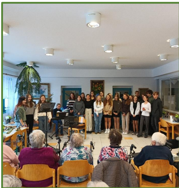
16.01.2024 Vystoupení žáků osmiletého Gymnázia