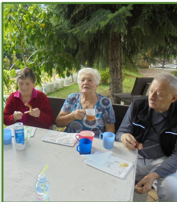
18.09.2024 „Buřtování“ v naší zahradě