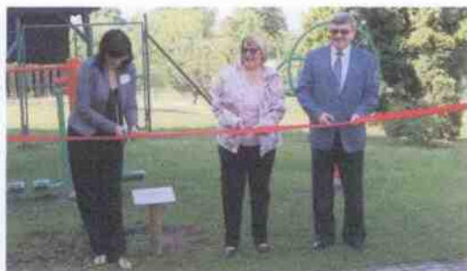
Za cvičicí stroje vděčíme ZAMĚSTANECKÉ POJIŠŤOVNĚ ŠKODA.